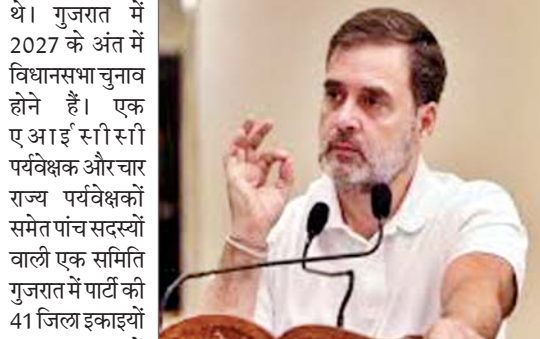
राहुल गांधी गुजरात में कांग्रेस कार्यकर्ताओं को संबोधित करते हैं।

मोडासा (गुजरात)। कांग्रेस नेता राहुल गांधी ने बुधवार को कहा कि गुजरात में पार्टी कार्यकर्ता भले ही हतोत्साहित दिख रहे हैं, लेकिन केवल उनकी पार्टी ही राष्ट्रीय स्वयंसेवक संघ (आरएसएस) और भाजपा को हरा सकती है। एक सप्ताह में गुजरात की अपनी दूसरी यात्रा के दौरान कांग्रेस सांसद ने राज्य में संगठन को नया रूप देने के लिए रोडमैप पेश किया और पार्टी के उन नेताओं को हटाने का वादा किया जो या तो निर्पक्ष हैं या भाजपा के लिए काम करते हैं। उन्होंने कभी अपना गढ़ रहे गुजरात को अपनी पार्टी के लिए सबसे महत्वपूर्ण राज्य बताया और राष्ट्रीय स्वयंसेवक संघ (आरएसएस) तथा 30 वर्षों से राज्य की सत्ता पर काबिज भारतीय जनता पार्टी (भाजपा) को हराने का संकल्प व्यक्त किया। गांधी गुजरात में संगठन को नया रूप देने के कांग्रेस के प्रयासों के तहत जिला इकाइयों को मजबूत करने की प्रायोगिक योजना शुरू करने के बाद अरवल्ली जिले के मोडासा शहर में बुधवार को कांग्रेस कार्यकर्ताओं को संबोधित कर रहे थे। गुजरात में 2027 के अंत में विधानसभा चुनाव होने हैं। एक एआई सीएसी पर्यवेक्षक और चार पर्यवेक्षकों समेत पांच सदस्यों वाली एक समिति गुजरात में पार्टी की 41 जिला इकाइयों (आठ शहरों समेत) में से प्रत्येक के लिए नए प्रमुखों की नियुक्ति की प्रक्रिया को देखरेख करेगी, जिसकी शुरुआत अरवल्ली जिले से होगी। अपने संबोधन में गांधी ने कार्यकर्ताओं से कड़वें वादे किए जैसे कि जिला इकाइयों को अधिक शक्ति एवं धन उपलब्ध कराना, वरिष्ठ नेताओं-कार्यकर्ताओं के प्रदर्शन का आकलन करना, जमीनी स्तर पर सक्रिय पदाधिकारियों को बढ़ावा देना और उन