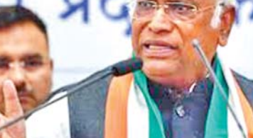
नयी दिल्ली। कांग्रेस अध्यक्ष मल्लिकार्जुन खरवे ने नेशनल हेराल्ड मामले का परोक्ष रूप से हवाला देते हुए बुधवार को आरोप लगाया कि प्रधानमंत्री नरेन्द्र मोदी के नेतृत्व वाली निरंकुश सरकार अपने पाप पर पर्दा डालने के लिए उनकी पार्टी को निशाना बनाने पर तल्ली हुई है।

उन्होंने यह भी कहा कि कांग्रेस उलने वाली नहीं है और वह सरकार की नाकामियों को उजागर करती रहेगी। खरवे ने एक्स पर पोस्ट किया, नरेन्द्र मोदी जी, आपकी निरंकुश सरकार अपने पाप पर पर्दा डालने के लिए कांग्रेस को निशाना बनाने पर तल्ली हुई है। भाजपा का आर्थिक कुप्रबंधन नियंत्रण से बाहर होता जा रहा है। हाताशा बढ़ती जा रही है, कोई दृष्टि नहीं, कोई समाधान नहीं, केवल ध्यान भटकाना। उन्होंने दावा किया कि व्यापार घाटा तीन साल के उच्चतम स्तर पर पहुंच गया है और टैरिफ एवं व्यापार युद्ध पर कोई स्पष्टता नहीं दिख रही है तथा केवल खोखले शब्द और निरर्थक मुलाकातें हो रही हैं। कांग्रेस अध्यक्ष ने एक सर्वेक्षण का हवाला देते हुए कहा कि 90 प्रतिशत उपभोक्ताओं ने बताया कि वस्तुओं की कीमतें बढ़ गई हैं। 180 प्रतिशत से अधिक लोगों का कहना है कि उनका खर्च बढ़ गया, भले ही आय में वृद्धि नहीं हुई। खरवे ने कहा कि वित्त वर्ष 2025 में एफएमसीजी कंपनियों की राजस्व वृद्धि धीमी होकर केवल पांच प्रतिशत रह गई है। उन्होंने दावा किया, मोदी सरकार ने पेट्रोल, डीजल और ईंधन पर कर शुल्क के रूप में (दिसंबर, 2024 तक) 39 लाख करोड़ रुपये का भारी संग्रह किया। रसीदें गैस की कीमतें 50 रुपये तक बढ़ाई गईं।