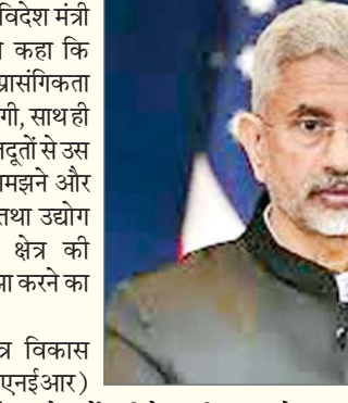
विदेश मंत्री एस जयशंकर ने कहा कि पूर्वोत्तर भारत की प्रासंगिकता समय के साथ बढ़ेगी, साथ ही उन्होंने विदेशी राजदूतों से उस क्षेत्र को देखने, समझने और अपनी सरकारों तथा उद्योग जगत के साथ क्षेत्र की खासियत को साझा करने का आग्रह किया।

नयी दिल्ली। विदेश मंत्री एस जयशंकर ने कहा कि पूर्वोत्तर भारत की प्रासंगिकता समय के साथ बढ़ेगी, साथ ही उन्होंने विदेशी राजदूतों से उस क्षेत्र को देखने, समझने और अपनी सरकारों तथा उद्योग जगत के साथ क्षेत्र की खासियत को साझा करने का आग्रह किया। पूर्वोत्तर क्षेत्र विकास मंत्रालय (डीओएनईआर) द्वारा आयोजित होने जा रहे पूर्वोत्तर निवेशक शिखर सम्मेलन 2025 के लिए राजदूतों की एक बैठक को डिजिटल माध्यम से संबोधित करते हुए जयशंकर ने मंगलवार को कहा कि पूर्वोत्तर क्षेत्र कई प्रमुख भारतीय नीतियों - पड़ोसी प्रथम, एकट इस्ट या बंगाल की खाड़ी बहु-क्षेत्रीय तकनीकी और आर्थिक सहयोग पहल (बिम्स्टेक) के केंद्र में है। उन्होंने कहा कि पूर्वोत्तर हमारे पांच पड़ोसियों से जमीन से जुड़ा हुआ है, इसकी सीमाएं भारतीय उपमहाद्वीप और आसियान (दक्षिण-पूर्व एशियाई राष्ट्रों का संगठन) देशों से जुड़ी हैं। उन्होंने कहा कि केंद्र सरकार ने पूर्वोत्तर क्षेत्र के विकास को प्राथमिकता दी है। उन्होंने अपने संबोधन में कहा कि हम चाहते हैं कि आप इसकी कई खूबियों से परिचित हों और इसे अपनी सरकार और उद्योग जगत के साथ साझा करें। साथ ही, विभिन्न क्षेत्रों में उनके साथ अंतरराष्ट्रीय सहयोग को बढ़ावा दें। बाद में मंत्री ने राजदूतों के साथ बैठक के बारे में एक्स पर पोस्ट किया। उन्होंने दक्षिण पूर्व एशिया के प्रवेश द्वार, पर्यटन केंद्र और वैश्विक कार्यस्थल में योगदानकर्ता के रूप में पूर्वोत्तर की बढ़ती प्रासंगिकता पर प्रकाश डाला।