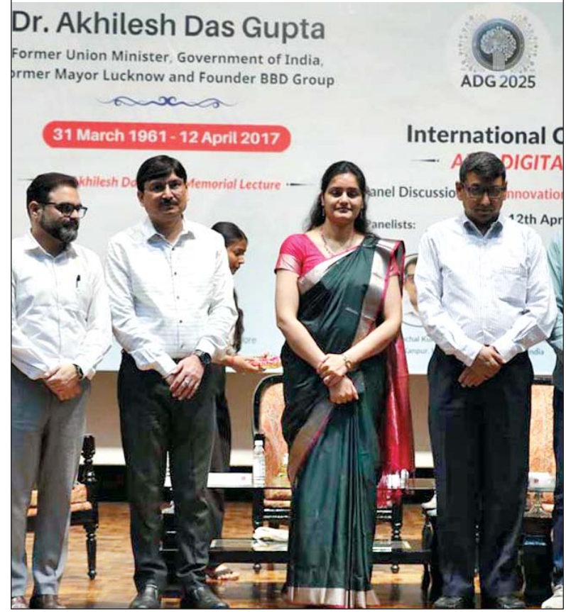
बीबीडी कैपस स्थित ऑडिटोरियम में आयोजित इंटरनेशनल कॉन्फ्रेंस ऑन ए आई इन डिजिटल ग्रोथ का आयोजन