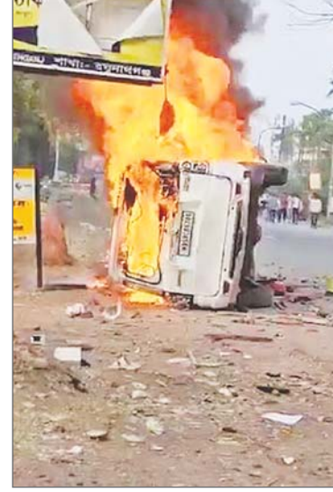
लोगों को गिरफ्तार किया गया है। अफसरों ने बताया कि हिंसा प्रभावित इन स्थानों पर शनिवार सुबह स्थिति तनावपूर्ण रही, लेकिन किसी अग्रिम घटना की खबर नहीं है। उन्होंने बताया कि सर्वाधिक प्रभावित मुर्शिदाबाद जिले में निषेधाज्ञा लागू कर दी गई है और उन स्थानों पर इंटरनेट सेवाएं निलंबित कर दी गई हैं जहां हिंसा हुई थी। एक अधिकारी ने कहा सुती और शमशेरगंज इलाकों में गश्त जारी है। किसी को भी कहीं भी इकट्ठा होने की अनुमति नहीं है। हम कानून और व्यवस्था की स्थिति को बाधित करने के किसी भी प्रयास की अनुमति नहीं देंगे। उन्होंने लोगों से सोशल मीडिया पर अफवाहों पर ध्यान न देने की अपील की। इस बीच, पुलिस ने बताया कि सुती में झड़प के दौरान कथित तौर पर पुलिस की गोलीबारी में घायल हुए एक नाबालिग लड़के को कोलकाता के एक अस्पताल में भर्ती कराया गया है। जिन जिलों में हिंसा हुई, उनमें मुस्लिम आबादी काफी है। भारतीय जनता पार्टी (भाजपा) ने ममता बनर्जी सरकार पर हमला करते हुए कहा कि अगर वह

एजेंसी कोलकाता। पश्चिम बंगाल के मुस्लिम बहुल मुर्शिदाबाद जिले में वक्फ (संशोधन) अधिनियम के विरोध में प्रदर्शन के दौरान भड़की हिंसा के सिलसिले में 110 से अधिक लोगों को गिरफ्तार किया गया। पुलिस ने शनिवार को यह जानकारी दी। हिंसा प्रभावित मुर्शिदाबाद में स्थानीय तौर पर उपलब्ध लगभग 300 बीएसएफ कर्मियों के अलावा पश्चिम बंगाल सरकार के अनुरोध पर पांच और कंपनी तैनात की गई। केंद्रीय गृह सचिव ने कहा कि केंद्र स्थिति पर करीब से नजर रख रहा है, उन्होंने पश्चिम बंगाल को हसंभव सहायता का आश्वासन भी दिया है।