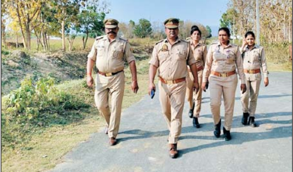
जिला संवाददाता (vol)

बलरामपुर । थाना हर्षैया पुलिस टीम द्वारा ऑपरेशन कवच के अन्तर्गत एण्डो- नेपाल बार्डर से सटे हुए थाना हर्षैया क्षेत्रांतर्गत ग्राम सहिजनवा के ग्राम सुरक्षा समिति के लोगों, ग्राम प्रधान, सेवानिवृत्त सरकारी