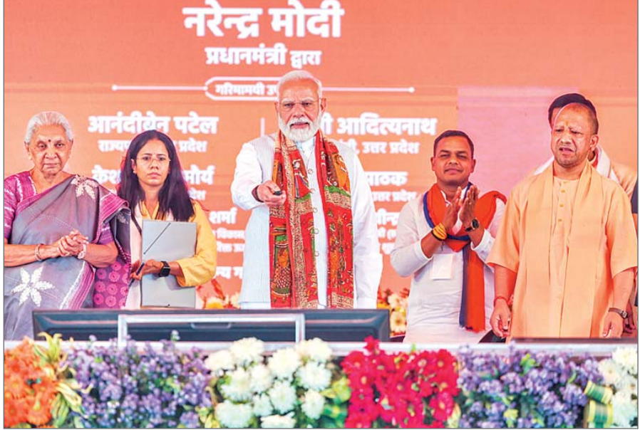
और सावित्रीबाई फुले जी ने जीवन भर नारीशक्ति के हित, उनके आत्मविश्वास और समाज कल्याण के लिए काम किया। मोदी ने कहा कि आज हम उनके विचारों को नई ऊर्जा