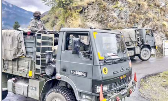
सुरक्षा एजेंसियों ने जम्मू क्षेत्र के पहाड़ी जिलों में विभिन्न स्थानों के बीच संभावित रूप से आवाजाही करने वाले आतंकवादियों की टोह के लिए निगरानी का दायरा डोडा जिले के भद्रवाह क्षेत्र तक बढ़ा दिया है। अधिकारियों ने कहा कि जिले के चतस्र क्षेत्र में जम्मू-कश्मीर पुलिस और सेना द्वारा संयुक्त रूप से खुफिया

एजेंसी जम्मू। जम्मू-कश्मीर के किश्तवाड़ जिले में शुक्रवार को सुरक्षा बलों से हुई मुठभेड़ में एक आतंकवादी मारा गया, जबकि उधमपुर जिले में तीन आतंकवादियों के एक समूह का पता लगाने के लिए अलग से एक अभियान जारी है। सेना के अधिकारियों ने यह जानकारी दी।