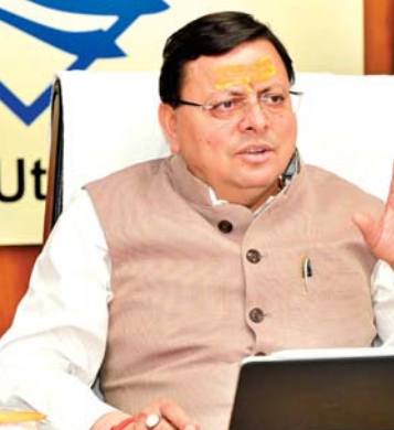
को लिखने एवं उनका संरक्षण गढ़वाल एवं कुमाऊं विश्वविद्यालय की मदद से किया जाएगा। लोक कलाकारों के लिए इस प्रकार की व्यवस्था बनाई जाए, जिससे उनकी लगातार भुगतान हो। मुख्यमंत्री ने स्थानीय जनप्रतिनिधियों और अधिकारियों को यात्रा से ...शेष पृष्ठ 14 पर

देहरादून। उत्तराखंड सरकार वर्ष 2026 में प्रस्तावित नंदा राजजात यात्रा को लोक उत्सव के रूप में मनाएगी। इसके लिए नंदा देवी राजजात यात्रा का देश विदेश में व्यापक प्रचार प्रसार किया जाएगा। भारतीय दूतावासों के माध्यम से भी संपूर्ण विश्व में नंदा देवी राजजात यात्रा को पहुंचाया जाएगा। यह विचार मुख्यमंत्री पुष्कर सिंह धामी ने सचिवालय में नंदा राजजात यात्रा की तैयारियों के सम्बन्ध में आयोजित बैठक को सम्बोधित करते हुए दिये। उन्होंने कहा कि यह यात्रा उत्तराखंड की धरोहर है। अतः इस यात्रा के माध्यम से विदेशों से भी उत्तराखंड को जोड़ते हुए इसे ऐतिहासिक रूप देना है। उन्होंने कहा कि