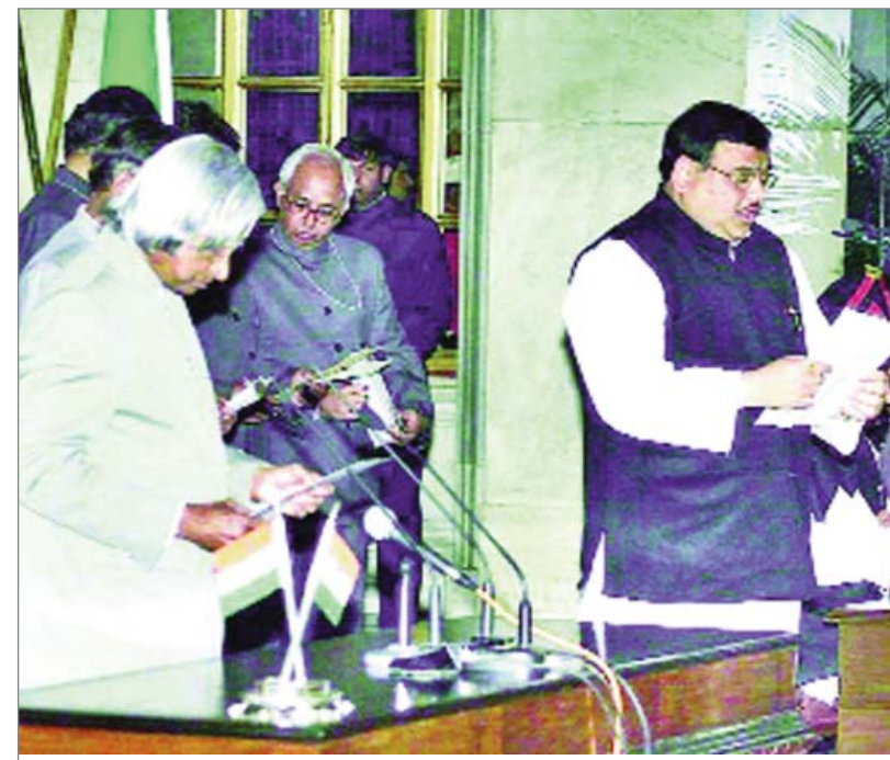
बतौर केंद्रीय राज्यमंत्री शपथग्रहण करते डॉ. अखिलेश दास गुप्ता। तत्कालीन राष्ट्रपति एपीजे अब्दुल कलाम ने शपथ ग्रहण कराया