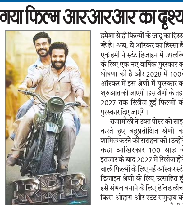
खलीफा पर चढ़ते हुए दिखाया गया है। एकेडमी ने आधिकारिक इंस्टाग्राम पर तस्वीर साझा करते हुए लिखा, स्टैंड

नयी दिल्ली। एकेडमी ऑफ मोशन पिक्चर आर्ट्स एंड साइंसेज द्वारा घोषित ऑस्कर की नयी श्रेणी अचीवमेंट इन स्टैंडर्ड डिजाइन में फिल्म निर्देशक एस.एस. राजामौली की फिल्म आरआरआर के लड़ाई के एक दृश्य को चुना गया है। फिल्म आरआरआर के लड़ाई के इस दृश्य में जूनियर एनटी आर बाघ की ओर झपटते हुए नजर आ रहे हैं। फिल्म आरआरआर के गीत नाटू-नाटू ने ऑस्कर 2023 में सर्वश्रेष्ठ मूल गीत का खिताब जीता था। फिल्म में लड़ाई का उक्त दृश्य उन तीन तस्वीरों में से एक है, जिन्हें ऑस्कर की इस श्रेणी के लिए चुना गया है। अन्य दो तस्वीरें मिशेल योह अभिनेता 2022 की मल्टीवर्स गाथा एवरविंग एवरवीयर ऑल्ट्रानेक्स और टॉम क्रूज अभिनेता 2011 में आई मिशन इम्पॉसिबल-घोस्ट प्रोटोकॉल से हैं। इसमें क्रूज के किरदार एथन हंट को दुबई के बुर्ज