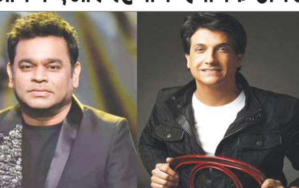
असाधारण साबित होगा। इसके लिए श्यामक से बेहतर कौन हो सकता है। डावर ने कहा कि वह रहमान के साथ फिर से काम करने को लेकर रोमांचित हैं। कोरियोग्राफर ने कहा, उनके पास अपने संगीत के माध्यम से दिलों को छूने की एक अद्वितीय क्षमता है, और मैं नृत्य के माध्यम से उनकी रचनाओं को जीवंत बनाने के लिए रोमांचित हूं।

मुंबई। संगीतकार ए. आर. रहमान ने अगले महीने होने वाले अपने बहुप्रतीक्षित 'द वंडरमेंट टूर' में प्रसिद्ध कोरियोग्राफर श्यामक डावर से साथ मुच मचाते नजर आएंगे। यहां जारी एक प्रेस विलेजि में कहा गया है कि वंडरमेंट टूर रहमान की संगीत विरासत का एक भव्य उत्सव होगा और यह दर्शकों को उनके सदाबहार हिट गीतों के माध्यम से एक शानदार यात्रा पर ले जाएगा, जबकि डावर अपनी कोरियोग्राफी के जलवे बिखेरेंगे। रहमान ने एक बयान में कहा, ताल और किसना में साथ काम करने का हमारा सफर अविस्मरणीय रहा और मुझे इसमें कोई संदेह नहीं है कि द वंडरमेंट टूर में वह सचमुच जादू बिखेरेंगे। वंडरमेंट टूर हर मायने में संगीत, नृत्य और जादू का उत्सव है। यह कला के दो रूपों के साथ आने से