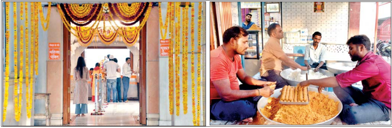
वरिष्ठ संवाददाता (vol)

लखनऊ। श्री हनुमान जन्मोत्सव पर शहर के हनुमान मंदिरों में विशेष सजावट की गई है। शनिवार को बजरंगबली के जयकारों के बीच विशेष आरती होगी। हनुमानजी का विशेष श्रृंगार कर उन्हें सिंदूर अर्पित किया जाएगा। लखनऊ विश्वविद्यालय मार्ग स्थित हनुमान सेतु मंदिर में सोमवार से ही सुबह नौ बजे से अखंड रामायण पाठ का शुभारंभ हुआ। हनुमान सेतु मंदिर के आचार्य ने बताया कि आज सुबह दस बजे से हनुमानजी का अभिषेक षोडशोपचार पूजन, हवन एवं प्रसाद वितरण किया जाएगा। भोर पांच बजे से ही मंदिर का पट खोल दिया गया है। सुबह छह बजे पवनपुत्र हनुमान की आरती में सैकड़ों भक्त शामिल हुए। आज दोपहर में हनुमान जी की विशेष आरती भी की जाएगी। उसके बाद रात आठ बजे आरती की जाएगी।