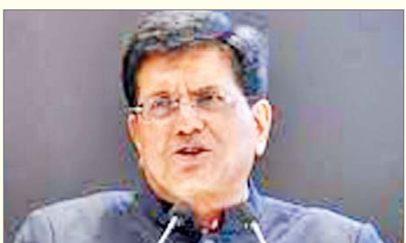
नहीं होती। दोनों देशों ने इस वर्ष शरद ऋतु (सितंबर-अक्टूबर) तक समझौते के पहले चरण को अंतिम रूप देने का लक्ष्य रखा है। इस समझौते का मकसद 2030 तक द्विपक्षीय व्यापार को वर्तमान 191 अरब अमेरिकी डॉलर से दोगुना कर 500 अरब डॉलर तक पहुंचाना है। भारत-यूरोपीय संघ (ईयू) व्यापार समझौते पर गोयल ने

नयी दिल्ली। वाणिज्य एवं उद्योग मंत्री पीयूष गोयल ने शुक्रवार को कहा कि भारत प्रस्तावित द्विपक्षीय व्यापार समझौते (बीटीए) पर अमेरिका के साथ बातचीत में सरकार, देश तथा जनता के हितों की रक्षा करेगी और जल्दबाजी में कोई भी कदम उठाना उचित नहीं है। उन्होंने कहा कि देश की सभी व्यापार वार्ताएं भारत पहले के दृष्टिकोण के साथ अच्छी तरह से आगे बढ़ रही हैं और विकसित भारत 2047 का मार्ग सुनिश्चित कर रही हैं। भारत-अमेरिका द्विपक्षीय व्यापार समझौते की प्रगति के बारे में पूछे जाने पर गोयल ने पत्रकारों से कहा, हमने पहले भी कई बार कहा है कि हम बंदूक की नोक पर बात नहीं करते हैं। समयबद्ध तरीके से काम करना अच्छा है लेकिन जब बात देश हित और जनहित की हो तो तब किसी भी तरह की जल्दबाजी अच्छी