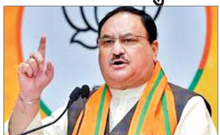
बदलने के बाद ओडिशा और दिल्ली में यह योजना लागू हो गई। बंगाल के लोगों को भी यह सुविधा मिलेगी और भाजपा भारत के सभी नागरिकों को यह स्वास्थ्य योजना प्रदान करने के लिए प्रतिबद्ध है। नड्डा ने दावा किया कि जिन राज्य सरकारों ने नरेन्द्र मोदी सरकार की कल्याणकारी योजनाओं के क्रियान्वयन में बाधाएं डाली, उन्हें इसकी कोमत चुकानी पड़ी है। लोगों ने ओडिशा और दिल्ली की सरकारों को खारिज कर दिया है।

कटक। केंद्रीय स्वास्थ्य मंत्री जे. पी. नड्डा ने शुक्रवार को ओडिशा में आयुष्मान भारत योजना की औपचारिक शुरुआत की। उन्होंने उम्मीद जताई कि केंद्रीय स्वास्थ्य बीमा योजना जल्द ही पड़ोसी राज्य पश्चिम बंगाल में लागू होगी। पश्चिम बंगाल एकमात्र राज्य है, जहां पर केंद्र की यह योजना प्रभावी नहीं है। भारतीय जनता पार्टी (भाजपा) के ओडिशा की सत्ता में आने के 10 महीने बाद राज्य में आयुष्मान भारत योजना लागू की गई है। वहीं, तृणमूल कांग्रेस शासित पश्चिम बंगाल में यह योजना अब तक लागू नहीं की गई है, जहां पर 2026 में विधानसभा चुनाव होने हैं। नड्डा ने कहा कि भाजपा सरकार ने ओडिशा के लोगों से किए गए अपने वादों को पूरा किया है। उन्होंने कहा कि पश्चिम बंगाल की तृणमूल कांग्रेस सरकार आयुष्मान भारत योजना को लागू करने की केंद्र की अपील लगातार खारिज कर रही है। उन्होंने कहा कि ओडिशा, दिल्ली और पश्चिम बंगाल तीन राज्य ऐसे थे, जहां आयुष्मान भारत योजना लागू नहीं की गई थी। हालांकि, इन राज्यों में सरकार