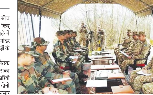
समकक्षों के साथ घुसपैठ के प्रयासों, संघर्ष विराम उल्लंघन और आईईडी विस्फोटों का मुद्दा उठाया और उनके समक्ष विरोध दर्ज कराया। सीमावर्ती बिंदु चकन-दा-बाग क्षेत्र में दो अप्रैल को 75 मिनट तक चलने वाली ब्रिगेड कमांडर स्तर की फ्लैग मीटिंग हुई थी, जिसमें दोनों पक्षों ने सीमाओं पर शांति बनाए रखने की आवश्यकता का उल्लेख किया था। रक्षा प्रवक्ता ने बुधवार को बताया कि एक अप्रैल को जम्मू-कश्मीर के पुंछ जिले में एलओसी पर एक बारूदी सुरंग के फटने के बाद

जम्मू। भारत और पाकिस्तान की सेना के बीच सीमा प्रबंधन से जुड़े मुद्दों पर चर्चा के लिए बृहस्पतिवार को जम्मू-कश्मीर के पुंछ जिले में नियंत्रण रेखा (एलओसी) के पास ब्रिगेड कमांडर स्तर की फ्लैग मीटिंग हुई। इस महीने दोनों पक्षों के बीच यह इस तरह की दूसरी बैठक है। अधिकारियों ने बताया कि यह बैठक सीमावर्ती बिंदु चकन-दा-बाग पर हुई जिसका नेतृत्व दोनों पक्षों के ब्रिगेडियर स्तर के अधिकारियों ने किया। रक्षा प्रवक्ता ने कहा फ्लैग मीटिंग दोनों पक्षों के बीच डीजीएमओ की समझ के अनुसार एलओसी और सीमा प्रबंधन से जुड़ी नियमित प्रक्रिया है। उन्होंने कहा कि बृहस्पतिवार की बैठक एलओसी पर नियमित मुद्दों पर चर्चा करने के लिए आयोजित की गई थी। आधिकारिक सूत्रों ने बताया कि भारतीय सेना के अधिकारियों ने अपने