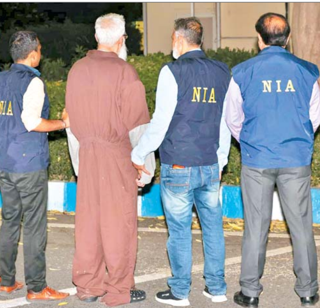
यूएसडीओजे, अमेरिकी स्काई मार्शल की सक्रिय सहायता से एनआईए ने संपूर्ण प्रत्यर्पण प्रक्रिया के दौरान अन्य भारतीय खुफिया एजेंसियों, एनएसजी के साथ मिलकर काम किया, जिसमें भारत के विदेश मंत्रालय और गृह मंत्रालय ने भी मामले को सफल निष्कर्ष तक ले जाने के लिए अमेरिका में अन्य संबंधित अधिकारियों के साथ समन्वय किया। राणा के दिल्ली पहुंचने की

एजेंसी नयी दिल्ली। राष्ट्रीय अन्वेषण अधिकरण (एनआईए) ने बृहस्पतिवार को घोषणा की है कि 26111 मुंबई आतंकी हमलों के मुख्य आरोपी तहव्वुर हुसैन राणा को अमेरिका से सफलतापूर्वक प्रत्यर्पित कराने के बाद भारत लाया गया है। अधिकारियों ने बताया कि पाकिस्तानी मूल के 64 वर्षीय कनाडाई नागरिक राणा को बृहस्पतिवार शाम एक विशेष विमान से दिल्ली लाया गया, जिससे कई दिन से जारी इन अटकलों का अंत हो गया कि उसे कब और कैसे प्रत्यर्पित किया जाएगा। एनआईए ने एक बयान में कहा कि 2008 के मुंबई हमलों के मुख्य साजिशकर्ता को न्यायिक प्रक्रिया के दायरे में लाने के लिए वर्षों के सतत एवं ठोस प्रयासों के बाद यह प्रत्यर्पण हुआ है। मुंबई में 26 पाकिस्तानी आतंकवादियों द्वारा 10 नवंबर 2008 को किए गए भीषण हमलों में 166 लोग मारे गए थे। बयान में कहा गया,