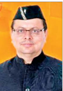
राज्य की स्थानीय अर्थव्यवस्था को मजबूती मिल रही है। मुख्यमंत्री पुष्कर सिंह धामी गुरुवार को मुख्यमंत्री आवास स्थित मुख्य सेवक सदन में आयोजित ओहो हिल यात्रा के चौथे संस्करण रजत से स्वर्ण

प्रमुख संवाददाता देहरादून। मुख्यमंत्री पुष्कर सिंह धामी ने कहा है कि सरकार ने प्रदेश की बरोजगारी दर में रिकॉर्ड 4.4 प्रतिशत की कमी लाकर राष्ट्रीय औसत को भी पीछे छोड़ने का काम किया है। सरकार की एक जनपद, दो उत्पाद योजना से स्थानीय आजीविका के अवसर बढ़ रहे हैं। इसके साथ ही 'हाउस ऑफ हिमालयाज' ब्रांड के माध्यम से हमारे पारंपरिक उत्पादों को राष्ट्रीय और अंतरराष्ट्रीय स्तर पर व्यापक पहचान मिल रही है। उन्होंने कहा कि स्टेट मिलेट मिशन, फार्म मशीनरी बैंक, एप्पल मिशन, नई पर्यटन नीति, नई फिल्म नीति, होम स्टे, वेड इन उत्तराखंड और सौर स्वरोजगार योजना जैसी पहलों से