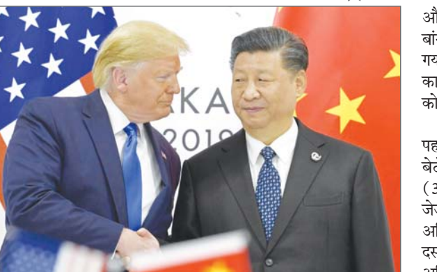
किया, हालांकि उन्होंने चीन से आयात पर शुल्क की दर बढ़ाकर 125 प्रतिशत कर दी है। ट्रंप ने कहा कि ये देश अधिक अनुकूल शर्तों पर बातचीत करने के लिए राजी हैं। चीन ने बातचीत करने से इनकार कर दिया था और कहा था कि अमेरिका मक्कार है और वह शुल्क युद्ध में अंत तक लड़ेगा। इसके बाद ट्रंप ने चीनी आयात पर कर की दर को और बढ़ाकर 125 प्रतिशत कर दिया। चीन ने जवाबी कार्रवाई करते हुए अमेरिकी वस्तुओं पर ...शेष पृष्ठ 14 पर

एजेंसी बीजिंग। अमेरिका द्वारा शुल्क बढ़ाए जाने के बाद चीन अन्य देशों से संपर्क साध रहा है और ऐसा प्रतीत होता है कि बीजिंग अमेरिका को कदम पीछे हटाने के लिए मजबूर करने के वास्ते संयुक्त मोर्चा बनाने का प्रयास कर रहा है। चीन के गहन प्रयासों के बावजूद उसे कोई खास सफलता नहीं मिल रही है क्योंकि अधिकतर देश अमेरिकी राष्ट्रपति डोनाल्ड ट्रंप के व्यापार युद्ध के केन्द्र में आए चीन के साथ गठजोड़ के इच्छुक नहीं प्रतीत हो रहे। शिंघे क बाजार में मंदी की आशंका के बीच बुधवार को अमेरिकी राष्ट्रपति डोनाल्ड ट्रंप ने ज्यादातर देशों पर लगाए गए शुल्क को अचानक 90 दिनों के लिए स्थगित करने का फैसला