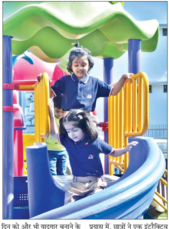
दिन को और भी यादगार बनाने के प्रयास में, छात्रों ने एक इंटरैक्टिव