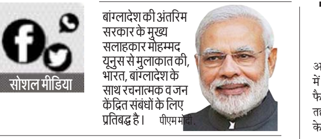
बांग्लादेश की अंतरिम सरकार के मुख्य सलाहकार मोहम्मद यूनूस से मुलाकात की, भारत, बांग्लादेश के साथ रचनात्मक वजन केन्द्रित संबंधों के लिए प्रतिबद्ध है। पीएम मोदी

के अमरीका के इस टैरिफ शिकंजे से होने वाले नुकसान की बात है तो हम पर इससे करीबी 35 अरब रुपये का बोझ बढ़ेगा। हालांकि इससे भारत को फायदा भी हो सकता है। भारत का जिन 10 देशों के साथ सबसे ज्यादा व्यापार है, उनमें से अकेले अमरीका ही वह देश है, जिसके साथ हमारा व्यापार फायदे में है बाकी सब देशों के साथ हम व्यापार घाटे में हैं। लेकिन अमरीका ने जिस तरह से टैरिफ बढ़ाया है उसे देखते हुए कई देश मसलान चीन ही भारत से ज्यादा आयात की सोच रहा है क्योंकि इससे दोनों देशों को फायदा होगा। मतलब यह कि यह टैरिफ बम हमारे लिए फायदे का सौदा साबित हो सकता है। वैसे अमरीका सिर्फ अपने व्यापार घाटे को कम करने के लिए ही टैरिफ बम का सहारा नहीं ले रहा बल्कि इसे एक औद्योगिक रणनीति के तौर पर भी आजमाना चाहता है। यही वजह है कि अमरीका ने कहा है कि अगर कोई कंपनी टैरिफ से छूट चाहेगी है, तो उसे अमेरिका में अपना प्रोडक्ट बनाना होगा। इससे न केवल अमरीकियों को रोजगार मिलेगा बल्कि इस टैरिफ बम से अमेरिका का नए सिरे से औद्योगिक विकास भी होगा। नौकरियां और कारखाने अमेरिका लौटेंगे। यह मन के भीतर का निष्कर्ष नहीं टैरिफ बम के फायदों का खुला नारा भी बनी है। ट्रंप का मानना है कि कई देशों ने अमेरिकी बाजार का फायदा लेकर खुद को समृद्ध बनाया, लेकिन अमेरिकी सामान के लिए