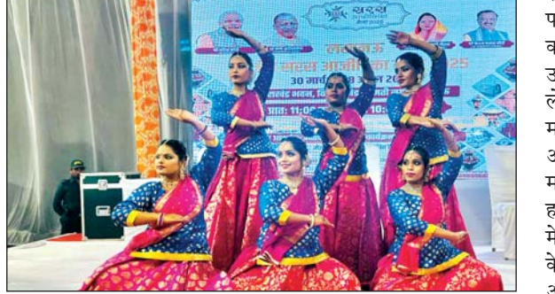
उत्तराखंड भवन विभूति खण्ड गोमतीनगर में 8 अप्रैल चलेगा। यह मेला प्रतिदिन 11 बजे से रात्रि 10 बजे तक चल रहा है। इस मेले में हर उम्र के

इसी तरह रामकथा पार्क अयोध्या धाम में भी क्षेत्रीय सरस मेले का आयोजन किया गया है। अयोध्या में यह मेला 5 अप्रैल तक तथा