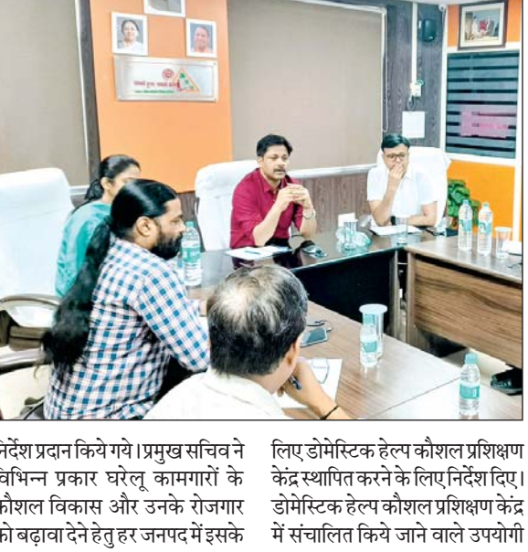
निर्देश प्रदान किये गये। प्रमुख सचिव ने विभिन्न प्रकार के रोल कामगारों के कौशल विकास और उनके रोजगार को बढ़ावा देने हेतु हर जनपद में इसके लिए डोमेस्टिक हेल्प कौशल प्रशिक्षण केंद्र स्थापित करने के लिए निर्देश दिए। डोमेस्टिक हेल्प कौशल प्रशिक्षण केंद्र में संचालित किये जाने वाले उपयोगी