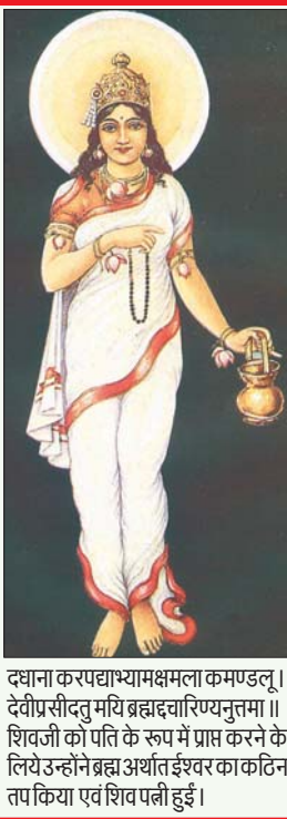
दधाना करणधामामक्षमला कमण्डलु। देवीप्रसीदतु मयि ब्रह्मद्वारिण्यनुत्तमा ॥ शिवजी को पति के रूप में प्राप्त करने के लिये उन्होंने ब्रह्म अर्थात् ईश्वर का कठिन तप किया एवं शिव पत्नी हुई।