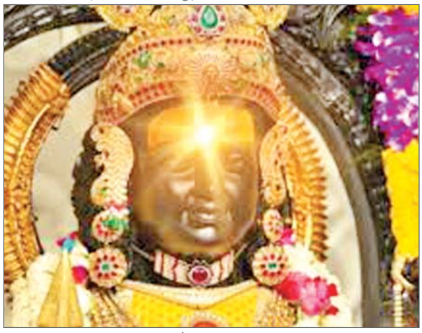
पर तिलक करेंगे। गत वर्ष 17 अप्रैल को रामनवमी पड़ी थी। रामनवमी पर अयोध्या के मंदिर में प्राण प्रतिष्ठा के बाद विराजमान रामलला का पहली बार सूर्य तिलक हुआ था। दोपहर 12 बजकर 01 मिन्नट पर वैज्ञानिकों के द्वारा बनाई तकनीक से रामलला के मस्तक पर सूर्य तिलक हुआ था। जैसे

जिला संवाददाता अयोध्या। रामजन्मभूमि परिसर में सूर्य तिलक का ट्रॉयल किया गया। इसरो के वैज्ञानिक छह अप्रैल को सूर्य की किरण भगवान के मस्तक पर लाने की तकनीकी व्यवस्था कर रहे हैं। गत वर्ष अस्थायी तौर पर रामलला का सूर्य तिलक हुआ था। अब स्थायी तौर पर वैज्ञानिक मंदिर का निर्माण पूरा होने पर सूर्य तिलक की व्यवस्था कर रहे हैं। रामलला के जन्मोत्सव के दिन भगवान के मस्तक का सूर्य अभिषेक होगा। इस निमित्त वैज्ञानिकों ने रविवार को एक मिन्नट का ट्रॉयल किया है। इस दौरान सफलतापूर्वक सूर्य की किरणों रामलला का सूर्य अभिषेक करती नजर आई। रामनवमी को चार मिन्नट तक भगवान सूर्य रामलला का मस्तक