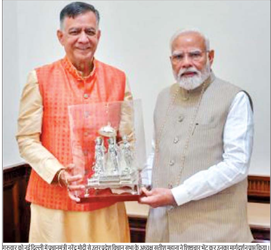
गुरुवार को नई दिल्ली में प्रधानमंत्री नरेंद्र मोदी से उत्तर प्रदेश विधान सभा के अध्यक्ष सतीश महाना ने शिष्टाचार भेंट कर उनका मार्गदर्शन प्राप्त किया।