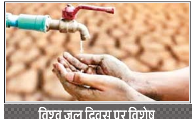
विश्व जल दिवस पर विशेष

भारत में जल का वितरण सर्वत्र एक समान नहीं है। कुछ क्षेत्रों में यह प्रचुर मात्रा में उपलब्ध है तो अन्य क्षेत्रों में इसकी कमी है। आज जरूरत इस बात की है कि जल संबंधी ऐसी वितरण व्यवस्था हो ताकि जल हानि न हो और जल प्रदूषित होने से भी बच जाय। इसे बचाने की कोशिश नहीं हुई तो मानव जीवन का संकट में पड़ना तय है। ध्यान देना होगा कि भूजल जल आपूर्ति का एक महत्वपूर्ण स्रोत है। इसका उचित संरक्षण और उपयोग बेहद आवश्यक है। भारत के जल संसाधन पर नजर दौड़ाएं तो भारत में विश्व के जल संसाधनों का 4 प्रतिशत भाग पाया जाता है। इसका लगभग एक तिहाई भाग वाष्पीकृत हो जाता है। तथा 45 प्रतिशत भाग ढाल के अनुरूप बहकर तालाबों, झीलों और नदियों में चला जाता है। वर्षण से जल की जो थोड़ी-सी मात्रा यानी तकरिबन 22 प्रतिशत मुदा में प्रवेश कर भूमिगत हो जाती है उसे भौम जल या भू-जल कहा जाता है। भारतीय उपमहाद्वीप में भूजल का व्यवहार अत्यधिक जटिल है। जीईसी 1997 के दिशा निदेशों एवं संस्तुतियों के आधार पर देश में स्वच्छ जल के लिए भूजल संसाधनों का आकलन किया गया जिसके मुताबिक देश में कुल वार्षिक पुनः पूरणयोग्य भूजल संसाधनों का मान 433 घन किमी है। प्राकृतिक निस्सरण के लिए 34 बीसीएम जल स्वीकार करते हुए