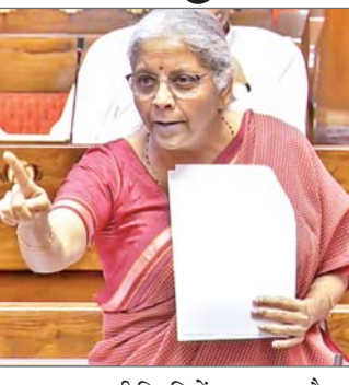
व्यवस्था की स्थिति में सुधार हुआ है। सीतारमण ने पिछले सप्ताह सोमवार को 2025-26 के लिए मणिपुर का बजट पेश किया था, जिसमें 35,103.90 करोड़ रुपये के व्यय का अनुमान किया गया है, जो चालू वित्त

एजेंसी नयी दिल्ली। वित्त मंत्री निर्मला सीतारमण ने मंगलवार को राज्यसभा में कहा कि केंद्र सरकार मणिपुर में सामान्य स्थिति और समृद्धि लाने के लिए प्रतिबद्ध है। इसके साथ ही उन्होंने राज्य के आर्थिक विकास के लिए सभी तरह का समर्थन देने का आश्वासन दिया। वित्त मंत्री ने उच्च सदन में यह बात मणिपुर के बजट और उससे संबंधित अनुदान की अनुपूरक मांगों पर हुई चर्चा का जवाब देते हुए कही। उन्होंने इस बात पर जोर दिया कि कुछ छिटपुट घटनाओं को छोड़कर पूर्वांचल राज्य में कुल मिलाकर कानून