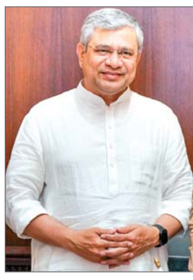
भी कहा कि इस साल रेलवे स्कोप-1 नेट जीरो के लक्ष्य को प्राप्त कर लेगा जो बहुत बड़ा लक्ष्य है। वहीं दूसरी ओर रेल मंत्री अश्विनी वैष्णव ने रेलवे में रोजगार और रेल भर्ती परीक्षाओं को लेकर विपक्ष की चिंताओं को खारिज करते हुए मंगलवार को लोकसभा में कहा कि पिछले एक दशक में रेलवे में पांच लाख रोजगार दिए गए हैं और इसमें आरक्षण के सभी नियमों का पालन किया गया है। रेल मंत्रालय के नियंत्रणाधीन अनुदान मांगों पर निर्यात सदन में हुई चर्चा पर जवाब देते हुए वैष्णव ने कहा कि प्रधानमंत्री मोदी की सरकार ने रेलवे में पांच लाख लोगों को रोजगार दिया गया है और आज भी एक लाख लोगों के लिए रेलवे में भर्ती की प्रक्रिया जारी है। उन्होंने दावा किया कि देश में रेल भर्ती की परीक्षाएं बिना किसी पेपर लीक एवं अन्य व्यवधान के संपन्न कराई जा रही हैं।

एजेंसी नयी दिल्ली। रेल मंत्री अश्विनी वैष्णव ने मंगलवार को लोकसभा में कहा कि आज भारत रेल कोच का बड़ा निर्यातक बनकर उभरा है और बिहार के मटौरा स्थित रेल कारखाने में तैयार होने वाले लोकोमोटिव बहुत दुनिया भर में जाएंगे। वर्ष 2025-26 के लिए रेल मंत्रालय के नियंत्रणाधीन अनुदान मांगों पर लोकसभा में हुई चर्चा का जवाब देते हुए वैष्णव ने कहा, आज भारत रेलवे का बड़ा निर्यातक बनकर उभरा है। आज भारत में उत्पादित मेट्रो कोच का निर्यात ऑस्ट्रेलिया को किया जा रहा है। उन्होंने कहा कि सऊदी अरब और फ्रांस समेत अनेक देशों में ट्रेनों की बोगियों और उपकरणों का निर्यात किया जा रहा है। रेल मंत्री के जवाब के बाद सदन ने विपक्ष सदस्यों के कुछ कटौती प्रस्तावों को खारिज करते हुए रेल मंत्रालय की अनुदान मांगों को ध्वनिमत से पारित कर दिया। वैष्णव ने कहा कि बिहार में सारण के मटौरा में स्थित रेल कारखाने में तैयार किए जा रहे लोकोमोटिव या रेल इंजन का निर्यात दुनिया भर में किया जाएगा। उन्होंने कहा कि तमिलनाडु में बनने वाले रेलगाड़ियों के पहिए सारी दुनिया में निर्यात किए जाएंगे। वैष्णव ने कहा, हम सभी के लिए यह गौरव की बात है। यह प्रधानमंत्री नरेन्द्र मोदी के मेक इन इंडिया का बड़ा प्रमाण है। उन्होंने यह