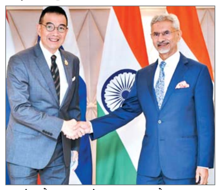
जयशंकर ने कहा हम संयुक्त राष्ट्र गए। जो आक्रमण था उसे विवाद बना दिया गया। हमलावर और पीड़ित को एक ही श्रेणी में रखा गया। विदेश मंत्री ने कहा कि वैश्विक नियम-का बंधन समान रूप से लागू किये जाने चाहिए। उन्होंने कहा हमें एक मजबूत संयुक्त राष्ट्र की जरूरत है।

एजेंसी नयी दिल्ली। विदेश मंत्री एस जयशंकर ने मंगलवार को कहा कि द्वितीय विश्व युद्ध के बाद से किसी क्षेत्र पर सबसे लंबे समय तक अवैध कब्जा कश्मीर पर देखने को मिला है। उन्होंने स्पष्ट रूप से पाकिस्तान के कब्जे वाले कश्मीर (पीओके) के संदर्भ में यह बात कही। जयशंकर ने संप्रभुता और क्षेत्रीय अखंडता से संबंधित मुद्दों पर वैश्विक नियमों को चुनौती देने से लगे हुए किये जाने का भी उल्लेख किया। विदेश मंत्री ने रायसीना डायलॉग के एक सत्र में एक मजबूत और निष्पक्ष संयुक्त राष्ट्र की भी हिमायत की। साथ ही, उन्होंने कुछ मुद्दों से निपटने में हुए ऐतिहासिक अन्याय को लेकर चिंता जताई। विदेश मंत्री ने कश्मीर पर पाकिस्तान के अवैध कब्जे का हवाला देते हुए कहा कि हमलावर और पीड़ित को एक ही श्रेणी में रखा गया है। उन्होंने कहा, द्वितीय विश्व युद्ध के बाद, किसी देश द्वारा किसी क्षेत्र पर सबसे लंबे समय तक अवैध कब्जा भारत के कश्मीर से संबंधित है।