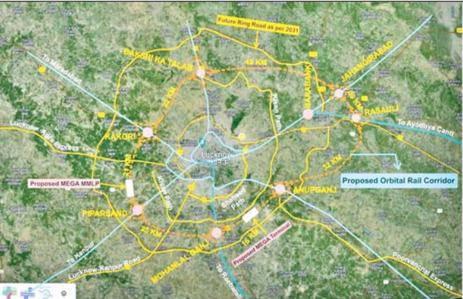
● रेलपरिचालन को मिलेगी नयी दिशा, संचालन प्रक्रिया होगी सुदृढ़