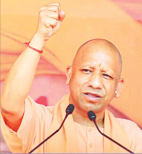
मुख्यमंत्री योगी आदित्यनाथ

लखनऊ। मुख्यमंत्री योगी आदित्यनाथ ने प्रधानमंत्री नरेन्द्र मोदी के नेतृत्व में आयोजित प्रयागराज महाकुंभ की भव्य सफलता पर उनका आभार जताया और कहा कि महाकुंभ ने दुनिया को वसुधैव कुटुम्बकम का आत्मीय संदेश दिया है। योगी आदित्यनाथ ने मंगलवार को एक्स पर पोस्ट किया, आदरणीय प्रधानमंत्री नरेन्द्र मोदी जी के यशस्वी मार्गदर्शन में एकता के महायज्ञ महाकुंभ-2025, प्रयागराज के स्वच्छ, सुरक्षित, व्यवस्थित और ऐतिहासिक आयोजन ने एक भारत-श्रेष्ठ भारत-सर्वसमावेशी भारत के साथ ही वसुधैव कुटुम्बकम का आत्मीय संदेश पूरी दुनिया को दिया है। योगी ने कहा आस्था आजीविका का माध्यम हो सकती है। संस्कृति राष्ट्र की समृद्धि का कारक बन सकती है। महाकुंभ-2025, प्रयागराज ने यह उदाहरण भी प्रस्तुत किया है। महाकुंभ-2025, प्रयागराज के आयोजन से जुड़े सभी लोगों को मेरा अभिनंदन और आदरणीय प्रधानमंत्री जी का हार्दिक आभार है। प्रधानमंत्री मोदी ने संसद के चालू बजट सत्र के दूसरे चरण की कार्यवाही के दौरान मंगलवार को लोकसभा में कहा कि पूरे विश्व ने महाकुंभ के रूप में भारत के विराट स्वरूप के दर्शन किए तथा यह जनता-जनार्दन का और जनता के संकल्पों के लिए और जनता की श्रद्धा से प्रेरित महाकुंभ था। मोदी ने कहा महाकुंभ में हमने राष्ट्रीय चेतना के जागरण