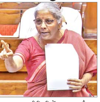
व्यवस्था की स्थिति में सुधार हुआ है। सीतारमण ने पिछले सप्ताह सोमवार को 2025-26 के लिए मणिपुर का बजट पेश किया था, जिसमें 35,103.90 करोड़ रुपये के व्यय का अनुमान किया गया है, जो चालू वित्त

नयी दिल्ली। वित्त मंत्री निर्मला सीतारमण ने मंगलवार को राज्यसभा में कहा कि केंद्र सरकार मणिपुर में सामान्य स्थिति और समृद्धि लाने के लिए प्रतिबद्ध है। इसके साथ ही उन्होंने राज्य के आर्थिक विकास के लिए सभी तरह का समर्थन देने का आश्वासन दिया। वित्त मंत्री ने उच्च सदन में यह बात मणिपुर के बजट और उससे संबंधित अनुदान की अनुपूरक मांगों पर हुई चर्चा का जवाब देते हुए कही। उन्होंने इस बात पर जोर दिया कि कुछ छिटपुट घटनाओं को छोड़कर पूर्वांचल राज्य में कुल मिलाकर कानून