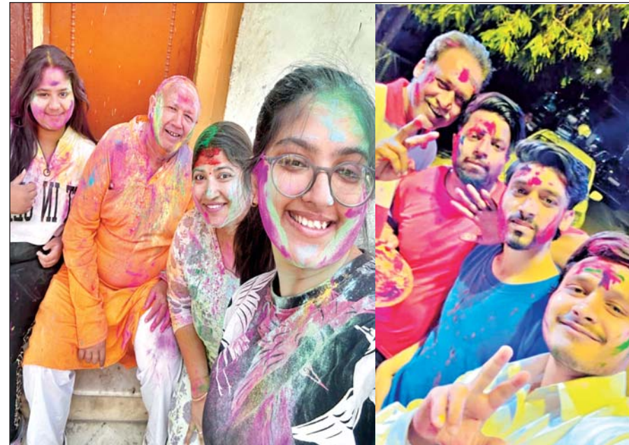
अबीर-गुलाल लगा लोगों ने खेली होली, एक-दूसरे से गले मिल कर दी बधाई

आजमगढ़। शहर से लेकर ग्रामीण अंचलों में पात्र लाभार्थियों का राशनकार्ड आपूर्ति कार्यालय से निरस्त कर दिया जा रहा है। इससे पात्र लोगों की परेशानी बढ़ गई है। वहीं, विभाग का कहना है उनके स्तर पर किसी लाभार्थी का नाम नहीं काटा गया है। जो व्यक्ति पात्र है वह नोटरी बयानहल्फी के साथ आनलाइन आवेदन करें। जांच के बाद उनका राशनकार्ड बना दिया जाएगा। जिले में सात लाख से अधिक अन्त्येदय और पात्र गृहस्थी के राशन कार्ड उपभोक्ता हैं। इन्हें हर माह शासन की तरफ से यूनिट के हिसाब राशनकार्ड उपभोक्ताओं को खाद्यान्न उपलब्ध कराया जा रहा है। इधर कई माह से राशन कार्ड से नाम काटने और नाम जोड़ने का खेल आपूर्ति विभाग द्वारा किया जा रहा है। राशन कार्ड से नाम काटने में ज्यादातर खेल कोटेदारों का बताया जा रहा। इतना ही नहीं, गरीब परिवारों के राशन कार्डों को निरस्त कर दिया जाता है। इसका कारण विभागीय अधिकारी बताने को तैयार नहीं है।