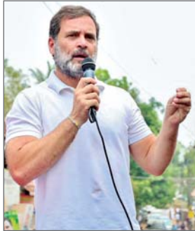
कांशीराम जी की जयंती पर उन्हें सादर नमन। दलितों, वंचितों और शोषितों के अधिकारों के लिए उनका संघर्ष, सामाजिक न्याय की लड़ाई में हमारा हर कदम पर मार्गदर्शन करता रहेगा। खरेगे ने कहा कि कांशीराम ने समानता

नयी दिल्ली। लोकसभा में नेता प्रतिपक्ष राहुल गांधी ने बहुजन समाज पार्टी के संस्थापक कांशीराम की जयंती के अवसर पर शनिवार को कहा कि दलितों, वंचितों और शोषितों के अधिकारों के लिए उनका संघर्ष सामाजिक न्याय की लड़ाई में कांग्रेस का हर कदम पर मार्गदर्शन करता रहेगा। राहुल गांधी कांग्रेस अध्यक्ष मल्लिकार्जुन खरेगे, पार्टी महासचिव प्रियंका गांधी वाद्रा और कांग्रेस के कई अन्य नेताओं ने कांशीराम की जयंती पर उन्हें श्रद्धांजलि दी। कांग्रेस के पूर्व अध्यक्ष राहुल गांधी ने एक्स पर पोस्ट किया, महान समाज सुधारक, मान्यवर