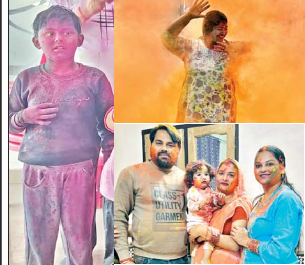
बच्चों संग बड़ों में भी दिखा होली खेलने का उत्साह

आजमगढ़। शहर से लेकर ग्रामीण अंचलों में पात्र लाभार्थियों का राशनकार्ड आपूर्ति कार्यालय से निरस्त कर दिया जा रहा है। इससे पात्र लोगों की परेशानी बढ़ गई है। वहीं, विभाग का कहना है उनके स्तर पर किसी लाभार्थी का नाम नहीं काटा गया है। जो व्यक्ति पात्र है वह नोटरी बयानहल्फी के साथ आनलाइन आवेदन करें। जांच के बाद उनका राशनकार्ड बना दिया जाएगा। जिले में सात लाख से अधिक अन्त्येदय और पात्र गृहस्थी के राशन कार्ड उपभोक्ता हैं। इन्हें हर माह शासन की तरफ से यूनिट के हिसाब राशनकार्ड उपभोक्ताओं को खाद्यान्न उपलब्ध कराया जा रहा है। इधर कई माह से राशन कार्ड से नाम काटने और नाम जोड़ने का खेल आपूर्ति विभाग द्वारा किया जा रहा है। राशन कार्ड से नाम काटने में ज्यादातर खेल कोटेदारों का बताया जा रहा। इतना ही नहीं, गरीब परिवारों के राशन कार्डों को निरस्त कर दिया जाता है। इसका कारण विभागीय अधिकारी बताने को तैयार नहीं है।