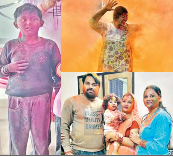
बच्चों संग बड़ों में भी दिखा होली खेलने का उत्साह

आजमगढ़। शहर से लेकर ग्रामीण अंचलों में पात्र लाभार्थियों का राशनकार्ड आपूर्ति कार्यालय से निरस्त कर दिया जा रहा है। इससे पात्र लोगों की परेशानी बढ़ गई है। वहीं, विभाग का कहना है उनके स्तर पर किसी लाभार्थी का नाम नहीं काटा गया है। जो व्यक्ति पात्र है वह नोटरी बयानहल्फी के साथ आनलाइन आवेदन करें। जांच के बाद उनका राशनकार्ड बना दिया जाएगा। जिले में सात लाख से अधिक अन्त्येदय और पात्र गृहस्थी के राशन कार्ड उपभोक्ता हैं। इन्हें हर माह शासन की तरफ से यूनिट के हिसाब राशनकार्ड उपभोक्ताओं को खाद्यान्न उपलब्ध कराया जा रहा है। इधर कई माह से राशन कार्ड से नाम काटने और नाम जोड़ने का खेल आपूर्ति विभाग द्वारा किया जा रहा है। राशन कार्ड से नाम काटने में ज्यादातर खेल कोटेदारों का बताया जा रहा। इतना ही नहीं, गरीब परिवारों के राशन कार्डों को निरस्त कर दिया जाता है। इसका कारण विभागीय अधिकारी बताने को तैयार नहीं है।