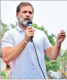
कांशीराम जी की जयंती पर उन्हें सादर नमन। दलितों, वंचितों और शोषितों के अधिकारों के लिए उनका संघर्ष, सामाजिक न्याय की लड़ाई में हमारा हर कदम पर मार्गदर्शन करता रहेगा। खरेगे ने कहा कि कांशीराम ने समानता

नयी दिल्ली। लोकसभा में नेता प्रतिपक्ष राहुल गांधी ने बहुजन समाज पार्टी के संस्थापक कांशीराम की जयंती के अवसर पर शनिवार को कहा कि दलितों, वंचितों और शोषितों के अधिकारों के लिए उनका संघर्ष सामाजिक न्याय की लड़ाई में कांग्रेस का हर कदम पर मार्गदर्शन करता रहेगा। राहुल गांधी कांग्रेस अध्यक्ष मल्लिकार्जुन खरेगे, पार्टी महासचिव प्रियंका गांधी वाद्रा और कांग्रेस के कई अन्य नेताओं ने कांशीराम की जयंती पर उन्हें श्रद्धांजलि दी। कांग्रेस के पूर्व अध्यक्ष राहुल गांधी ने एक्स पर पोस्ट किया, महान समाज सुधारक, मान्यवर