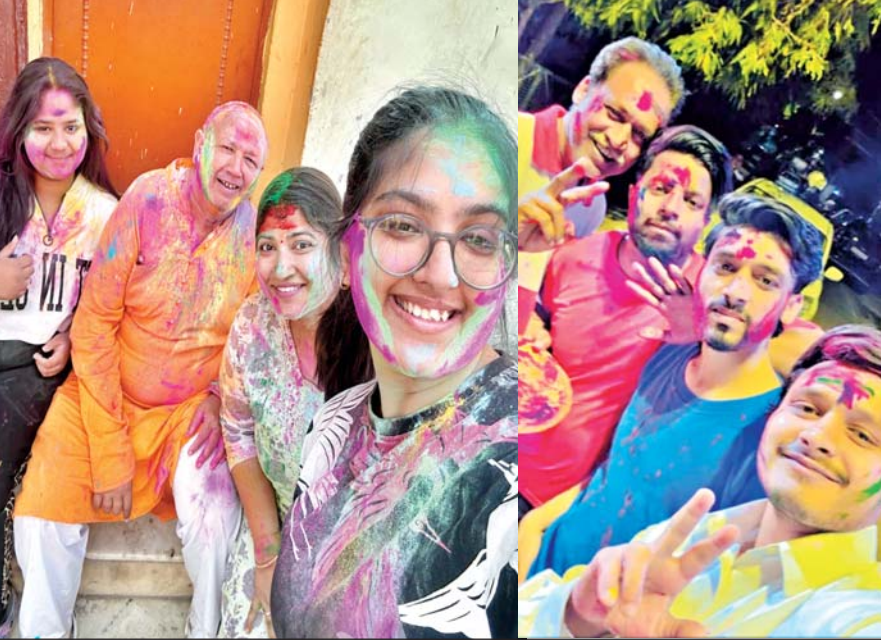
अबीर-गुलाल लगा लोगों ने खेली होली, एक-दूसरे से गले मिल कर दी बधाई

आजमगढ़। शहर से लेकर ग्रामीण अंचलों में पात्र लाभार्थियों का राशनकार्ड आपूर्ति कार्यालय से निरस्त कर दिया जा रहा है। इससे पात्र लोगों की परेशानी बढ़ गई है। वहीं, विभाग का कहना है उनके स्तर पर किसी लाभार्थी का नाम नहीं काटा गया है। जो व्यक्ति पात्र है वह नोटरी बयानहल्फी के साथ आनलाइन आवेदन करें। जांच के बाद उनका राशनकार्ड बना दिया जाएगा। जिले में सात लाख से अधिक अन्त्येदय और पात्र गृहस्थी के राशन कार्ड उपभोक्ता हैं। इन्हें हर माह शासन की तरफ से यूनिट के हिसाब राशनकार्ड उपभोक्ताओं को खाद्यान्न उपलब्ध कराया जा रहा है। इधर कई माह से राशन कार्ड से नाम काटने और नाम जोड़ने का खेल आपूर्ति विभाग द्वारा किया जा रहा है। राशन कार्ड से नाम काटने में ज्यादातर खेल कोटेदारों का बताया जा रहा। इतना ही नहीं, गरीब परिवारों के राशन कार्डों को निरस्त कर दिया जाता है। इसका कारण विभागीय अधिकारी बताने को तैयार नहीं है।