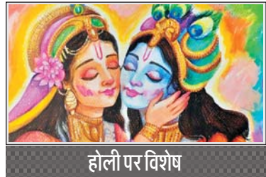
होली पर विशेष

उत्तर भारत में उमगते हैं रसिया और फागु ब्रज, अवधी, भोजपुरी और मैथिली भाषाओं और बोलियों को तो मानो पूरे साल फागुन का ही इंतजार रहता है। फागुन की प्रतिपदा से ही इन इलाकों में फगु और रसिया गीतों का श्री गणेश हो जाता है जो होली के बाद चैत्र माह की पापमोचनी एकादशी तक चलते हैं। इस दिन जाकर ढोल मजोर रखे जाते हैं। देश के ब्रज क्षेत्र (उत्तर प्रदेश और राजस्थान के कुछ हिस्से) में होली पर विशेष रूप से राधा-कृष्ण के प्रेम और उनके रंग-रास को चित्रित करने वाले ये फगु और रसिया गीत प्रसिद्ध हैं। 'खेलत हरी संग सकल ग्वालन, रंग गुलाल उड़ाये र', 'उड़े गुलाल लले लालरं, रसिया खेले होली', जबकि भोजपुरी में 'फगुआ में हरजाई