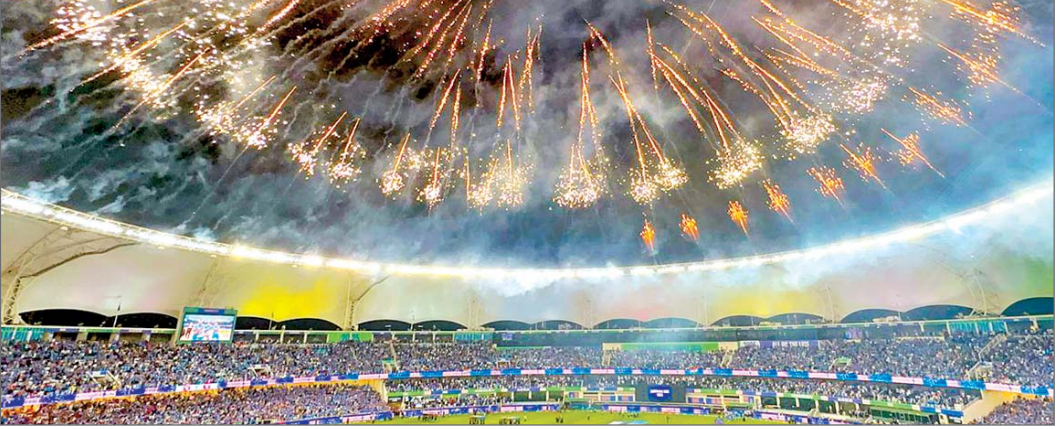
दुबई में भारत की जीत के पूरे स्टेडियम में जमकर हुई आतिशबाजी हमारे देश का सबसे बेहतरीन खेल रहा है और इससे... शेष पृष्ठ 14 पर