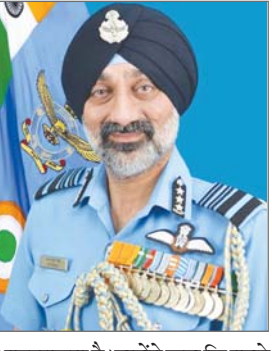
आवश्यकता है। उन्होंने कहा कि पहले का यह विचार अब बदल गया है कि युद्ध छोटे और त्वरित होंगे। उन्होंने कहा और हमें उद्योग के समर्थन की आवश्यकता... शेष पृष्ठ 14 पर

एजेंसी नयी दिल्ली। वायुसेना प्रमुख एयर चीफ मार्शल एपी सिंह ने शनिवार को कहा कि भारतीय परिस्थितिकी तंत्र को उस स्तर पर पहुंचाने की जरूरत है जहां नयी प्रौद्योगिकी का विकास भारत में हो और अन्य देश इसका अनुसरण करें। वायु सेना प्रमुख ने कहा कि मौजूदा संघर्षों से एक सबक यह मिलता है कि लंबे समय तक चलने वाले युद्ध के लिए तैयार रहना चाहिए। वायुसेना प्रमुख ने कहा इसलिए अपनी अन्य क्षमताओं के साथ हमें लंबे समय तक चलने वाले युद्ध में टिके रहने की क्षमता का निर्माण करने की