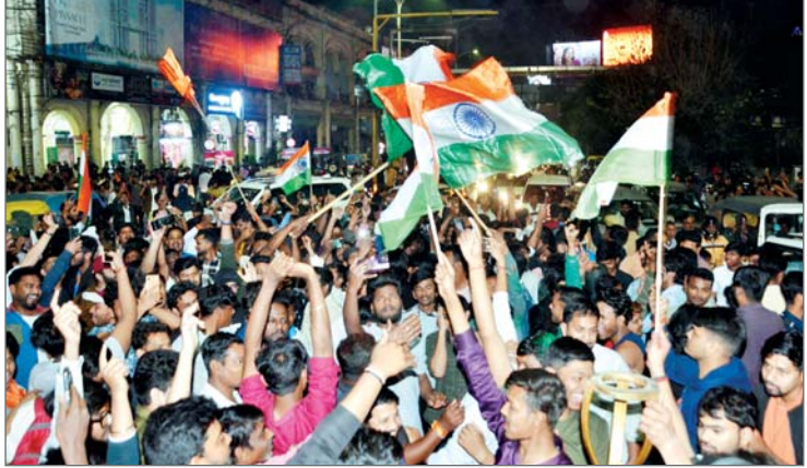
लखनऊ के हजरतगंज चौराहे पर भारत की जीत के बाद जश्न मनाते लोग