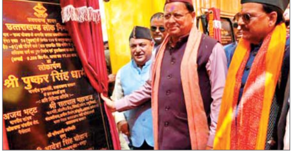
उक्त उद्गार मुख्यमंत्री पुष्कर सिंह धामी ने रविवार उत्तराखंड के काशीपुर में आयोजित अभिनंदन समारोह को संबोधित करते... शेष पृष्ठ 14 पर

मुख्यमंत्री धामी ने काशीपुर में निकाला भव्य रोड-शो प्रमुख संवाददाता देहरादून (उत्तराखंड)। केदारखंड की भांति ही मानसखंड में स्थित कुमाऊं के पौराणिक मंदिरों के भी पुनरुत्थान एवं सौंदर्यीकरण के लिए संकल्पित होकर कार्य किया जा रहा है। इसी क्रम में जहां एक ओर काशीपुर के चौती मंदिर को मानसखंड कारिडोर का हिस्सा बनाया है, वहीं यहां के विभिन्न प्राचीन मंदिरों और शिवालयों के पुनर्निर्माण और सौंदर्यीकरण के लिए भी निरंतर प्रयास कर रहे हैं।