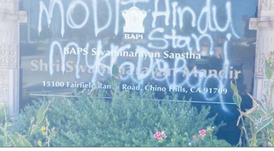
भारत ने कैलिफोर्निया के चीनो हिल्स में एक हिंदू मंदिर को अपवित्र करने की घटना की रविवार को कड़ी निंदा की और इसमें शामिल लोगों के खिलाफ

एजेंसी न्यूयॉर्क। कैलिफोर्निया में एक प्रमुख हिंदू मंदिर की दीवारों पर अज्ञात व्यक्तियों ने भारत विरोधी नारे लिखकर इसे विरूपित कर दिया। अमेरिका में हिंदू समुदाय के पवित्र स्थलों को निशाना बनाने की यह एक और घटना है। बोचासनवासी अक्षर पुरुषोत्तम स्वामीनारायण संस्था (बीपीएस) ने कहा कि सैन बर्नार्डिनो काउंटी के चीनो हिल्स शहर में स्थित उसके श्री स्वामीनारायण मंदिर को अपवित्र किया गया। चीनो हिल्स लॉस एंजिल्स काउंटी की सीमा पर है। वहीं दूसरी ओर