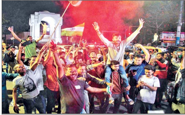
वरिष्ठ संवाददाता (VOI)

आधी रात में खुशियों से सराबोर हुआ लखनऊ, कहीं फूटे पटाखे तो कहीं मनी दिवाली, युवाओं ने लगाये भारत माता के जयकारे