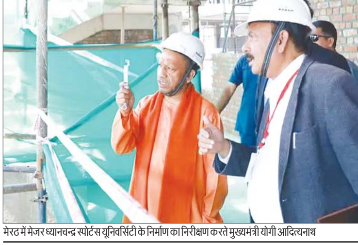
मेरठ में मेजर ध्यानचंद स्पोर्ट्स यूनिवर्सिटी के निर्माण का निरीक्षण करते मुख्यमंत्री योगी आदित्यनाथ

मुख्यमंत्री ने मेरठ और सहारनपुर मंडल के 1070 युवाओं को बांटा 48 करोड़ का ऋण जिला संवाददाता मेरठ। मुख्यमंत्री योगी आदित्यनाथ ने रविवार को कहा कि अगर सरकार युवाओं के साथ खड़ी हो, तो युवा प्रत्येक चुनौतियों का सामना करते हुए अपना रास्ता खुद बना सकते हैं। उन्होंने कहा कि युवाओं की प्रगति में आने वाली हर बाधा को दूर करने के लिए सरकार संकल्पित है। योगी ने युवा उद्यमी विकास अभियान के अंतर्गत मेरठ एवं सहारनपुर मंडल के 1,070 युवाओं को 48 करोड़ रुपये के ऋण वितरण के बाद आयोजित समारोह को संबोधित करते हुए यह बात कही। मुख्यमंत्री ने कहा कि युवाओं के लिए चुनौती, चुनौती नहीं है। अगर सरकार उनके साथ खड़ी हो तो वे चुनौतियों का सामना करते हुए अपना रास्ता खुद बना सकते हैं। उत्तर प्रदेश के युवाओं ने खुद को आगे बढ़ाने का काम किया है। बहुत सारे ऐसे युवा हैं, जो नौकरी न कर अपना खुद का कारोबार शुरू करना चाहते हैं और वह अपने मां-बाप पर आश्रित न होकर अपनी मेहनत से खुद की पहचान बनाना चाहते हैं। अपनी मेहनत पर विश्वास करने वाले ऐसे युवाओं को प्रोत्साहित करने के लिए हम लोगों ने व्यवस्था दी है कि पहले चरण में पांच लाख रुपये तक ब्याज मुक्त कर्ज हम उपलब्ध करावेंगे। योगी ने कहा कि अनुसूचित जाति, अनुसूचित जनजाति और महिलाओं के लिए इसमें विशेष प्रावधान किया गया है और इस योजना का लाभ अधिक से अधिक लोगों को मिल सकेगा। उन्होंने कहा कि मुख्यमंत्री युवा उद्यमी योजना के अंतर्गत अब तक ऋण लेकर जिन्होंने अपना कारोबार शुरू किया है, उन युवाओं ने सफलता की कहानी लिखी है और यह साबित किया है कि युवा के लिए चुनौती कोई चुनौती नहीं... शेष पृष्ठ 14 पर