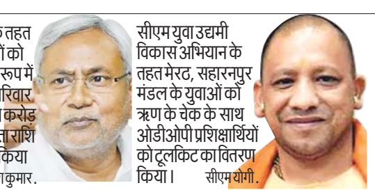
पीएम आवास के तहत 3 लाख परिवारों को प्रथम किशत के रूप में 40 हजार प्रति परिवार की दर से 12 सी करोड रुपये की सहायता राशि का हस्तांतरण किया गया। नीतीश कुमार.

बहुत खस्ता हो गई थीं। हालांकि अब यह दिक्कत पूरी तरह दूर हो चुकी है और कंपनियों तथा बैंकों की बैलेंस शीट अच्छी स्थिति में है। किंतु निजी क्षेत्र अब भी ज्यादा निवेश करना नहीं चाहता। इस वित्त वर्ष में स्थिर मूल्यों पर देश का सकल स्थिर पूंजी निर्माण जीडीपी के 33.4 फीसदी के बराबर रहने का अनुमान है। लगातार ऊंची वृद्धि हासिल करने के लिए इसे बढ़ावा देना होगा। प्रधानमंत्री नरेंद्र मोदी ने इसी हफ्ते निजी कंपनियों से कहा कि उन्हें मूक दर्शक नहीं बने रहना है। उन्होंने कंपनियों से मोके पहचानने और चुनौतियां स्वीकारने के लिए कहा। प्राइवेट सेक्टर के निवेश को लेकर केंद्रीय वित्त मंत्री निर्मला सीतारमण ने कहा कि निजी क्षेत्र को बताना चाहिए कि उन्हें निवेश बढ़ाने से कौन सी बात नरोक रही है। सरकार बुनियादी ढांचा सुधारने के लिए भारी खर्च के साथ ही निवेश बढ़ाने के प्रयास भी कर रही है। उदाहरण के लिए 2014 के बाद से अब तक उसने 42,000 से अधिक नियम-कार्यदे हटा दिए हैं। 13,700 से अधिक कानूनी प्रावधानों को फौजदारी से बाहर कर दिया गया है और आगे भी ऐसे प्रयास जारी रहेंगे। विनियमन आयोग पर चर्चा हो रही है। चूंकि वास्तव में निवेश राश्यों के भीतर होता है, इसलिए आयोग को अपने काम के दायरे को भी हिसाब से राश्यों के साथ मिलकर काम करना होगा। 2000 के दशक को तेज वृद्धि असल में