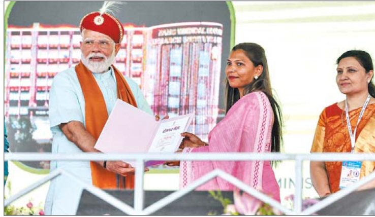
26 के आम बजट में प्रस्तावित 12 लाख रुपये तक की आयकर छूट से वेतनभोगी वर्ग, छोटे व्यवसायी और श्रमिकों को लाभ होगा। उन्होंने गुजरात में सूरत खाद्य सुरक्षा संगठित अभियान का शुभारंभ करने के बाद एक सभा को संबोधित करते हुए कहा, हमने अब तक मुद्रा योजना के तहत गरीब नागरिकों को 32 लाख करोड़ रुपये का ऋण दिया है। जो लोग हमें गाली देते हैं, जिनके पास शून्य सीटें हैं, वे 32 लाख करोड़ रुपये में शून्य नहीं गिन पाएंगे। केंद्र सरकार ने सूक्ष्म और

एजेंसी सूरत। प्रधानमंत्री नरेन्द्र मोदी ने शुक्रवार को कहा कि मुद्रा योजना के तहत केंद्र ने 32 लाख करोड़ रुपये के ऋण दिए हैं। उन्होंने कांग्रेस पार्टी पर कटाक्ष करते हुए कहा कि जिनके पास शून्य सीटें हैं, वे इस राशि के शून्य नहीं गिन सकते हैं। गौरतलब है कि कांग्रेस पांच फरवरी को दिल्ली में हुए विधानसभा चुनावों में अपना खाता खोलने में विफल रही, जहां भाजपा को जीत मिली। यह लगातार तीसरी बार है, जब दिल्ली विधानसभा चुनावों में कांग्रेस को एक भी सीट नहीं मिली। मोदी ने कहा कि एक समय था जब गरीबों को अपने छोटे व्यवसाय के लिए कर्ज लेने के लिए बैंक में प्रवेश करने की भी अनुमति नहीं थी। उन्होंने कहा, बैंक ऋण के बदले गारंटी मांगते थे। गरीब व्यक्ति गारंटी कहाँ से जुटाएगा? इसलिए गरीब मां के बेटे मोदी ने हर गरीब का गारंटर बनने का फैसला किया। प्रधानमंत्री ने कहा कि 2025-