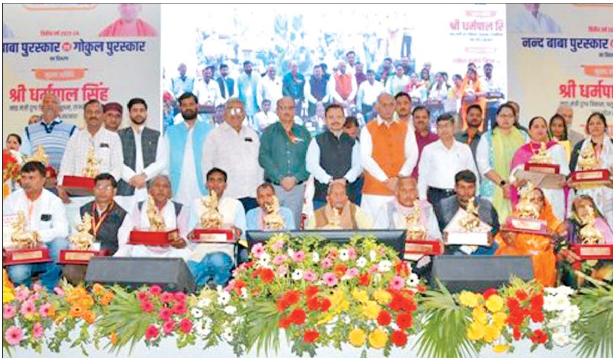
गोकुल पुरस्कार के अंतर्गत लखनऊ दुग्ध संघ के लखीमपुर-खीरी जनपद निवासी एवं वेलवा मोती

इस अवसर पर सिंह ने कहा कि मुख्यमंत्री की प्रेरणा से भारतीय गोवंशीय देशी गाय के दुग्ध उत्पादन को बढ़ावा दिया जा रहा है और गोवंश का संरक्षण एवं संवर्धन राज्य सरकार की प्राथमिकता है। सिंह ने दुग्ध उत्पादकों से दुग्ध समितियों के माध्यम से व्यवसाय करने का आह्वान किया और कहा कि समितियों के माध्यम से दुग्ध व्यवसाय करके और डेयरी व्यवसाय अपनाकर किसान एवं पशुपालक अपनी आय में बढ़ोत्तरी कर सकते हैं। कार्यक्रम में