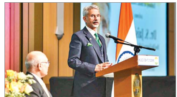
329 लोगों की मौत हो गई थी। ये घटना आयरलैंड के तट पर हुई थी। जयशंकर ने कहा संघर्षों के बारे में एक विशेष बात, क्योंकि यह आज भारत के लिए एक बहुत ही प्रमुख मुद्दा है। हमारा हमेशा से यह मानना रहा है कि इस युग में मतभेदों को युद्ध के मैदान में नहीं सुलझाया जा सकता और न ही सुलझाया जाना चाहिए। वह गुरुवार को भारत का विश्व के प्रति दृष्टिकोण विषय पर अग्रणी आयरिश शोध संस्थान में छात्रों, शिक्षाविदों और प्रवासी समुदाय के सदस्यों को संबोधित कर रहे थे। जयशंकर ने कहा, संघर्ष के बारे में बात करते हुए, आतंकवाद का ... शेष पृष्ठ 14 पर

एजेंसी लंदन। विदेश मंत्री एस. जयशंकर ने आयरलैंड में यूनिवर्सिटी कॉलेज डबलिन में अपने संबोधन में कहा कि संघर्ष आज एक प्रमुख मुद्दा है और भारत का मानना है कि मतभेदों को बातचीत एवं कूटनीति के जरिए सुलझाया जाना चाहिए। जयशंकर ने विदेश नीति के विभिन्न मुद्दों पर अपने विचार रखे और आतंकवाद के खिलाफ भारत-आयरलैंड के साझा दृष्टिकोण को रेखांकित करने के लिए जून 1985 में एयर-इंडिया विमान पर हुए आतंकवादी हमले का संदर्भ दिया। विदेश मंत्री ने कहा कि पश्चिमी कॉर्क में आयरिश गांव अहाकिस्ता, कनिफ बम विस्फोट आपदा का गवाह है, जिसमें