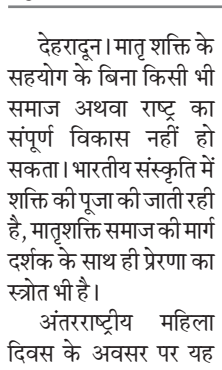
देहरादून। मातृ शक्ति के सहयोग के बिना किसी भी समाज अथवा राष्ट्र का संपूर्ण विकास नहीं हो सकता। भारतीय संस्कृति में शक्ति की पूजा की जाती रही है, मातृशक्ति समाज की मार्ग दर्शक के साथ ही प्रेरणा का स्रोत भी है। अंतरराष्ट्रीय महिला दिवस के अवसर पर यह विचार मुख्यमंत्री पुष्कर सिंह धामी ने प्रदेश की महिलाओं को शुभकामनाएं देते हुए व्यक्त किए। उन्होंने कहा कि महिलाओं के बेहतर भविष्य के लिए उनका वर्तमान संवारने के लिए राज्य सरकार द्वारा कारगर प्रयास किये जा रहे हैं। उन्होंने कहा कि प्रधानमंत्री नरेन्द्र मोदी के मार्गदर्शन में केंद्र सरकार

धामी ने अंतरराष्ट्रीय महिला दिवस पर महिलाओं को दी शुभकामनाएं