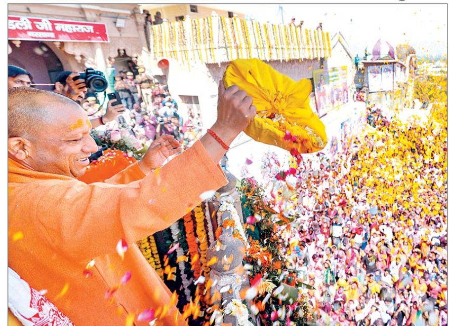
एकता का प्रतीक के रूप में मौजूद है। प्रधानमंत्री नरेन्द्र मोदी के नेतृत्व में विरासत और विकास की नई परंपरा जो जितना सनातन धर्म के खिलाफ बोलता था, अफवाह फैलाता था और तर्कहीन बातें करता था, उन्हें सनातन धर्मावलंबियों ने महाकुंभ के जरिए करारा जवाब दिया है। महाकुंभ सनातन धर्म का दुर्लभतम क्षण बन गया है। योगी ने होली को एकता का सूत्र बताते हुए कहा कि होली आपसी सद्भाव और ... शेष पृष्ठ 14 पर