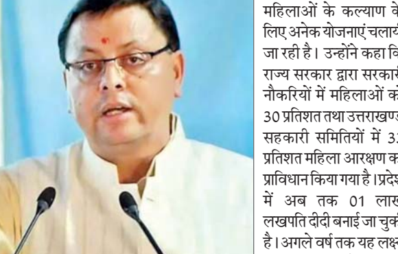
तथा राज्य सरकार द्वारा महिलाओं के कल्याण के लिए अनेक योजनाएं चलायी जा रही है। उन्होंने कहा कि राज्य सरकार द्वारा सरकारी नौकरियों में महिलाओं को 30 प्रतिशत तथा उत्तराखण्ड सहकारी समितियों में 33 प्रतिशत महिला आरक्षण का प्राविधान किया गया है। प्रदेश में अब तक 01 लाख लक्षपति दीदी बनाई जा चुकी है। अगले वर्ष तक यह लक्ष्य 2.50 लाख करने का रखा गया है। मुख्यमंत्री ने कहा कि हमने समान नागरिक संहिता लागू कर राज्य की जनता से किया वादा पूरा किया है। यह महिलाओं के सम्मान से जुड़ा कानून भी है। कौशल विकास के माध्यम से महिलाओं की आर्थिकी को मजबूती प्रदान की जा रही है।