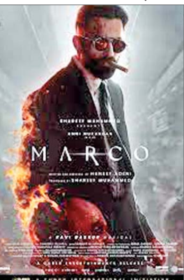
अधिकार 'यू' या 'यूए' प्रमाणपत्र वाली फिल्मों को दिए जाते हैं। उन्होंने कहा कि फिल्मों को उनकी सामग्री के आधार पर वर्गीकृत और प्रमाणपत्र दिया