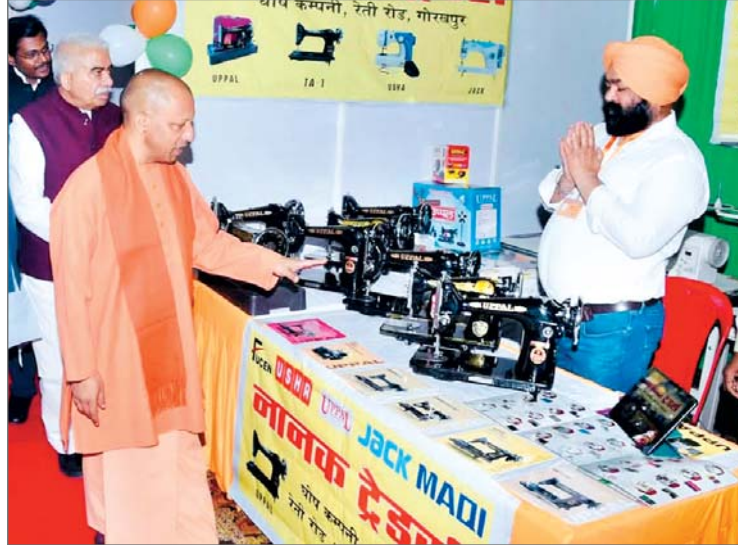
प्रशिक्षार्थियों को टूलकिट वितरित की। उन्होंने कहा कि मुख्यमंत्री युवा उद्यमी योजना के जरिये सरकार ने व्यवस्था है कि एक वर्ष में एक लाख नए उद्यमी, पांच लाख रुपये का ब्याज मुक्त ऋण उपलब्ध कराएंगे। योगी ने कहा कि अनुसूचित जाति-जनजाति, महिला व अति पिछड़ी जाति के

गोरखपुर। मुख्यमंत्री योगी आदित्यनाथ ने भारत के विकास में युवाओं की भूमिका पर जोर देते हुए बृहस्पतिवार को कहा कि राज्य में 10 लाख युवा उद्यमी तैयार करने के प्रयास जारी है। मुख्यमंत्री ने कहा भारत नई दिशा में बढ़ रहा है। पिछले 10 वर्षों में प्रधानमंत्री मोदी के नेतृत्व में नए भारत का दर्शन किया जा रहा है। नया भारत ऊर्जा व सामर्थ्य से दुनिया को अपना अनुगामी बनाता है। इस ऊर्जा के प्रतीक है युवा, जिन्होंने प्रधानमंत्री मोदी के नेतृत्व में भारत को दुनिया की पांचवीं बड़ी अर्थव्यवस्था बनाया। उन्होंने कहा कि अगले दो वर्षों में भारत दुनिया की तीसरी बड़ी अर्थव्यवस्था बनेगा और अर्थव्यवस्था को तेजी से आगे बढ़ाने में सबसे बड़ी भूमिका नए युवा उद्यमियों की होगी। मुख्यमंत्री ने बाबा गंभीरनाथ प्रेक्षागृह में मुख्यमंत्री युवा उद्यमी विकास अभियान (सीएम युवा) के तहत गोरखपुर व बस्ती मंडल के 2500 लाभार्थियों को 100 करोड़ रुपये का ऋण तथा ओडीओपी के अंतर्गत दोनों मंडलों के 2100