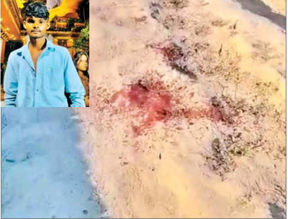
घटना स्थल का फोटो, इनसेट में मृतक की फाइल फोटो