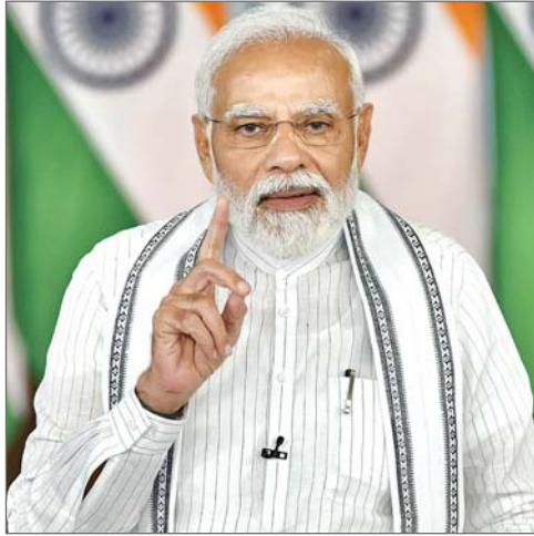
कृषि पद्धतियों में सुधार के लिए निर्यात बाजारों पर ध्यान केंद्रित करने और सहकारी समितियों के माध्यम से मुदा परीक्षण मॉडल विकसित करने का भी सुझाव दिया। प्रधानमंत्री ने वित्तीय लेनदेन की सुविधा के लिए यूपीआई को रूपे केसीसी कार्ड के साथ एकीकृत