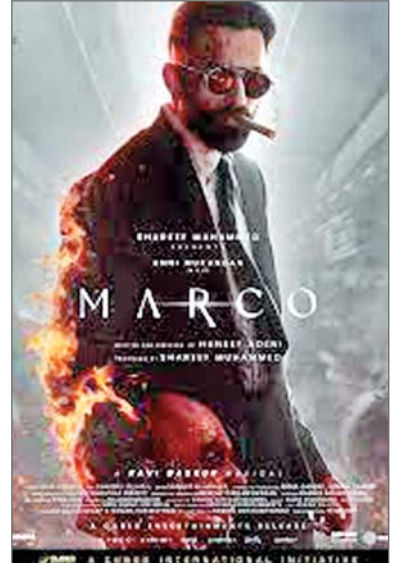
अधिकार 'यू' या 'यूए' प्रमाणपत्र वाली फिल्मों को दिए जाते हैं। उन्होंने कहा कि फिल्मों को उनकी सामग्री के आधार पर वर्गीकृत और प्रमाणपत्र दिया