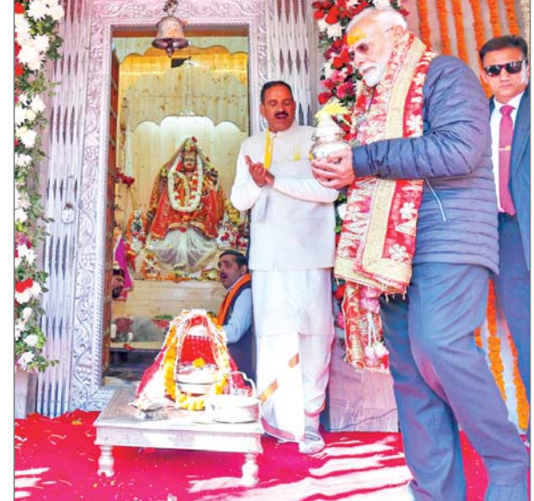
बढ़ावा देने के लिए राज्य सरकार के टूरिज्म कोष की प्रशंसा करते हुए प्रधानमंत्री ने कहा कि साल भर स्थानीय युवाओं के लिए रोजगार के अवसर पैदा करने के उद्देश्य से पर्यटन के 360-डिग्री टूरिज्म को ज़रूरत है। प्रधानमंत्री ने कहा कि अभी पहाड़ों में मार्च, अप्रैल और जून में बड़ी संख्या में पर्यटक आते हैं लेकिन उसके बाद इनकी संख्या कम हो जाती है। उन्होंने कहा, सर्दियों में होमटेर और होटल खाली पड़े रहते हैं। यह असंतुलन

एजेंसी हरसिल (उत्तराखंड)। प्रधानमंत्री नरेन्द्र मोदी ने उत्तराखंड में बारहमासी पर्यटन की पुर्नजोर वकालत करते हुए बृहस्पतिवार को कहा कि इस खूबसूरत पहाड़ी राज्य में कोई ऑफ सीजन नहीं होना चाहिए और हर सीजन ऑन सीजन रहे जिससे राज्य की अर्थव्यवस्था को बड़े पैमाने पर मजबूती मिलेगी। मुखबा में देवी गंगा के शीतकालीन प्रवास स्थल में पूजा-अर्चना करने के बाद हरसिल में एक जनसभा को संबोधित करते हुए प्रधानमंत्री ने कहा कि अगर पर्यटक सर्दियों में प्रदेश में आएंगे तो उन्हें उत्तराखंड की वास्तविक आभा देखने को मिलेगी। मोदी ने राज्य में शीतकालीन पर्यटन के लिए गढ़वाली भाषा में एक नया शब्द घाम तापो पर्यटन (धूप सेंको पर्यटन) गढ़ते हुए कहा सर्दियों में जब देश के बड़े हिस्से में कोहरा छाया होता है, तो पहाड़ों पर धूप का आनंद होता है। बारहमासी या 365 दिनों के पर्यटन को