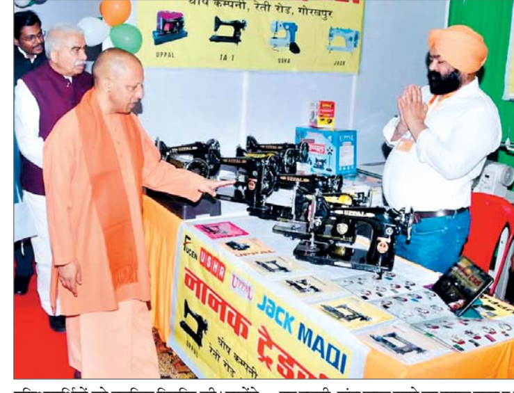
प्रशिक्षार्थियों को टूलकिट वितरित की। उन्होंने कहा कि मुख्यमंत्री युवा उद्यमी योजना के जरिये सरकार ने व्यवस्था की है कि एक वर्ष में एक लाख नए उद्यमी, पांच लाख रुपये का ब्याज मुक्त ऋण उपलब्ध कराएंगे। योगी ने कहा कि अनुसूचित जाति-जनजाति, महिला व अति पिछड़ी जाति के लिए अतिरिक्त सुविधा का प्रावधान किया गया है।