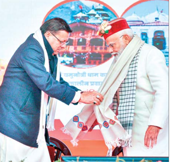
उत्तराखंड में साल के एक बड़े हिस्से में आर्थिक सुस्ती ला देता है। मोदी ने कहा कि वह चाहते हैं कि उत्तराखंड में पर्यटन के लिहाज से कोई भी सीजन ऑफ सीजन न हो और हर सीजन ऑन सीजन रहे। उन्होंने कहा कि इससे उत्तराखंड को अपना आर्थिक सामर्थ्य बढ़ाने में मदद मिलेगी। उन्होंने कहा, अपने पर्यटन क्षेत्र को विविधतापूर्ण बनाना और उसे बारहमासी बनाना उत्तराखंड के लिए बहुत जरूरी है। प्रधानमंत्री ने कहा कि वह देवी गंगा के