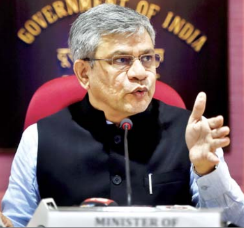
और भी बहुत कुछ आएगा। उन्होंने बताया कि इन जीपीयू का उपयोग करने की लगत ऐतिहासिक रूप से बेहद कम महज 67 रुपये प्रति घंटे है। इससे स्टार्टअप, एफ्लेक्शन डेवलपर, शोधकर्ताओं और

एजेंसी नयी दिल्ली। इलेक्ट्रॉनिक्स एवं सूचना प्रौद्योगिकी मंत्री अश्विनी वैष्णव ने बृहस्पतिवार को कहा कि इंडियाएआई कंयूट पोर्टल पर जीपीयू (ग्राफिक्स प्रोसेसिंग यूनिट) 67 रुपये प्रति घंटे की दर से उपलब्ध होंगे। वैष्णव ने देश में कृत्रिम मेधा (एआई) के लिए अनुकूल हालात बनाने के लिए शुरू किए गए इंडियाएआई मिशन को पहली वर्षगांठ पर इंडियाएआई कंयूट पोर्टल और डेटासेट मंच एआईकोष सहित कई पहल की शुरुआत की। इनका उद्देश्य एआई तक पहुंच को लोकतांत्रिक बनाना और नवाचार को आगे बढ़ाना है। इंडिया एआई कंयूट पोर्टल छात्रों, स्टार्टअप, शोधकर्ताओं, शिक्षाविदों और सरकारी विभागों को 18,000 से अधिक जीपीयू, क्लउड स्टोरेज और अन्य एआई सेवाओं तक पहुंच प्रदान करेगा। इस मौके पर केंद्रीय मंत्री ने कहा, आज हमारे पास 14,000 जीपीयू के लिए एक समान कंयूटिंग सुविधा है, जो हमारे लक्ष्य से कहीं अधिक है। हमने 10,000 जीपीयू का लक्ष्य रखा था। हमारे पास पहले से ही 14,000 जीपीयू मौजूद हैं और अभी 4,000 अन्य निर्माणधीन हैं। आगामी तिमाहियों में