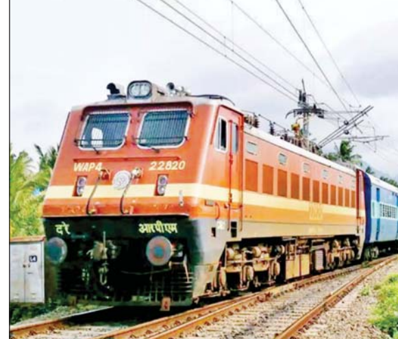
त्रौहार विशेष गाड़ी 05, 08, 12, 15 एवं 19 मार्च बुधवार एवं शनिवार को दरभंगा से 18.00 बजे प्रस्थान कर जनकपुर रोड से 18.42 बजे, सीतामढ़ी से 19.00 बजे, बैरगनियां से 19.30 बजे, रक्सौल से 20.40 बजे, नरकटियागंज से 21.55 बजे, दूसरे दिन गोरखपुर से 01.40 बजे, बस्ती से 02.45 बजे, गोंडा से 04.15 बजे, लखनऊ (उत्तर रेलवे) से 08.05 बजे, बरेली से 11.35 बजे, मुरादाबाद से 13.33 बजे तथा गाजियाबाद से 15.27 बजे दिल्ली 16.35 बजे पहुंचेगी। इस गाड़ी में शयनयान श्रेणी के 15, सामान्य द्वितीय श्रेणी के 02,

लखनऊ। रेलवे प्रशासन द्वारा होली त्रौहार के अवसर पर यात्रियों की होने वाली अतिरिक्त भीड़ को ध्यान में रखते हुये 04012/04011 दिल्ली-दरभंगा-दिल्ली त्रौहार विशेष गाड़ी वाया गोरखपुर का संचलन दिल्ली से 04, 07, 11, 14 एवं 18 मार्च मंगलवार एवं शुक्रवार को तथा दरभंगा से 05, 08, 12, 15 एवं 19 मार्च बुधवार एवं शनिवार को 05 फेरों के लिये किया जायेगा।