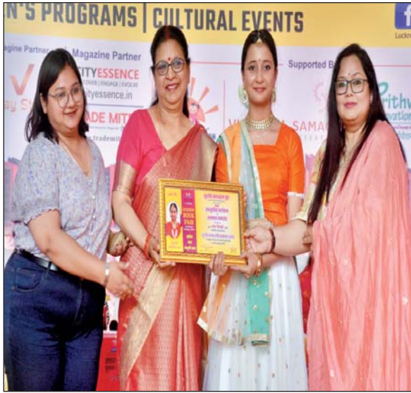
में तब्दील कर सकें। फोर्स वन बुक्स के साथ यूपीएमआरसी लखनऊ मेट्रो, रेंटियो सिटी, ओरिजिंस, विजय स्टाडियो, ज्वाइन हेण्डस फाउण्डेशन, लोकआंगन, विश्वम फाउंडेशन, समग्र प्रॉट्राइजेज, पृथ्वी इन्वेषण, किरन फाउंडेशन, सिटी एसेंस, ट्रेड मित्र, प्लॉटिओ आदि के सहयोग से हो रहे मेले में आज एमिटी यूनिवर्सिटी की ओर से मानसिक स्वास्थ्य पर सहायक