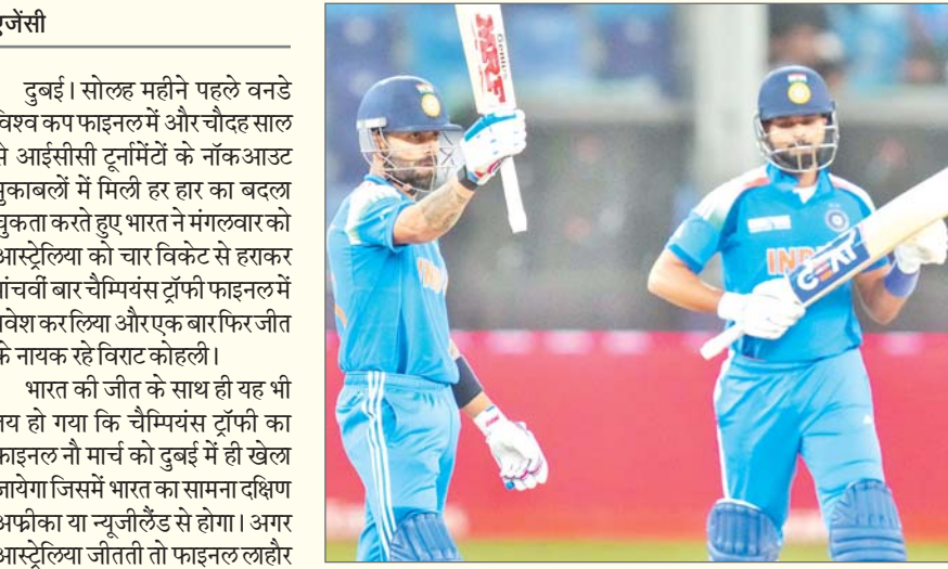
एजेंसी (73) और एलेक्स कैरी (61) के अर्धशतकों के दम पर 48.1 ओवर में 264 रन बनाये जिसके जवाब में भारत ने 11 गेंद बाकी रहते लक्ष्य हासिल कर

ऑस्ट्रेलिया को हराकर चैंपियंस ट्रॉफी से किया बाहर, दूसरा सेमीफाइनल आज