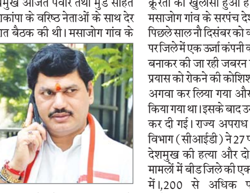
प्रमुख अजित पवार तथा मुंडे सहित राकांपा के वरिष्ठ नेताओं के साथ देर रात बैठक की थी। मसाजोग गांव के लिए कथित तौर पर पैसे दिए थे और छापेमारी के दौरान उन्हे प्रतियों के साथ रंगे हाथों पकड़ा गया। प्रवक्ता ने एक बयान में कहा, कुल मिलाकर इस मामले में अब तक 26 रेलवे अधिकारियों (17 अभ्यर्थियों सहित) को गिरफ्तार किया गया है। एजेंसी ने विद्युत विभाग के एक वरिष्ठ मंडल अधिकारी (संचालन) के खिलाफ प्राथमिकी दर्ज की है जिससे उक्त परीक्षा