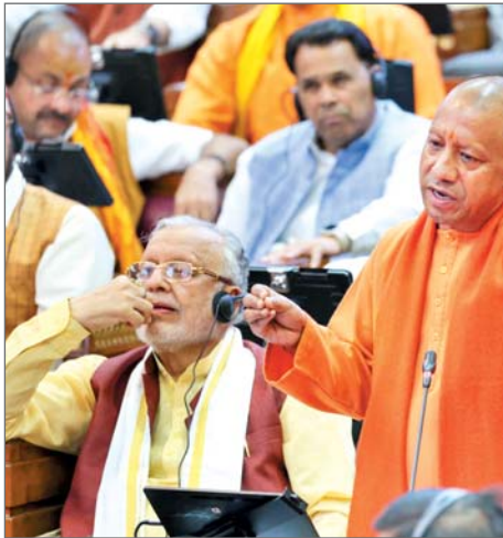
समग्र विकास के साथ-साथ आत्मनिर्भर उत्तर प्रदेश की नींव को सुदृढ़ करने वाला था। वर्ष 2024-25 का बजट प्रभु श्री राम को अर्पित था। यह बजट लोकमंगल को समर्पित था। सीएम योगी ने कहा कि वित्तीय

विशेष संवाददाता लखनऊ। मुख्यमंत्री योगी आदित्यनाथ ने कहा कि प्रदेश में पिछले 8 वर्षों में एक निश्चित थीम के साथ बजट प्रस्तुत किया गया। इसमें वर्ष 2017-18 का बजट अन्नदाता किसानों, वर्ष 2018-19 का बजट इन्फ्रास्ट्रक्चर तथा औद्योगिक विकास, वर्ष 2019-20 का बजट महिला सशक्तिकरण, वर्ष 2020-21 का बजट युवाओं तथा इन्फ्रास्ट्रक्चर विकास, वर्ष 2021-22 का बजट 'स्वावलम्बन से सशक्तिकरण' की थीम पर केन्द्रित था। वहीं वित्तीय वर्ष 2022-23 का बजट 'अन्त्योदय से आत्मनिर्भरता' का बजट था। इसी तरह वित्तीय वर्ष 2023-24 का बजट प्रवेश के 'त्वरित, सर्वसमावेशी और