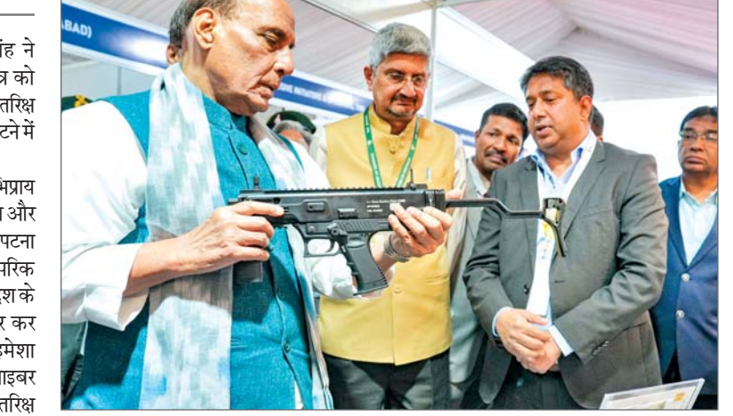
पर आयोजित एक सम्मेलन को संबोधित कर रहे थे। सिंह ने अपने संबोधन में वैश्विक सुरक्षा में बढ़ती जटिलताओं तथा आंतरिक और बाह्य खतरों के बीच बढ़ते हुए अंतरसंबंध को रेखांकित किया। उन्होंने कहा, आधुनिक विश्व में सुरक्षा चुनौतियां तेजी से बढ़ रही हैं तथा आंतरिक और बाह्य सुरक्षा के बीच अंतरसंबंध बढ़ रहा है। सिंह ने कहा यह जरूरी है कि हमारी संस्थाएं बंदिशों को तोड़कर एक मजबूत, सुरक्षित और आत्मनिर्भर भारत सुनिश्चित करने के लिए मिलकर काम करें। रक्षा मंत्री ने कहा कि भारत की राष्ट्रीय सुरक्षा को समग्र रूप से देखा जाना चाहिए, विभिन्न सुरक्षा एजेंसियों के प्रयासों को एकीकृत करना चाहिए तथा नवीनतम तकनीकी प्रगति का लाभ उठाना चाहिए। सिंह ने कहा डीआरडीओ ने भारत की रक्षा क्षमताओं को बढ़ाने में अहम भूमिका निभाई है और आंतरिक सुरक्षा में इसका योगदान भी उतना ही सराहनीय है। उन्होंने ...शेष पृष्ठ 14 पर

एजेंसी नयी दिल्ली। रक्षा मंत्री राजनाथ सिंह ने मंगलवार को कहा कि भारत के सुरक्षा तंत्र को साइबर और हाइब्रिड युद्ध के साथ-साथ अंतरिक्ष आधारित जासूसी जैसे उभरते खतरों से निपटने में सक्षम बने रहना चाहिए। उन्होंने कहा कि आंतरिक सुरक्षा का अभिप्राय केवल आतंकवाद, अलगाववादी आंदोलन और वामपंथी अग्रवाद जैसे पारंपरिक खतरों से निपटना नहीं है, बल्कि इसका मतलब उभर गये पारंपरिक खतरों से निपटने की तैयारी करना भी है जो देश के आर्थिक और सामरिक हितों को अस्थिर कर सकते हैं। सिंह ने कहा आज के शत्रु हमेशा पारंपरिक हथियारों के साथ नहीं आते हैं, साइबर हमले, गलत सूचना अभियान और अंतरिक्ष आधारित जासूसी नए युग के खतरों के रूप में उभर रहे हैं जिन्हें लक्षित उन्नत समाधान की आवश्यकता है। रक्षा मंत्री सिंह रक्षा अनुसंधान एवं विकास संगठन (डीआरडीओ) और गृह मंत्रालय द्वारा संयुक्त रूप से आंतरिक सुरक्षा और आपदा राहत कार्यों के लिए उन्नत प्रौद्योगिकी