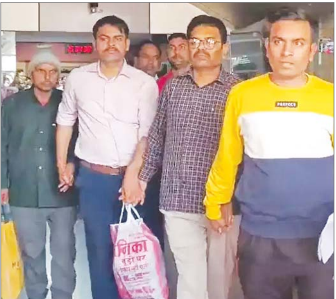
के लिए प्रश्नपत्र तैयार करने की जिम्मेदारी दी गई थी। प्रवक्ता ने कहा रंगे हाथों पकड़ा गया। प्रवक्ता ने एक बयान में कहा, कुल मिलाकर इस मामले में अब तक 26 रेलवे अधिकारियों (17 अभ्यर्थियों सहित) को गिरफ्तार किया गया है। एजेंसी ने विद्युत विभाग के एक वरिष्ठ मंडल अधिकारी (संचालन) के खिलाफ प्राथमिकी दर्ज की है जिससे उक्त परीक्षा

अधिकारियों में विद्युत विभाग का आरोपी वरिष्ठ मंडल अभियंता (संचालन) भी शामिल है। उन्होंने कहा कि आठ स्थानों पर तलाशी ली गई जिसके परिणामस्वरूप 1.17 करोड़ रुपये नकद बरामद हुए। कथित तौर पर यह राशि प्रश्नपत्र लीक करने के लिए उम्मीदवारों से एकत्र की गई थी। पूरा मामला प्रमोशन परीक्षा प्रश्नपत्र लीक कराने से जुड़ा हुआ है। 19 पदों के लिए पदोन्नति परीक्षा होगी। सभी को सीबीआई लखनऊ ले गई है। चंदौली जनपद के दीनदयाल उपाध्याय नगर जंक्शन के रेल मंडल में आज आयोजित होने वाले विभागीय पदोन्नति परीक्षा से पूर्व ही सीबीआई ने बीती देर रात एक साथ कई जगहों पर छापेमारी कर बड़े भ्रष्टाचार का पदाफाश किया है, जिसमें सीबीआई ने 3 उच्चाधिकारियों सहित ढाई दर्जन से अधिक रेलकर्मियों को हिरासत में लेकर पूछताछ किया है, जिसमें से दो अधिकारियों सहित कुल 26 रेलकर्मियों को हिरासत में लेते हुए लखनऊ ले ...शेष पृष्ठ 14 पर