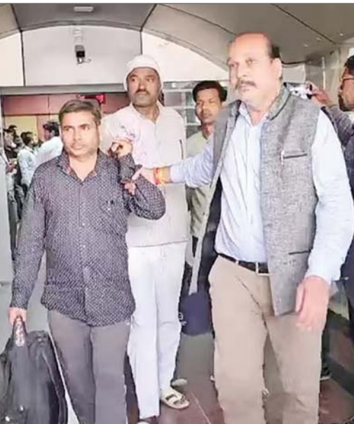
एजेंसी नयी दिल्ली। रेलवे के 26 अधिकारियों की गिरफ्तारी के बाद केन्द्रीय अन्वेषण ब्यूरो (सीबीआई) ने मंगलवार को कहा कि उसने पूर्व मध्य रेलवे (ईसीआर) में विभागीय परीक्षा से जुड़े एक गिरोह का भंडाफोड़ करके 1.17 करोड़ रुपये नकद जब्त किये हैं।

एजेंसी नयी दिल्ली। रेलवे के 26 अधिकारियों की गिरफ्तारी के बाद केन्द्रीय अन्वेषण ब्यूरो (सीबीआई) ने मंगलवार को कहा कि उसने पूर्व मध्य रेलवे (ईसीआर) में विभागीय परीक्षा से जुड़े एक गिरोह का भंडाफोड़ करके 1.17 करोड़ रुपये नकद जब्त किये हैं। सीबीआई के अधिकारियों ने बताया कि रेलवे अधिकारियों को मुगलसराय में मुख्य लोको पायल्ट के पदों पर पदोन्नति से जुड़ी विभागीय परीक्षा के प्रश्नपत्र लीक करने के आरोप में सोमवार रात को गिरफ्तार किया गया। उन्होंने बताया कि परीक्षा मंगलवार को होगी थी। सीबीआई के एक प्रवक्ता ने बताया, मुगलसराय में तीन स्थानों पर (तीन-चार मार्च की मध्य रात्रि) सीबीआई द्वारा की गई जांच के दौरान कुल 17 अभ्यर्थियों के पास हाथ से लिखे प्रश्नपत्रों की छाया प्रति मिली। उन्होंने बताया कि वर्तमान में लोको पायल्ट के रूप में काम कर रहे सभी 17 विभागीय अभ्यर्थियों ने प्रश्नपत्र के