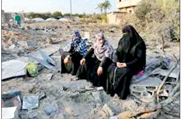
इजराइल-हमारा के बीच संघर्ष विराम का पहला चरण शनिवार को समाप्त हो गया। इसमें मानवीय सहायता में वृद्धि शामिल थी। दोनों पक्षों के बीच अभी दूसरे चरण पर बातचीत होनी बाकी है, जिसमें इजराइल के अपनी सेना वापस बुलाने और स्थायी युद्ध विराम के बदले में हमारा दर्जनों शेष बंधकों को रिहा करेगा। एक इजराइली अधिकारी ने नाम न बताने ...शेष पृष्ठ 14 पर

एजेंसी तेल अवीव। इजराइल ने रविवार को गाजा पट्टी में सभी तरह की राहत सामग्री की आपूर्ति और मानवीय सहायता पर रोक लगाने के साथ चेतावनी दी कि यदि हमारा ने संघर्ष विराम के विस्तार के लिए अमेरिकी प्रस्ताव को स्वीकार नहीं किया तो उसे अतिरिक्त परिणाम भुगतने होंगे। हमारा ने इजराइल पर नाजुक संघर्ष विराम समझौते को पट्टी से उतारने की कोशिश करने का आरोप लगाते हुए कहा कि सहायता बंद करने का उसका फैसला जबरन वसूली का घटिया हथकंडा, युद्ध अपराध और (संघर्ष विराम) समझौते पर हमला है। यह समझौता जनवरी में हुआ था।