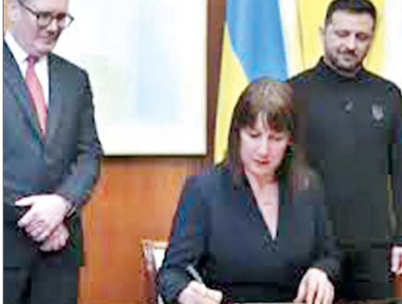
अपना यह दावा दोहराया कि इसे कायम रखने के लिए अमेरिकी सुरक्षा गारंटी की आवश्यकता होगी। स्टॉर्मर यूक्रेन पर चर्चा के लिए रविवार को लंदन में

लंदन। ब्रिटेन, फ्रांस और यूक्रेन एक युद्धविराम योजना पर काम करने के लिए सहमत हो गए हैं, जिसे अमेरिका के समक्ष प्रस्तुत किया जाएगा। ब्रिटिश प्रधानमंत्री केअर स्टॉर्मर ने यह जानकारी दी। स्टॉर्मर ने कहा कि यह योजना चार देशों के नेताओं के बीच बातचीत के बाद सामने आई है। यूक्रेन के राष्ट्रपति वोलेदिमिर जेलेन्स्की और अमेरिका के राष्ट्रपति डोनाल्ड ट्रंप के बीच ओवल ऑफिस (अमेरिका के राष्ट्रपति का कार्यालय) में हुई तीखी बहस के एक दिन बाद यह योजना सामने आई है। प्रधानमंत्री ने बीबीसी को बताया कि उनका मानना है कि अमेरिकी राष्ट्रपति यूक्रेन में स्थायी शांति चाहते हैं। उन्होंने