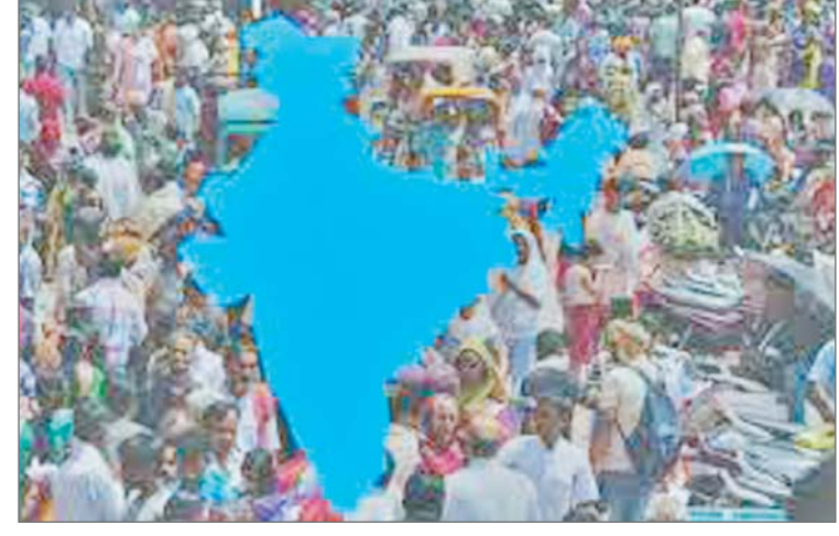
बहुभाषी शिक्षा नीतियां और तौर-तरीके लागू करने की सिफारिश की, जिसका लक्ष्य सभी शिक्षार्थियों को लाभ पहुंचाने वाली शैक्षिक प्रणाली बनाना हो। टीम ने लेम्बेज मैटर: ग्लोबल गाइडेंस ऑन

एजेंसी नयी दिल्ली। संयुक्त राष्ट्र शैक्षिक, वैज्ञानिक एवं सांस्कृतिक संगठन (यूनेस्को) की वैश्विक शिक्षा निगरानी (जीईएम) टीम के अनुसार, वैश्विक आबादी में 40 प्रतिशत लोगों के पास उस भाषा में शिक्षा हासिल करने की सुविधा नहीं है, जिसे वे बोलते या समझते हैं। विभिन्न देशों में घरेलू भाषा की भूमिका के बारे में समझ बढ़ने के बावजूद, नीतिगत पहल सीमित बनी हुई है। टीम के अनुसार इस मामले में घरेलू भाषाओं का उपयोग करने की शिक्षकों की सीमित क्षमता, घरेलू भाषाओं में पाठ्य सामग्री की अनुपलब्धता और सामुदायिक विरोध जैसी कुछ चुनौतियों में शामिल हैं। कुछ निम्न और मध्यम आय वाले देशों में यह आंकड़ा 90 प्रतिशत तक है। जीईएम अधिकारियों ने कहा कि 25 करोड़ से अधिक शिक्षार्थी इससे प्रभावित हैं। उन्होंने राष्ट्रीय