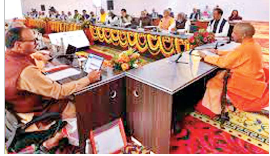
हुई। उन्होंने कहा कि प्रदेश में सड़क हादसों में हुए कुल मौतों में 42 प्रतिशत इन जनपदों में दर्ज की गईं। उन्होंने मौतों को नियंत्रित करने के लिए दुर्घटना के कारणों को खोजने एवं लोगों में सड़क सुरक्षा को लेकर जागरूकता बढ़ाने का निर्देश दिया। मुख्यमंत्री ने कहा कि सड़क दुर्घटनाओं को रोकने के लिए यह आवश्यक है कि जनपद स्तर पर प्रत्येक माह एवं मंडल स्तर पर त्रैमासिक मंडलीय सड़क सुरक्षा समिति की बैठक अनिवार्य रूप से हो। योगी ने कहा कि तेज रफ्तार से वाहन चलाना, नशे में मंडल चलाना, गलत दिशा में वाहन चलाना, सिग्नल तोड़ना और मोबाइल फोन का इस्तेमाल सड़क दुर्घटना घटना होने के मुख्य कारण हैं, जिन्हें लेकर लोगों में जागरूकता फैलाने की आवश्यकता है। उन्होंने कहा कि बेसिक शिक्षा विभाग, माध्यमिक शिक्षा विभाग और उच्च शिक्षा विभाग अपने स्कूल-कॉलेज में सड़क सुरक्षा से संबंधित विभिन्न गतिविधियों को आयोजित कर जागरूकता फैलाएं।

लखनऊ। उत्तर प्रदेश के मुख्यमंत्री योगी आदित्यनाथ ने रविवार को अधिकारियों को निर्देश दिया कि राज्य के सभी एक्सप्रेस-वे के दोनों तरफ फूड प्लजा की तरह अस्पताल की भी व्यवस्था करें। आधिकारिक बयान के मुताबिक, उत्तर प्रदेश राज्य सड़क सुरक्षा परिषद की बैठक में मुख्यमंत्री ने राज्य में होने वाली सड़क दुर्घटनाओं पर अंकुश लगाने के लिए आवश्यक दिशा-निर्देश दिए। इस बैठक में संबंधित विभागों के मंत्री, शासन स्तर के अधिकारी, सभी मंडलों के मंडलयुक्त, सभी जनपदों के जिलाधिकारी, पुलिस आयुक्त और पुलिस अधीक्षक (एसपी) मौजूद रहे। सड़क दुर्घटनाओं के वार्षिक आंकड़ों पर चर्चा करते हुए मुख्यमंत्री ने कहा कि वर्ष 2024 में उत्तर प्रदेश में 46,052 सड़क दुर्घटनाएं दर्ज की गईं, जिनमें कुल 34,600 लोग घायल हुए और 24 हजार से अधिक मौतें हुईं। उन्होंने कहा कि ये आंकड़े बेहद दुखद हैं और इनमें हर हाल में कमी लानी होगी। योगी ने कहा कि सड़क सुरक्षा से जुड़े सभी विभाग आपसी समन्वय एवं सामूहिक प्रयासों के जरिये सड़क दुर्घटनाओं की घटनाओं पर अंकुश लगाएं और प्रदेश के सभी मार्गों पर ब्लैक स्पॉट को चिन्हित कर उन्हें ठीक कराएं। मुख्यमंत्री ने सड़क हादसों में घायल लोगों के इलाज के विषय में चिंता जाहिर करते हुए कहा कि सभी एक्सप्रेस-वे के दोनों तरफ फूड प्लजा की तरह अस्पताल की व्यवस्था करें। साथ ही सभी मंडल मुख्यालयों के अस्पतालों में ट्रामा सेंटर, एंबुलेंस और प्रशिक्षित कर्मियों की तैनाती भी सुनिश्चित की जाए। योगी ने कहा कि वर्ष 2024 में प्रदेश के 75 जनपदों में