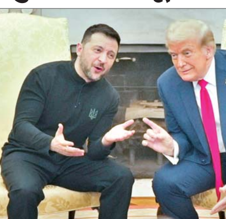
आपके साथ काम करते रहेंगे। फ्रांस के राष्ट्रपति इमैनुएल मैक्रॉन ने एकस पर लिखा एक हमलावर है: रूस। एक पीड़ित है: यूक्रेन। हमारा तीन साल पहले यूक्रेन की मदद करना और रूस पर प्रतिबंध लगाना सही था - और ऐसा करते रहना सही भी है। मैक्रॉन ने कहा, हमारे से

एजेंसी। न्यूयॉर्क। अमेरिका के राष्ट्रपति डोनाल्ड ट्रंप और यूक्रेन के राष्ट्रपति वोलोदिमिर जेलेंस्की के बीच ओवल ऑफिस में हुई तीखी बहस के बाद यूक्रेन के यूरोपीय साझेदारों और दुनिया के अलग-अलग देशों के नेताओं ने जहां जेलेंस्की का समर्थन किया तो वहीं दूसरी ओर व्हाइट हाउस ट्रंप के साथ खड़ा दिखाई दिया।