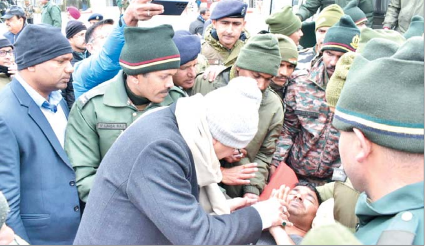
आर्मी अस्पताल में श्रमिकों से मुलाकात भी की। हैलीपेड पर रेस्क्यू श्रमिकों का भी हाल जाना। मुख्यमंत्री ने बताया कि बीआरओ के कंटेनरों में श्रमिक रह रहे थे। कुल 57 श्रमिकों में से दो श्रमिक ... शेष पृष्ठ 14 पर

प्रमुख संवाददाता। देहरादून। चमोली के माणा के पास हुए हिमस्खलन की चपेट में आये 55 श्रमिकों में से 50 श्रमिकों को रेस्क्यू कर लिया गया है। पांच श्रमिकों की खोज जारी है। कंटेनरों को ढूँढने के लिए दिल्ली से जीपीआर रडार मंगवायी जा रही है। मुख्यमंत्री पुष्कर सिंह धामी स्वयं माणा गांव पहुंचकर बचाव कार्य की मॉनिटरिंग कर रहे हैं। प्रधानमंत्री नरेन्द्र मोदी ने फोन पर मुख्यमंत्री धामी से रेस्क्यू ऑपरेशन की जानकारी ली। रक्षा मंत्री, गृह मंत्री द्वारा निरंतर अपडेट लिया जा रहा है। एवलांच में चार श्रमिकों की मृत्यु होने की सूचना है। मुख्यमंत्री पुष्कर सिंह धामी ने माणा पहुंचकर घटनास्थल का हवाई सर्वेक्षण भी किया। ज्योतिर्मठ के