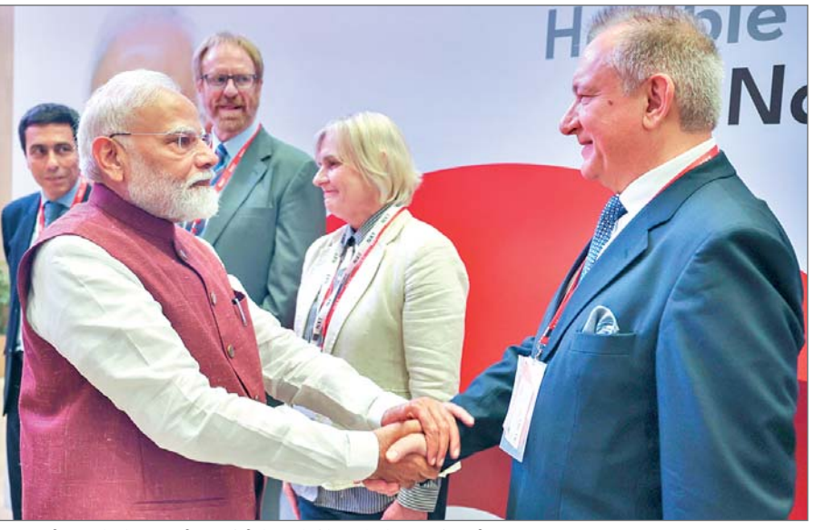
एनएक्सटी कॉन्वलेव में प्रधानमंत्री नरेन्द्र मोदी से मिलते प्रोफेसर वेसेलिन पापोव्सकी

एजेंसी। नयी दिल्ली। प्रधानमंत्री नरेन्द्र मोदी ने शनिवार को कहा कि उनका वोकल फॉर लोकल अभियान अब रंग ला रहा है, क्योंकि भारतीय उत्पाद वैश्विक हो रहे हैं और दुनिया भर में अपनी उपस्थिति दर्ज करा रहे हैं। मोदी ने एनएक्सटी सम्मेलन में कहा कि भारत अनंत नवोन्मेषों, किफायती समाधान खोजने और उन्हें विश्व को उपलब्ध कराने की भूमि बन रहा है। मोदी ने कहा दुनिया 21वीं सदी के भारत को उत्सुकता से देख रही है। दुनिया भर से लोग भारत आना और उसे समझना चाहते हैं। उन्होंने कहा कि देश अब विनिर्माण केंद्र और दुनिया के कारखाने के रूप में उभर रहा है। मोदी ने कहा दशकों से दुनिया भारत को अपना बैंक ऑफिस कहती रही है। अब भारत दुनिया का नया कारखाना बन रहा है। हम अब केवल कार्यबल नहीं रह गए हैं, बल्कि एक विश्व शक्ति बन रहे हैं। प्रधानमंत्री ने कहा कि भारत के बढ़ते रक्षा उत्पाद दुनिया के सामने इसकी इंजीनियरिंग और प्रौद्योगिकी की ताकत को दर्शाते हैं। मोदी ने कहा, इलेक्ट्रॉनिक्स से लेकर ऑटोमोबाइल के क्षेत्र तक दुनिया ने भारत के पैमाने और क्षमता को देखा है। भारत न केवल दुनिया को उत्पाद उपलब्ध करा रहा है, बल्कि वैश्विक आपूर्ति श्रृंखला में एक भरोसेमंद और विश्वसनीय भागीदार भी बन रहा है। प्रधानमंत्री ने कहा कि विभिन्न क्षेत्रों में भारत का नेतृत्व वर्षों की कड़ी मेहनत और व्यवस्थित नीतितंत्र निर्णयों का परिणाम है। उन्होंने कहा मैंने कुछ साल पहले देश