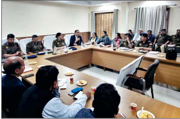
जिला संवाददाता (vot)