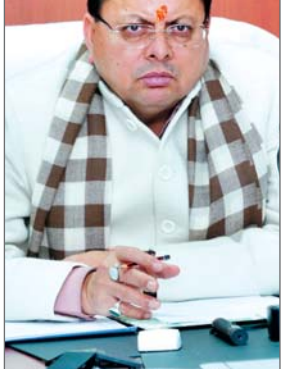
हिमस्खलन में फंसे लोगों को निकालने के लिए युद्ध स्तर पर राहत एवं बचाव कार्य जारी है। शाम 5:00 बजे तक 32 लोगों को सुरक्षित निकाल लिया गया

प्रमुख संवाददाता देहरादून। मुख्यमंत्री पुष्कर सिंह धामी ने राज्य आपातकालीन परिचालन केंद्र, आईटी पार्क देहरादून पहुंचकर चमोली के माणा गांव के पास हुए हिमस्खलन के संबंध में अधिकारियों के साथ बैठक कर हिमस्खलन के बाद रेस्क्यू अभियान में तेजी लाने के निर्देश दिए। मुख्यमंत्री ने हिमस्खलन की स्थिति के बारे में भी पूरी जानकारी ली।