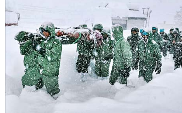
है। शेष 25 लोगों को निकालने की कार्यवाही गतिमान है। मुख्यमंत्री ने अधिकारियों को अति शीघ्र घटनास्थल में पहुंचने के निर्देश दिये