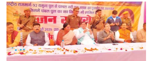
उदी, इटावा। उत्तर प्रदेश व मध्य प्रदेश को जोड़ने वाली एक नए 92 इटावा -