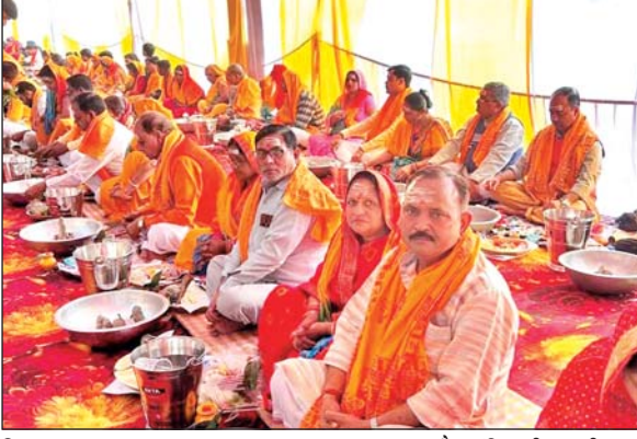
जिला संवाददाता (VOL)

मिल्कीपुर अयोध्या। क्षेत्र के महर्षि बामदेव तपोस्थली बंवा में सुबह 4 बजे से शाम तक शिव भक्तों का जलाभिषेक करने के लिए ताता लगा रहा, कुमारगंज पुलिस ने मंदिर से 100 मीटर पहले ही बैरिकेडिंग लगाकर श्रद्धालुओं की भीड़ को नियंत्रित करती रही जिससे भक्तों को आने-जाने में कोई परेशानी हो, महर्षि बामदेव सिंगार सेवा समिति के तत्वाधान में 151 जोड़ों ने रुद्राभिषेक किया, भक्तों ने पार्थिव शिवलिंग पर मंत्रोच्चार के साथ विधिवत पूजा अर्चना करते हुए रुद्राभिषेक किया रुद्राभिषेक में कृषि विश्वविद्यालय कुमारगंज के कई