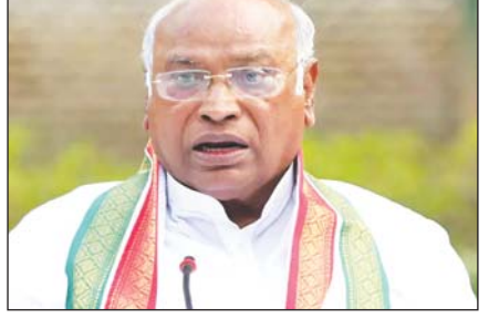
कटौती तो की है, साथ ही औसतन साल-दर-साल 25 प्रतिशत फंड भी कम खर्च किया है। खरगे ने सवाल किया कि जब तक देश के कमजोर वर्ग के छात्रों को अवसर नहीं मिलेगा, उनके हुनर को प्रोत्साहन नहीं मिलेगा, तब तक हम अपने देश के युवाओं के लिए नौकरियों कैसे बढ़ा पाएंगे? उन्होंने आरोप लगाया, आपका सबका साथ, सबका विकास का नारा, योजना कमजोर वर्गों के अरमानों का मजाक उड़ाता है।

नयी दिल्ली। कांग्रेस अध्यक्ष मल्लिकार्जुन खरगे ने अनुसूचित जाति, अनुसूचित जनजाति, अन्य पिछड़े वर्गों और अल्पसंख्यक समुदायों के बच्चों की छात्रवृत्ति के लाभार्थियों की संख्या में कथित गिरावट को लेकर मंगलवार को आरोप लगाया कि सबका साथ, सबका विकास का नारा कमजोर वर्गों के अरमानों का मजाक उड़ाता है। उन्होंने सोशल मीडिया मंच एक्स पर एक चार्ट साझा किया जिसमें उल्लेख है कि एससी, एसटी, ओबीसी और अल्पसंख्यक बच्चों के लिए छात्रवृत्ति के लाभार्थियों में भारी गिरावट आई है। खरगे ने एक्स पर प्रधानमंत्री नरेन्द्र मोदी को संबोधित एक पोस्ट में कहा, नरेन्द्र मोदी जी, देश के एससी, एसटी, ओबीसी और अल्पसंख्यक वर्ग के युवाओं की छात्रवृत्तियों को आपकी सरकार ने हथियाने का काम किया है। उन्होंने दावा किया कि ये शर्मनाक सरकारी आंकड़े बताते हैं कि सभी वर्गों में मोदी सरकार ने लाभार्थियों की संख्या में भारी