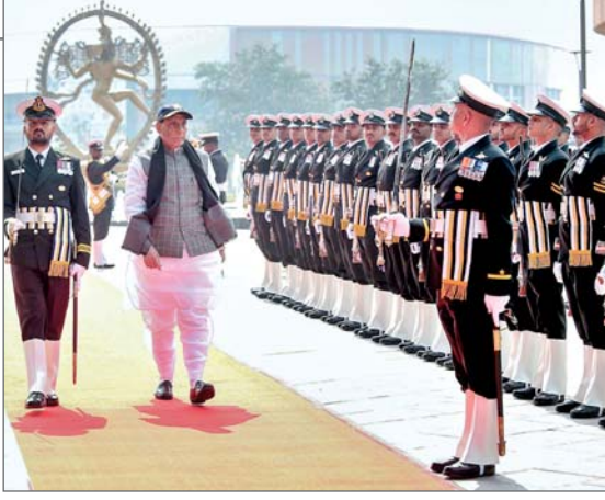
समुद्री डकैती, आतंकवाद, घुसपैट, तस्करी और आवैध तरीके से मछली पकड़ने की चुनौतियाँ हैं, जिनके लिए समुद्री सेनाएं, खास तौर पर आईसीजी हमेशा सतर्क रहती हैं। सिंह ने कहा कि आईसीजी इन चुनौतियों से निपटने के लिए सक्रियता से काम कर रहा है और वरिष्ठनीतिक सुरक्षा सुनिश्चित करने में प्रमुख भूमिका निभाता है।

आईसीजी के परिचालन की प्रशंसा करते हुए रक्षा मंत्री ने कहा कि उसने पिछले एक साल में 14 नौवों और 115 समुद्री लुटेरों को पकड़ा, साथ ही लगभग 37,000 करोड़ रुपये कीमत के मादक पदार्थ जब्त किए। उन्होंने कहा कि इसके अलावा, आईसीजी ने विभिन्न बचाव कार्यों के माध्यम से 169 लोगों की जान बचाई और गंभीर रूप से घायल 29 लोगों को चिकित्सा सहायता प्रदान की। उन्होंने कहा, भौगोलिक दृष्टि से भारत तीन तटों से समुद्र से घिरा हुआ है और इसकी तटरेखा बहुत बड़ी है। देश की सामरिक सुरक्षा दो तटों के खतरों का सामना करती है। पहला युद्ध है, जिसका सामना सशस्त्र बलों को करना पड़ता है और दूसरा