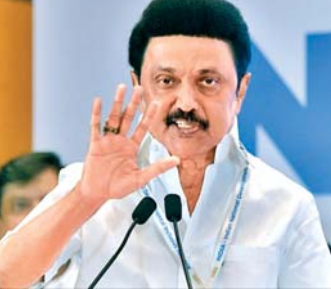
आंदोलन के वंशज हैं, जिसमें एक सिद्धांतवादी सेना थी जिसने तमिल की रक्षा के लिए अपने जीवन का बलिदान दिया। स्टालिन ने कहा कि 1965 से ही द्रमुक का अनेक बलिदान के माध्यम से हिंदी से मातृभाषा की रक्षा करने का इतिहास रहा है। 1971 में कोयंबटूर में द्रमुक की छात्र इकाई द्वारा आयोजित हिंदी विरोधी सम्मेलन में उन्होंने कहा था कि वह बलिदान देने के लिए तैयार हैं।

चेन्नई। द्रमुक अध्यक्ष और तमिलनाडु के मुख्यमंत्री एम के स्टालिन ने मंगलवार को केंद्र पर राज्य में हिंदी थोपकर भाषा युद्ध के बीज बोने का आरोप लगाया और कहा कि हिंदी के वचस्व की अनुमति नहीं दी जाएगी। स्टालिन ने कहा कि उनका राज्य किसी विशेष भाषा के खिलाफ नहीं है और किसी भी भाषा को सीखने की इच्छा रखने वाले किसी भी व्यक्ति के रास्ते में नहीं आएगा, लेकिन वह किसी भी अन्य भाषा को मातृभाषा तमिल पर हावी होने और उसे नष्ट करने की अनुमति नहीं देने के लिए दृढ़ संकल्पित है। स्टालिन ने अपने पार्टी कार्यकर्ताओं को संबोधित एक पत्र में कहा, यही कारण है कि हम द्विभाषी