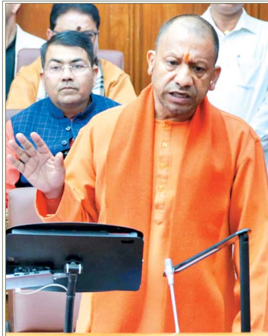
विधान परिषद में बोलते मुख्यमंत्री योगी आदित्यनाथ

लखनऊ। उत्तर प्रदेश के मुख्यमंत्री योगी आदित्यनाथ ने मंगलवार को विधान परिषद में कहा कि महाकुम्भ ने प्रयागराज, अयोध्या, काशी, मथुरा, गोरखपुर को नए पंच तीर्थ के रूप में जोड़ा है तथा प्रदेश अब नए युग की ओर अग्रसर हो रहा है। विधानमंडल बजट सत्र के छठवें दिन विधान परिषद में राज्यपाल के अभिभाषण पर धन्यवाद प्रस्ताव पर हुई चर्चा का जवाब दे रहे मुख्यमंत्री ने महाकुम्भ के आयोजन को लेकर विपक्ष द्वारा लगाए गए आरोपों को सिरे से खारिज कर दिया। उन्होंने कहा कि महाकुम्भ में सभी को अपनी दृष्टि के अनुरूप चीजें देखने मिली है। मुख्यमंत्री ने कहा कि महाकुम्भ दुनिया में अब तक हुए सभी आयोजनों के रिकॉर्ड तोड़ रहा है। प्रयागराज महाकुम्भ ने प्रदेश में नए पंच तीर्थ को जोड़ा है, जिसके माध्यम से श्रद्धालु प्रयागराज, अयोध्या, काशी, गोरखपुर, मथुरा