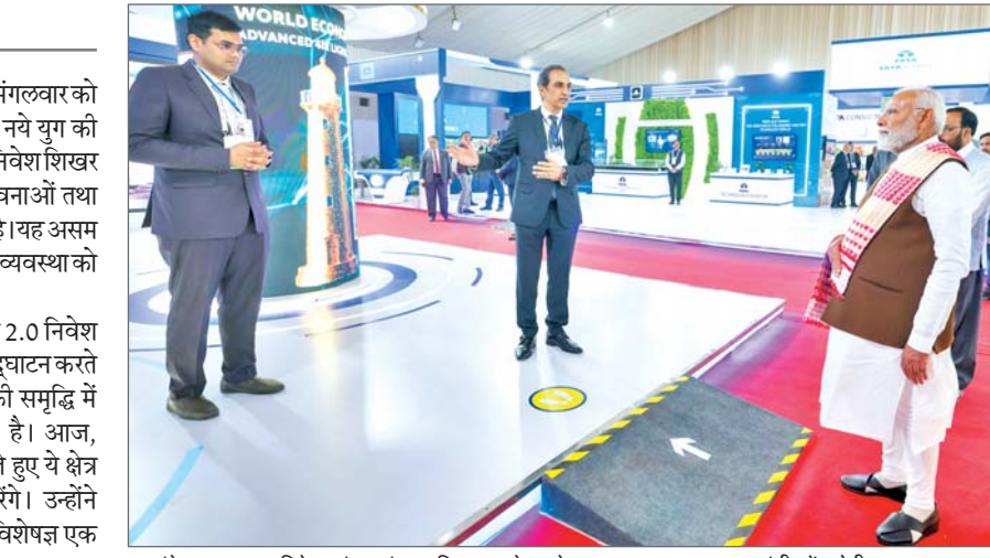
एडवांटेज असम 2.0 निवेश एवं अवसंरचना शिखर सम्मेलन के उद्घाटन अवसर पर प्रधानमंत्री नरेन्द्र मोदी

गुवाहाटी। प्रधानमंत्री नरेन्द्र मोदी ने मंगलवार को कहा कि यह पूर्वोत्तर की पवित्र भूमि में नये युग की शुरुआत है और एडवांटेज असम 2.0 निवेश शिखर सम्मेलन पूरी दुनिया को राज्य की संभावनाओं तथा प्रगति से जोड़ने का एक महान अभियान है। यह असम की करीब छह लाख करोड़ रुपये की अर्थव्यवस्था को रेखांकित करेगा। प्रधानमंत्री ने यहां एडवांटेज असम 2.0 निवेश एवं अवसंरचना शिखर सम्मेलन का उद्घाटन करते हुए कहा इतिहास गवाह है कि भारत की समृद्धि में पूर्वी भारत ने प्रमुख भूमिका निभाई है। आज, विकसित भारत के लक्ष्य की ओर बढ़ते हुए ये क्षेत्र अपनी वास्तविक क्षमता का प्रदर्शन करेंगे। उन्होंने कहा वैश्विक अस्थिरता के बावजूद, विशेषज्ञ एक बात पर पूरी तरह से सहमत ...शेष पृष्ठ 14 पर