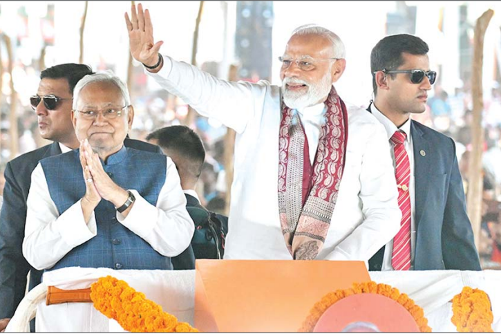
बड़ा महोत्सव है। पूरे यूरोप की जितनी जनसंख्या है, उससे भी ज्यादा अब तक महाकुम्भ में प्रयागराज में एकता का महाकुम्भ चल रहा है। यह भारत की आस्था, एकता और समरसता का सबसे

एजेसी भागलपुर। प्रधानमंत्री नरेन्द्र मोदी ने राष्ट्रीय जनता दल (राजद) के प्रमुख लालू प्रसाद द्वारा महाकुम्भ को लेकर की गयी टिप्पणी की ओर इशारा करते हुए सोमवार को कहा कि राम मंदिर से चिढ़ने वाले लोग महाकुम्भ को कोसने का कोई मौका नहीं छोड़ रहे हैं लेकिन ऐसे लोगों को बिहार कभी भी माफ नहीं करेगा। बिहार के भागलपुर जिले में किसान सम्मान निधि की 19 वीं किस्त जारी किये जाने को लेकर आयोजित एक कार्यक्रम में मोदी ने अपने संबोधन में प्रसाद पर प्रहार करते हुए कहा, राजग सरकार भारत की गौरवशाली विरासत के संरक्षण और वैभवशाली भविष्य के निर्माण के लिए एक साथ काम कर रही है, लेकिन यह जो जंगल राज वाले हैं, इनको हमारी धरोहर से, हमारी आस्था से नफरत है। राजद सुप्रीमो पर अपना प्रहार जारी रखते हुए मोदी ने कहा इस समय प्रयागराज में एकता का महाकुम्भ चल रहा है। यह भारत की आस्था, एकता और समरसता का सबसे