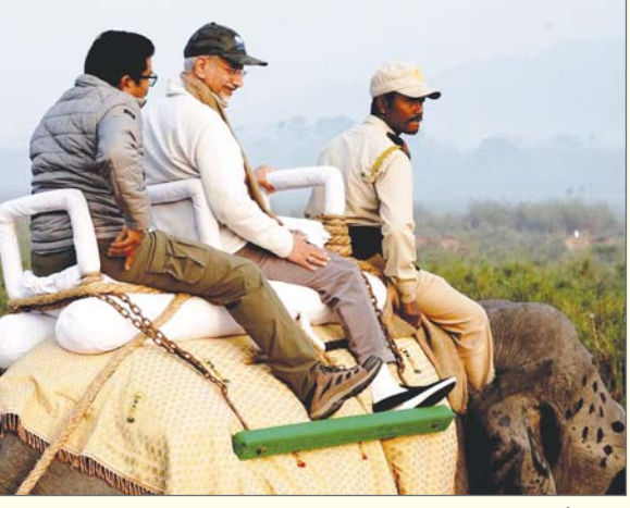
गुवाहाटी। विदेश मंत्री एस जयशंकर और 61 देशों के राजनयिकों ने सोमवार सुबह काजीरंगा राष्ट्रीय उद्यान में हाथी की सवारी की और जीप सफारी का आनंद लिया। अधिकारियों ने यह जानकारी दी। ये राजनयिक

रविवार रात विदेश मंत्री के साथ जोरहाट पहुंचे थे और आज सुबह काजीरंगा पहुंचे। राजनयिकों ने सबसे पहले पार्क के केंद्रीय रेंज कोहोरा में हाथी की सवारी का आनंद लिया। जयशंकर महार हाथी प्रच्युन पर सवार हुए। मुख्यमंत्री हिमंत विश्व शर्मा ने पहले कहा था कि कई राजनयिकों के जीवनसाथियों ने इस यात्रा का लभ उठाया, जबकि एडवॉटज असम 2.0 इंफ्रास्ट्रक्चर एंड इन्वेस्टमेंट समिट में भाग लेने वाले देशों जैसे भूटान, जापान, दक्षिण कोरिया, थाईलैंड, मलेशिया, इंडोनेशिया और अन्य के राजदूत सीधे गुवाहाटी पहुंचेंगे। हाथी की सवारी के बाद राजनयिकों ने यूनेस्को के ...शेष पृष्ठ 14 पर