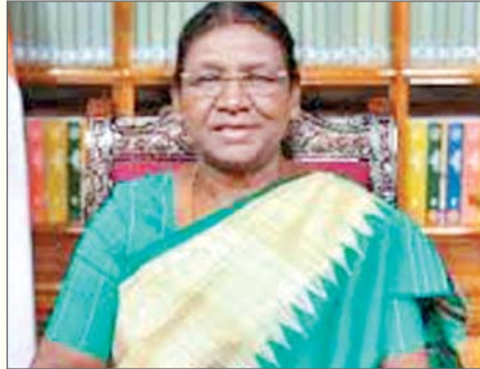
कहा कि आज अंतरराष्ट्रीय शांति एवं सुरक्षा के लिए नौ सक्रिय मिशनों में 5,000 से अधिक भारतीय शांति रक्षक तैनात हैं। मुर्मू ने कहा कि आज संयुक्त राष्ट्र के छह मिशनों में 154 से अधिक भारतीय महिला शांति रक्षक तैनात हैं। 1960 के दशक में कांगो से लेकर 2007 में लाइबेरिया तक, हमारी महिला शांति रक्षकों ने व्यावसायिकता और आचरण की उच्चतम परंपराओं का प्रदर्शन किया है। राष्ट्रपति कार्यालय द्वारा जारी एक बयान के अनुसार, महिला शांति रक्षक शांति स्थापना में महिलाएं एक ग्लोबल साउथ परिप्रेक्ष्य विषय पर एक सम्मेलन में भाग लेने के लिए राष्ट्रीय राजधानी में हैं।

नयी दिल्ली। राष्ट्रपति द्रौपदी मुर्मू ने सोमवार को कहा कि संयुक्त राष्ट्र शांति मिशनों में अधिक संख्या में महिलाओं को शामिल करना जरूरी है क्योंकि वे लैंगिक हिंसा से निपटने, विश्वास कायम करने और संवाद को बढ़ावा देने में ज्यादा सक्षम होती हैं। राष्ट्रपति भवन में राष्ट्रपति से मुलाकात करने आई महिला शांति रक्षकों के एक समूह को संबोधित करते हुए उन्होंने कहा कि शांति मिशन में महिलाओं की उपस्थिति इससे और अधिक विविध और समावेशी बनाती है। मुर्मू ने कहा, महिला शांति रक्षकों की स्थानीय समुदायों तक बेहतर पहुंच होती है और वे महिलाओं और बच्चों के लिए आदर्श बन सकती हैं। वे लैंगिक हिंसा से निपटने, विश्वास कायम करने और संवाद को बढ़ावा देने में अधिक सक्षम हैं। राष्ट्रपति ने कहा कि जिन शांति मिशनों में महिला कर्मियों का प्रतिशत अधिक है, वे हिंसा को कम करने तथा दीर्घकालिक शांति समझौते प्राप्त करने में अधिक प्रभावी रहे हैं। उन्होंने कहा, इसलिए यह आवश्यक है कि हम संयुक्त राष्ट्र शांति मिशनों में अधिकाधिक महिलाओं को शामिल करें। राष्ट्रपति ने संयुक्त राष्ट्र शांति स्थापना में योगदान के भारत के गौरवशाली इतिहास को याद किया, जिसमें 50 से अधिक मिशनों में 2,90,000 (2.90 लाख) से अधिक शांति रक्षकों ने सेवाएं दी हैं। मुर्मू ने