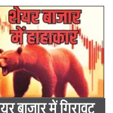
शेयर बाजार में गिरावट

यह एक साल के अंदर ही किसी ज्वालामुखी के विस्फोट की तरह भी फूट सकते हैं। यह विस्फोट इतना भयानक होगा कि इस स्वनामधन्य अर्थशास्त्री के मुताबिक अगले 14-15 सालों में भी शेयर बाजार उबर नहीं पाएगी। हालांकि दोनों ही अर्थशास्त्रियों ने मुख्य रूप से यह भविष्यवाणी अमरीकी शेयर बाजारों को ध्यान में रखकर किया है। लेकिन हम सब ये जानते हैं कि दुनिया भर के शेयर बाजार आज की तारीख में अमेरिका के शेयर बाजारों से इस तरह से जुड़े हुए हैं, मानों उनके बीच आपस में गर्भनाल का संबंध हो। बहरहाल हैरी डेंट के मुताबिक नॉर्मल था? शायद हम इसे नॉर्मल ही मानें, लेकिन इसी बीच दुनिया के दो अर्थशास्त्रियों की ऐसी भविष्य वाणियां सामने आयी हैं, जिन्होंने आम नहीं बल्कि शेयर बाजार के विशेषज्ञ खिलाड़ियों के भी होश ठिकाने लगा दिये हैं। ये दोनों भविष्यवाणियां अमरीका से आयी हैं और हैरानी की बात ये थी कि थोड़े बहुत अंतर के साथ ये बिल्कुल एक जैसी ही हैं। पहली भविष्यवाणी अमरीकी अर्थशास्त्री हैरी डेंट की थी, जिनका कहना है कि आगले साल तक दुनिया भर के शेयर बाजारों में भारी गिरावट आ सकती है। यह हाहाकारी गिरावट साल 1925 से 1929 के बीच आयी मंदी से भी ज्यादा भयानक होगी। दूसरी भविष्यवाणी हालांकि पहली भविष्यवाणी से थोड़ी कम डरावनी है, लेकिन डराती बंध थी। क्योंकि यह दूसरी भविष्यवाणी भी ऐसे व्यक्ति ने की है, जिसे शेयर बाजार का दुनिया भर के शेयर बाजारों में भारी गिरावट आ सकती है। यह हाहाकारी गिरावट साल 1925 से 1929 के बीच आयी मंदी से भी ज्यादा भयानक होगी।