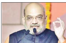
पूरी रात चलने वाला यह समारोह बुधवार को शाम छह बजे शुरू होगा और अगली सुबह छह बजे इसका समापन होगा। इसमें कहा गया है कि कर्नाटक के उ मध्यमंत्रि डी के शिवकुमार विभिन्न राज्यों के राज्यपाल, केंद्रीय मंत्रि एवं अन्य लोग इस कार्यक्रम में शामिल होंगे।

कोयंबटूर। ईशा योग केंद्र में 26 फरवरी को आयोजित होने वाले महाशिवरात्रि समारोह में केंद्रीय गृह मंत्री अमित शाह एवं अन्य गणमान्य लोग शामिल होंगे। केंद्र ने एक बयान जारी कर इसकी जानकारी दी है। बयान में कहा गया है कि योग केंद्र के संस्थापक सदस्य एच अवसर पर एक मुफ्त ध्यान एप का अनावरण करेंगे। इसमें कहा गया है, केंद्रीय गृह मंत्री अमित शाह 26 फरवरी 2025 को ईशा योग केंद्र में आदियोगी और सदस्य की उपस्थिति में महाशिवरात्रि समारोह में शामिल होंगे। बयान में कहा गया है कि