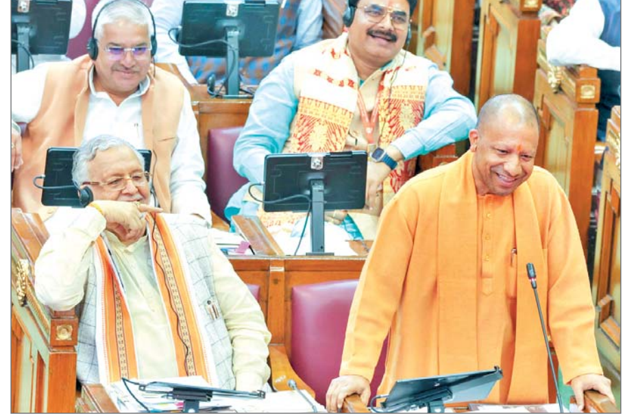
प्रतिशत की कमी आई है। हत्या की घटनाओं में 41.01 प्रतिशत, बलवा की घटनाओं में 66.4 प्रतिशत व फिरौती के लिए अपहरण की घटनाओं में 54.72 प्रतिशत की कमी आई है। देहेज हत्या के मामलों में 17.08 प्रतिशत और बलात्कार की घटनाओं में 26.15 प्रतिशत की कमी आई है। मुख्यमंत्री ने दावा करते हुए कहा, कि

विशेष संवाददाता लखनऊ। मुख्यमंत्री योगी आदित्यनाथ ने राष्ट्रीय अपराध अभिलेख ब्यूरो (एनसीआरबी) के आंकड़ों के हवाले से राज्य की कानून एवं व्यवस्था को देश में एक नजीर बताते सोमवार को दावा किया कि प्रदेश में अपराधिक घटनाओं में खासी गिरावट आई है। मुख्यमंत्री ने विधानसभा में राज्यपाल के अभिभाषण पर चर्चा के दौरान प्रदेश की कानून-व्यवस्था की तारीफ करते हुए कहा, कि आज उत्तर प्रदेश की कानून व्यवस्था देश में एक नजीर (उदाहरण) बनी है। यह देश में एक मॉडल व्यवस्था बनी है। आज हर व्यक्ति इसकी चर्चा करता है। उन्होंने राष्ट्रीय अपराध अभिलेख ब्यूरो के आंकड़ों का हवाला देते हुए कहा, कि प्रदेश में डकैती की घटनाओं में 84.41 प्रतिशत की गिरावट आई है। इसके अलावा लूट की घटनाओं में 77.43