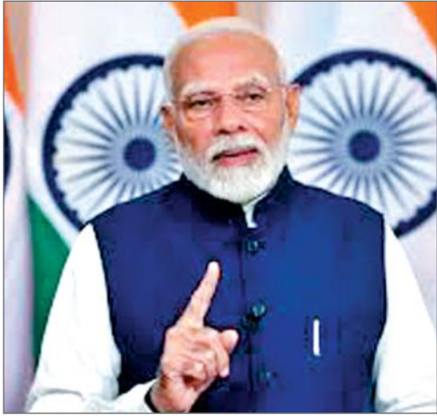
मोदी द्वारा मोटापे के खिलाफ शुरू किए गए अभियान से जुड़कर खुश हैं। मुख्यमंत्री ने प्रधानमंत्री के अभियान से जुड़ने के लिए 10 लोगों को नामित किया। अब्दुल्ला ने अपने एक्स हैडल पर लिखा, मैं प्रधानमंत्री नरेन्द्र मोदी द्वारा मोटापे के खिलाफ शुरू किए गए अभियान से जुड़कर बहुत खुश हूँ। उन्होंने कहा कि मोटापे के

नयी दिल्ली। प्रधानमंत्री नरेन्द्र मोदी ने मोटापे के खिलाफ लड़ाई में मदद के लिए जम्मू कश्मीर के मुख्यमंत्री उमर अब्दुल्ला, उद्योगपति आनंद महिंद्रा और अभिनेता मोहनलाल सहित विभिन्न क्षेत्रों के 10 लोगों को नामित किया। इससे एक दिन पहले प्रधानमंत्री मोदी ने लोगों से मोटापे से बचने के लिए कदम उठाने का आह्वान किया था। प्रधानमंत्री ने सोशल मीडिया वॉक्स पर पोस्ट किया, मैं मोटापे के खिलाफ लड़ाई को मजबूत करने और भोजन में तेल की खपत को कम करने के बारे में जागरूकता फैलाने के लिए कुछ लोगों को नामित करना चाहूंगा। मैं उनसे यह भी अनुरोध करता हूँ कि वे भी आगे ऐसे 10 और लोगों को नामित करें ताकि हमारा आंदोलन बड़ा हो सके। मोदी ने जिन अन्य हस्तियों को नामित किया है उनमें भोजपुरी गायक-अभिनेता निरहुआ, निशानेबाज मनु भाकर, भारतीयोत्क मीराबाई चानू, इंफोसिस के सह-संस्थापक नंदन नीलेकणि, अभिनेता आर माधवन, गायिका श्रेया घोषाल और सामाजिक कार्यकर्ता एवं सांसद सुधा मूर्ति के नाम शामिल हैं। मोटापे के खिलाफ लड़ाई की जोरदार वकालत करते हुए प्रधानमंत्री मोदी ने रविवार को अपने मन की बात कार्यक्रम में लोगों से भोजन में कम तेल का उपयोग करने और 10 अन्य लोगों को यह चुनौती देने का आग्रह किया था। उमर अब्दुल्ला ने कहा कि वह प्रधानमंत्री नरेन्द्र