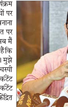
उन्होंने कहा एक अभिनेता के तौर पर मैं एक समय में एक ही फिल्म करता हूँ और मैं इससे खुश हूँ। लेकिन एक निर्माता के रूप में, मैं ज्यादा फिल्में बनाना चाहता हूँ। अगले महीने मैं 60 साल का हो जाऊंगा और आने वाले 10-15 वर्षों तक मैं ज्यादा काम करना चाहता हूँ, नयी प्रतिभाओं को अवसर देना चाहता हूँ। रंग दे बसंती, दिल चाहता है, लगान और 3 इडियट्स जैसी फिल्मों के लिए मशहूर आमिर ने कहा कि हिंदी फिल्म उद्योग में लेखकों को अधिक पहचान और समर्थन देने की

मुंबई। बॉलीवुड अभिनेता आमिर खान ने शनिवार को कहा कि वह महाकाव्य महाभारत को बड़े पैर पर पेश करने के अपने सपने को साकार करने की दिशा में सक्रिय रूप से काम कर रहे हैं। एबीपी नेटवर्क के आईडियाज ऑफ इंडिया 2025 कार्यक्रम में आमिर ने यह भी कहा कि वह बच्चों पर केंद्रित फिल्मों और कार्यक्रम अधिक बनाना चाहते हैं। अभिनेता ने कहा महाभारत पर फिल्म बनाना मेरा सपना है। शायद अब मैं इस सपने के बारे में सोच पाऊंगा। देखते हैं कि इसमें मेरा कोई किरदार होगा या नहीं। मुझे बच्चों से जुड़ा कंटेंट बनाने में भी दिलचस्पी है। भारत में हम बच्चों के लिए कम कंटेंट बनाते हैं। आमतौर पर हम विदेश के कंटेंट डब करके रिलीज करते हैं। मैं बच्चों पर केंद्रित कहानियाँ बनाना चाहता हूँ।