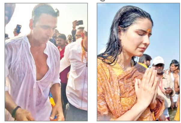
लगाई। संगम में स्नान के बाद अक्षय कुमार ने कहा, मैंने खुब आनंद लिया। इस बार की व्यवस्था बहुत शांतदार है। मैं मुख्यमंत्री योगी आदित्यनाथ को धन्यवाद देना चाहता हूँ कि उन्होंने इतनी बेहतरीन व्यवस्था ...शेष पृष्ठ 14 पर

विशेष संवाददाता महाकुंभ नगर। विश्व के सबसे बड़े आध्यात्मिक समगम प्रयागराज महाकुंभ में आम श्रद्धालुओं के साथ ही बॉलीवुड और राजनीतिक क्षेत्र से लोगों का आना जारी है। सोमवार को बॉलीवुड अभिनेता अक्षय कुमार, अभिनेत्री कैटरिना कैफ और अभिनेत्री सोनाली बेंद्रे ने संगम में डूबकी लगाई। राजनीतिक क्षेत्र से महाराष्ट्र के उपमुख्यमंत्री एकनाथ शिंदे और पर्यावरण मंत्री पंकजा गोपीनाथ मुंडे ने संगम में स्नान किया। इनके अलावा, मुख्य निर्वाचन आयुक्त ज्ञानेश कुमार ने परिवार के साथ संगम में डूबकी