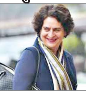
कि यह मेरा कर्तव्य है कि मैं आपको अपने निर्वाचन क्षेत्र में चूरलमाला और मुंडकई के लोगों की दुर्दशा से अवगत कराऊं। यह वास्तव में हृदयविदारक है कि एक भयानक त्रासदी से उनका जीवन और आजीविका के नष्ट होने के छह महीने बाद भी वे अपने जीवन को फिर से पट्टी पर लाने की कोशिश में अकल्पनीय कठिनाइयों का सामना कर रहे हैं। उन्होंने भूस्खलन से हुई तबाही का उल्लेख करते हुए कहा कि केरल के सांसदों के लगातार आग्रह के बाद केंद्र सरकार ने हाल ही में तबाही के पीड़ितों के लिए 529.50 करोड़ रूप के राहत पैकेज की घोषणा की है जो कि अपर्याप्त है। प्रियंका गांधी का कहना था, यह पैकेज दो शतों के साथ है। पहली शर्त है कि जो धनराशि वितरित की जाएगी, वो अनुदान के रूप में नहीं, बल्कि ऋण के रूप में दी जाएगी।

नयी दिल्ली। कांग्रेस महासचिव प्रियंका गांधी वादा ने सोमवार को प्रधानमंत्री नरेन्द्र मोदी को पत्र लिखकर आग्रह किया कि वायनाड भूस्खलन त्रासदी को लेकर घोषित राहत पैकेज को अनुदान में बदल जाए तथा इसके बियान्वयन की अवधि बढ़ाई जाए। उन्होंने यह भी कहा कि 529.50 करोड़ का राहत पैकेज पर्याप्त नहीं है तथा इस त्रासदी को राष्ट्रीय आपदा घोषित नहीं करने से वहां के लोगों में निराशा है। वायनाड के मुंडकई और चूरलमाला क्षेत्र में 30 जुलाई 2024 को हुए भूस्खलन में 200 से अधिक लोगों की मौत हो गई थी और कई अन्य लोग घायल हुए थे। इस आपदा ने इन दोनों क्षेत्रों को लगभग संपूर्ण तरह से तबाह कर दिया था। वायनाड से लोकसभा सदस्य प्रियंका गांधी ने पत्र में कहा कि वायनाड की सांसद के रूप में मुझे लगा