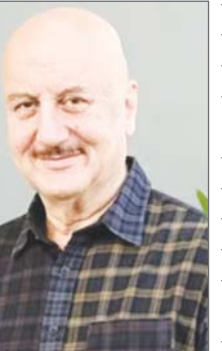
सामग्री के लिए डिजिटल मिलिनेशन कॉपीराइट समूह (डीएमसीए) नोटिस मिले हैं। खेर बहाल हो में कंगना रनौत निर्देशित फिल्म इमरजेंसी में नजर आए थे।

नयी दिल्ली। सोशल मीडिया मंच एक्स (पूर्व में ट्विटर) के नियमों और अभिनेता अनुपम खेर के खाते को निलंबित कर दिया गया। खेर ने कहा है कि वह यह जानना चाहते हैं कि उनका खाता आखिर क्यों निलंबित किया गया और किस पोस्ट ने नियमों का उल्लंघन कर दिया। हालांकि अब उनका खाता बहाल कर दिया गया है। खेर 2007 से इस मंच का इस्तेमाल कर रहे हैं, उन्होंने कहा कि जब उन्हें इस संबंध में सूचना प्राप्त हुई तो वह हैरान रह गए। यह स्पष्ट नहीं है कि उनका खाता कब निलंबित किया गया था। खेर ने पोस्ट में लिखा, प्रिय एक्स। भले ही मेरा खाता बहाल हो गया है, लेकिन इसे बंद देखकर मुझे आश्चर्य हुआ। मैं सितंबर 2007 से इस मंच पर हूँ। हमेशा