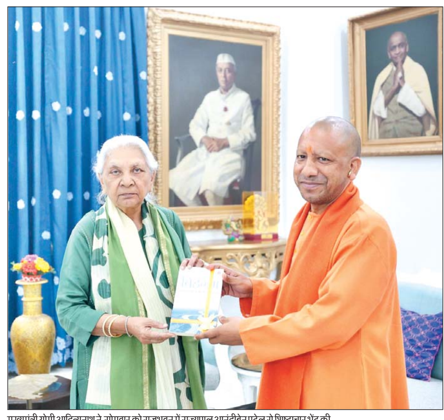
मुख्यमंत्री योगी आदित्यनाथ ने सोमवार को राजभवन में राज्यपाल आनंदीबेन पटेल से शिष्टाचार भेंट की

पर पहुंचे और राहत कार्य का नेतृत्व किया। उनकी त्वरित कार्रवाई से बड़ी जनहानि टल गई। इन दोनों घटनाओं में किसी भी प्रकार की जनहानि नहीं हुई। फायर सर्विस की तत्परता के कारण आग पर तुरंत काबू पाया जा सका। उल्लेखनीय हो कि गत मकर संक्रान्ति में कुंभ में आग लगने की घटना के बाद मेला प्रशासन पूरी सतर्कता बरत रहा है। सोमवार को लगी आग लगने के तुरंत बाद फायर ब्रिगेड ने पहुंचकर आग पर काबू पा लिया। त्वरित कार्रवाई के कारण कोई जनहानि नहीं हुई।