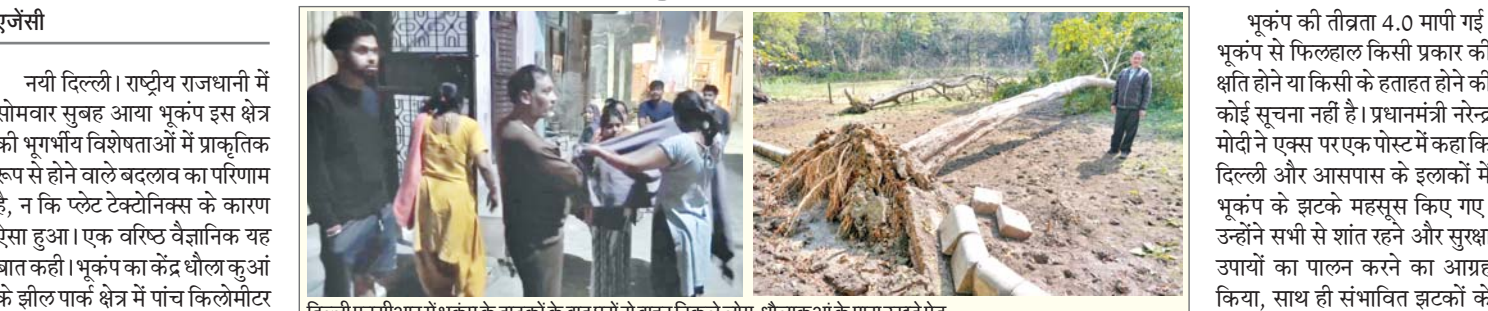
दिल्ली एनसीआर में भूकंप के झटकों के बाद घरों से बाहर निकले लोग, धौलाकुआं के पास उखड़े पेड़

प्रधानमंत्री नरेंद्र मोदी ने लोगों से सुरक्षा उपायों का पालन करने का किया आग्रह