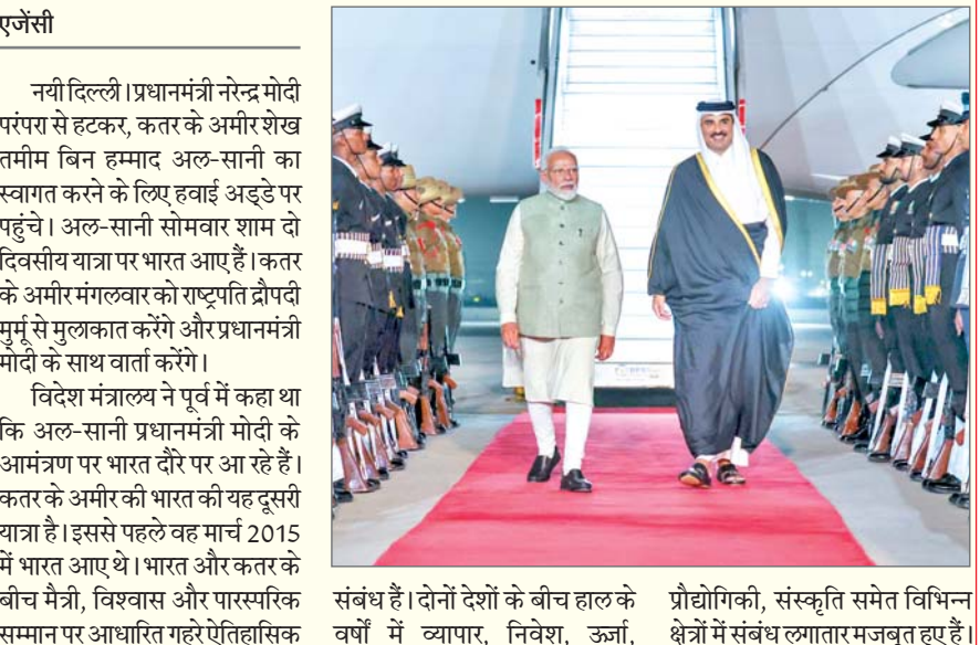
एजेंसी नयी दिल्ली। प्रधानमंत्री नरेन्द्र मोदी परंपरा से हटकर, कतर के अमीर शेख तमीम बिन हम्माद अल-सानी का स्वागत करने के लिए हवाई अड्डे पर पहुंचे। अल-सानी सोमवार शाम दो दिवसीय यात्रा पर भारत आए हैं। कतर के अमीर मंगलवार को राष्ट्रपति द्रौपदी मुर्मू से मुलाकात करेंगे और प्रधानमंत्री मोदी के साथ वार्ता करेंगे।

प्रधानमंत्री मोदी ने हवाई अड्डे पर अमीर शेख तमीम की अगवानी की