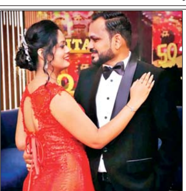
इसमें कार्ड, गिफ्ट, टैडी, आउटिंग के बाद कैडल नाइट डिनर भी शामिल है।

शॉपिंग संग डिनर भी: राजधानी के सभी शॉपिंग मॉल्स में यंगस्टर्स और कपल्स ने अपने ही अंदाज में वैलेंटाइन डे सेलिब्रेट किया। इस दौरान न सिर्फ उन्होंने शॉपिंग की बल्कि अपने पसंदीदा व्यंजनों का भी लुत्फ उठाया। दूसरी ओर कई यंगस्टर्स ने वैलेंटाइन डे राजधानी के आउटर एरिया में जाकर सेलिब्रेट किया। ऐसा करने वाले लोगों की पहली पसंद नवाबगंज पक्षी विहार रहा। वहीं, कई यंगस्टर्स ने आउटर स्थित ढाबों पर अपने पार्टनर संग जाकर वैलेंटाइन डे मनाया।