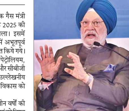
पेट्रोलियम एवं प्राकृतिक गैस मंत्री हरदीप सिंह पुरी

लखनऊ। पेट्रोलियम एवं प्राकृतिक गैस मंत्री हरदीप सिंह पुरी ने भारत ऊर्जा सप्ताह 2025 की अभूतपूर्व सफलता पर प्रकाश डाला। इसमें प्रतिभागियों और प्रदर्शकों की संख्या में अभूतपूर्व वृद्धि हुई तथा तकनीकी शोध-पत्र प्रस्तुत किये गये। उन्होंने कहा कि इस आयोजन ने पेट्रोलियम, प्राकृतिक गैस, हरित ऊर्जा, जैव ईंधन और सीबीजी सहित विभिन्न क्षेत्रों को शामिल करके उल्लेखनीय रूप से अपेक्षाओं से अधिक अभिनव विकास को दर्शाया है। पुरी ने इस बात पर जोर दिया कि तीन वर्षों की अल्पावधि में ही भारत ऊर्जा सप्ताह ने स्वयं को विश्व के दूसरे सबसे बड़े ऊर्जा मंच के रूप में स्थापित कर लिया है। इसका चौथा संस्करण गोवा में आयोजित किया जाएगा। भारत ऊर्जा सप्ताह 2025 ने केवल नेटवर्किंग प्लेटफॉर्म के रूप में काम करने के बजाय