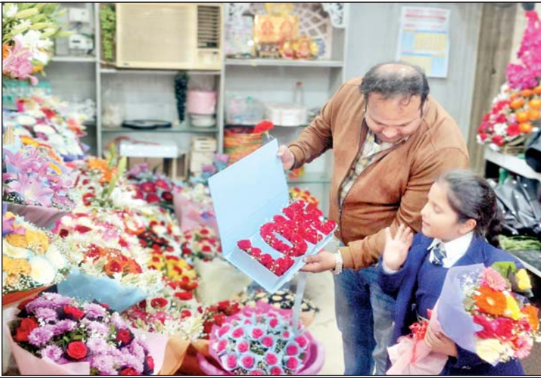
फूल की दुकान पर बुके पसंद करती बच्ची