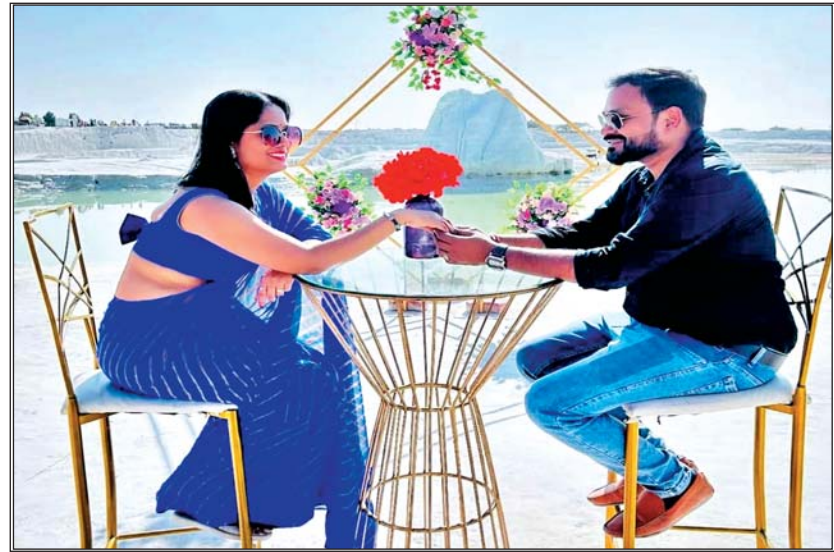
वैलेंटाइन डे पर फूल का गुलदस्ता देते प्रेमी जोड़े