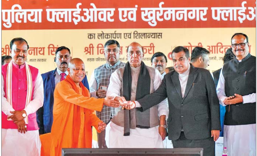
राजधानी लखनऊ में परियोजनाओं का लोकार्पण व शिलान्यास करते रक्षामंत्री राजनाथ सिंह, मुख्यमंत्री योगी आदित्यनाथ व नितिन गडकरी

लखनऊ। केंद्रीय मंत्री नितिन गडकरी ने उत्तर प्रदेश के लिए 9,000 करोड़ रुपये लागत की नई सड़क परियोजनाओं की घोषणा की। इसमें प्रयागराज-वाराणसी 125 किमी हार्ड-स्पीड कॉरिडोर (12,000 करोड़ रुपये), आगरा-अलीगढ़ 65 किमी सड़क, बदरू-बरेली 39 किमी सड़क, रायबरेली-जौनपुर सड़क और कई अन्य सड़कें शामिल हैं। उन्होंने बताया कि वाराणसी से कोलकाता और गोरखपुर से सिलीगुड़ी तक नई सड़क परियोजनाएं जल्द ही शुरू की जाएंगी। उन्होंने बताया कि राजधानी लखनऊ में 1000 करोड़ की परियोजनाओं का शिलान्यास व लोकार्पण किया। इस अवसर पर