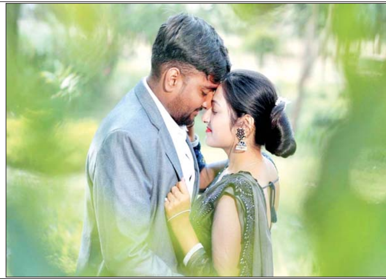
वैलेंटाइन डे पर प्यार का इजहार करते प्रेमी जोड़े