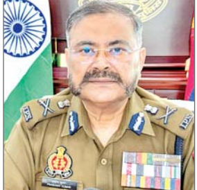
पुलिस महानिदेशक प्रशांत कुमार

लखनऊ। उत्तर प्रदेश पुलिस ने प्रयागराज में जारी महाकुम्भ के बारे में गलत एवं भ्रामक सूचना प्रसारित करने के आरोप में पिछले महीने 53 सोशल मीडिया अकाउंट के खिलाफ कानूनी कार्रवाई शुरू की। मुख्यमंत्री योगी आदित्यनाथ द्वारा फर्जी खबरों पर लगातार लगे के निर्देश के बाद यह कार्रवाई की गई। वरिष्ठ अधिकारियों के अनुसार, अधिकारियों ने कई भ्रामक पोस्ट की पहचान की। इसमें पुराने वीडियो भी शामिल हैं, जिन्हें गलत तरीके से इस आयोग से जोड़ा गया। पुलिस महानिदेशक प्रशांत कुमार ने बृहस्पतिवार शाम को एक बयान में कहा कि विभाग ने एक व्यापक रणनीति