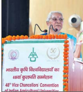
भारतीय कृषि विवि विद्यालयों का 48वाँ कुलपति सम्मेलन।

अयोध्या। अयोध्या एक जनपद ही नहीं बल्कि करोड़ों भारतीयों की श्रद्धा का स्थल है। शहरों में रहने वाले ऐसे पर्यटक जो ग्रामीण जीवन के बारे में नहीं जानते वे गांव की परंपराओं संस्कृति और रीति रिवाज में भाग लेकर ग्रामीण जीवन के बारे में जान सकते हैं। महाराष्ट्र कृषि पर्यटन को बढ़ावा देने वाला पहला राज्य है जहां सतारा, पुणे, नागपुर और नासिक में कई सफल एग्री टूरिज्म केंद्र विकसित किए गए हैं। उत्तर प्रदेश में कृषि का एक मजबूत आधार है और यहाँ एग्री टूरिज्म को बढ़ावा देकर पर्यटकों को प्राकृतिक सौंदर्य प्रदान किया जा सकता है। विश्वविद्यालय शोध प्रशिक्षण, जागरूकता नीति निर्माण और तकनीकी सहायता प्रदान कर किसानों को सशक्त बना सकते हैं। कृषि विश्वविद्यालयों को एग्री टूरिज्म केंद्र के रूप में विकसित कर सकते हैं जहां छात्र किसान और आम जनता