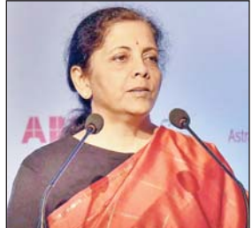
राज्यों द्वारा ली जा रही उधारी के कारण व्याज का बोझ एक समस्या है। उन्होंने कहा कि इससे उबरने के लिए बुद्धिमत्ता से राजकोषीय प्रबंधन करना आवश्यक उपाय है। वित्त मंत्री ने कहा कि सरकार ने इस बार बजट इस प्रकार बनाया है, जिससे विकास को गति मिल सके, समावेशी विकास को हासिल