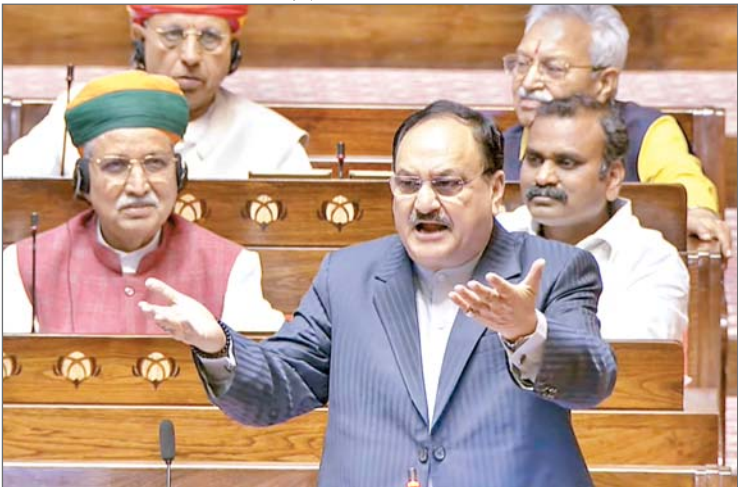
आसन की ओर से अपना पक्ष और चिंताओं को रखने का हर मौका दिए जाने के बाद विपक्ष का व्यवहार दर्शाता है कि वे राजनीतिक लाभ लेने की कोशिश कर रहे थे। उन्होंने कहा, विपक्ष ने बहुत गैर-जिम्मेदाराना व्यवहार किया है। इसकी निंदा होनी चाहिए। यह तुट्टीकरण की राजनीति है। वे देश को कमजोर करने के लिए। और सबसे बड़ा सवाल है कि कुछ लोग देश को तोड़ने की

नयी दिल्ली। राज्यसभा के नेता जेपी नड्डा ने बृहस्पतिवार को उच्च सदन से विपक्ष के बहिर्गमन को राष्ट्र विरोधी गतिविधियों को प्रोत्साहित करने का एक माध्यम करार दिया और आरोप लगाया कि कांग्रेस सहित अन्य विपक्षी दल उन लोगों के हाथ मजबूत कर रहे हैं जो देश को तोड़ने की कोशिश कर रहे हैं। उन्होंने वक्फ संशोधन विधेयक, 2024 पर संयुक्त संसदीय समिति (जेपीसी) की रिपोर्ट पेश किए जाने के खिलाफ विपक्ष के विरोध के दौरान आसन के पास आने वाले सदस्यों को सदन से एक दिन के लिए निर्लेखित किए जाने की भी मांग की।