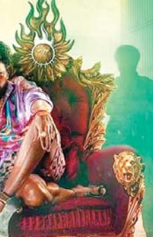
असुर थे हुआ कि एक्शन फिल्मों में कम होने लगीं और लगभग उसी समय अमिताभ बच्चन ने करीब पांच साल का लंबा ब्रेक लिया। इंडस्ट्री म्यूजिकल फिल्मों की ओर बढ़ने लगी, जैसे 'मैंने प्यार किया' और 'दिलवाले दुल्हनिया ले जायेंगे' और बॉलीवुड अपनी मसाला फिल्मों को भूलने लगा।

मुंबई। फिल्ममेकर रामगोपाल वर्मा ने बॉलीवुड और साउथ इंडस्ट्री के बारे में बात की। उन्होंने कहा कि बॉलीवुड के फिल्म प्रोड्यूसर पुष्पा 2 जैसी फिल्में नहीं बना पाते, क्योंकि वे इस तरह के विचार नहीं रखते। लेकिन साउथ की फिल्मों में हेमेशा अपनी अलग कहानी और सांस्कृतिक शैली के कारण दर्शकों को पसंद आती हैं, जो बॉलीवुड से काफी अलग होती हैं। पिंकविला के साथ बातचीत के दौरान रामगोपाल वर्मा ने कहा कि बॉलीवुड के डायरेक्टर पुष्पा 2 जैसी फिल्में नहीं बना पाते। ऐसा नहीं है कि वे सक्षम नहीं हैं, बल्कि उनकी सोच अलग है। असली फर्म फिल्म निर्माताओं की सोच में है, न कि दर्शकों की पसंद में, क्योंकि हिंदी सिनेमा पहले मसाला फिल्मों पर आधारित था, जैसा कि अमिताभ बच्चन की फिल्मों में देखा जाता है। रामगोपाल वर्मा ने कहा, 'मैं