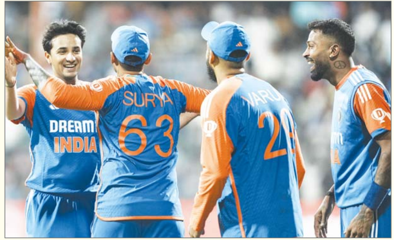
ने 11वें ओवर में ब्रायडन कार्स के खिलाफ एक रन तेज शतक का रिकॉर्ड रोहित शर्मा के नाम है जिन्होंने श्रीलंका के खिलाफ इंदौर में 2017 में 35 गेंद में शतक पूरा किया था। (विस्तृत खबर खेल पृष्ठ पर)

एजेंसी मुंबई। भारत ने पांचवें और अंतिम टी20 अंतरराष्ट्रीय में रविवार को यहां इंग्लैंड को 150 रन से हराकर श्रृंखला 4-1 से जीती। भारत ने पहले बल्लेबाजी करते हुए नौ विकेट पर 247 रन बनाने के बाद इंग्लैंड की पारी को 10.3 ओवर में 97 रन पर खत्म कर दिया। इंग्लैंड की ओर से फिल साल्ट ने 23 गेंद में 55 रन की पारी खेली लेकिन टीम का कोई अन्य बल्लेबाज बड़ा योगदान देने में नाकाम रहा। भारत के लिए मोहम्मद शमी ने तीन जबकि वरुण चक्रवर्ती, शिवम दुबे और अभिषेक शर्मा ने दो-दो विकेट लिए। भारतीय सलामी बल्लेबाज अभिषेक शर्मा ने इंग्लैंड के खिलाफ पांच मैचों की श्रृंखला के आखिरी मुकाबले में रविवार को यहां 37 गेंद में अपना शतक पूरा किया। यह खेल के सबसे छोटे अंतरराष्ट्रीय प्रारूप में भारत के लिए दूसरा सबसे तेज शतक है। उन्होंने 54 गेंद की पारी में 135 रन बनाये। अभिषेक