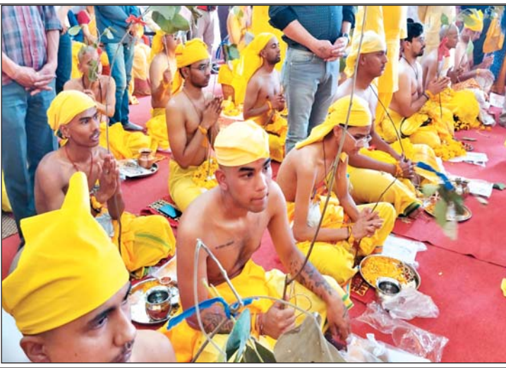
जनेऊ संस्कार में हिस्सा लेते युवक