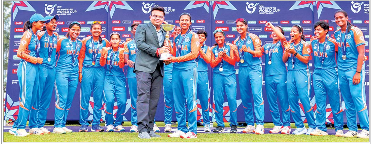
एजेंसी यहां बेहद एकतरफा मुकाबले में दक्षिण अफ्रीका को नौ विकेट से रौंदकर लगातार दूसरी बार अंडर-19 महिला टी20 विश्व कप खिताब जीत लिया। फाइनल तक के अपने सफर के दौरान दक्षिण अफ्रीका ने आसान जीत दर्ज करने वाले भारत ने एक बार फिर दबदबा बनाया और दक्षिण अफ्रीका को 83 रन के लक्ष्य का पीछा करते हुए 52 गेंद शेष रहते 11.2 ओवर में एक विकेट पर 84 रन बनाकर एकतरफा जीत हासिल ... शेष पृष्ठ 14 पर