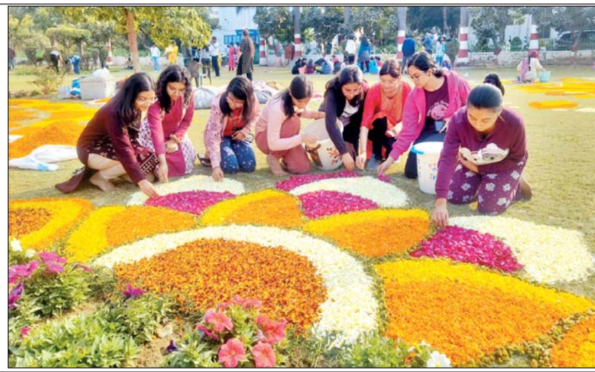
रंगबिरंगी रंगोली सजाती युवतियाँ