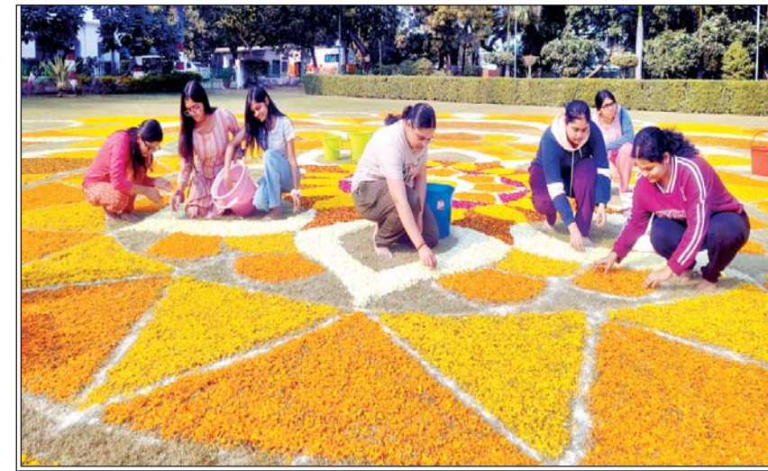
वसंत पंचमी पर फूलों की रंगोली बनाती युवतियाँ