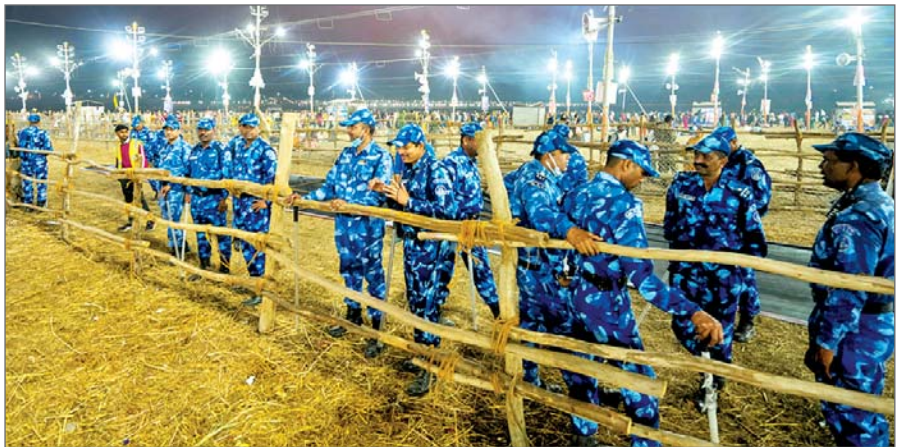
तैयारियों की समीक्षा बैठक में अधिकारियों को शून्य त्रुटि के साथ स्नान संपन्न कराने के निर्देश दिए थे। रविवार की सुबह एडीजी भानु भास्कर मेला प्राधिकरण भवन में स्थित इंटीग्रेटेड कमांड एंड कंट्रोल सेंटर (आईसीसीसी) पहुंचे जहां उन्होंने स्क्रीन पर पूरे मेला क्षेत्र, चौराहों और श्रद्धालुओं से कहा, कि कृपया घाट पर स्नान करने के बाद अनावश्यक ना बैटें और घाट खाली करें जिससे दूसरे श्रद्धालु स्नान कर सकें। घाट पर खाना पीना ना करें और दूसरी जगह जाकर खानपान करें। भानु भास्कर ने सेंटर में पुलिस अधिकारियों को निर्देशित किया कि घाट पर कहीं भी भीड़ रुकने ना पाए और स्नान करने के बाद वहां से अपने गंतव्यों के लिए प्रस्थान करें। संगम स्नान करने के बाद वापस जा रही रूपम चंद्रा (गाजियाबाद निवासी) ने बताया, कि संगम घाट पर स्नान के बाद श्रद्धालुओं को वहां से हटाना जा रहा है। हर तरफ पुलिस के लोग सीटी बजाकर घाट खाली करने के लिए कह रहे हैं। इसलिए हम स्नान के बाद तुरंत वहां से चल दिए। मेला प्रशासन के एक अधिकारी ने ... शेष पृष्ठ 14 पर

विशेष संवाददाता महाकुंभ नगर। महाकुंभ के अंतिम अमृत स्नान पर्व बसंत पंचमी पर मेला प्रशासन और पुलिस को शून्य त्रुटि के साथ सकुशल स्नान संपन्न कराने के मुख्यमंत्री के निर्देश के बाद पुलिस और प्रशासन पूरी तरह से मुस्तैद है और एडीजी भानु भास्कर स्वयं मेला क्षेत्र में भीड़ नियंत्रण व्यवस्था की देखरेख कर रहे हैं। गत मंगलवार देर रात संगम नोज पर घटी भगदड़ की घटना के बाद शनिवार को पहली बार प्रयागराज आए मुख्यमंत्री योगी आदित्यनाथ ने घटनास्थल का निरीक्षण किया था और अस्पताल जाकर घायलों से मिलकर उनका हालचाल जाना था। इस बीच, मुख्यमंत्री ने बसंत पंचमी स्नान के लिए