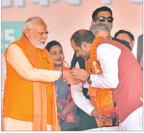
कि यह भारत के इतिहास में उनके लिए सबसे अनुकूल बजट है। प्रधानमंत्री ने दिल्ली विधानसभा के लिए पांच फरवरी को होने वाले मतदान से ठीक तीन दिन पहले राष्ट्रीय प्रगति में मध्यम वर्ग के योगदान की सराहना की और

एजेंसी नयी दिल्ली। दिल्ली विधानसभा चुनाव के लिए प्रचार अपने अंतिम चरण में पहुंचने के बीच प्रधानमंत्री नरेंद्र मोदी ने रविवार को कहा कि केंद्रीय बजट से हर औसत परिवार को खुशी मिली है। उन्होंने इसे भारत के इतिहास में सबसे अधिक मध्यम वर्ग के अनुकूल बजट करार दिया। प्रधानमंत्री ने राष्ट्रीय राजधानी के आरके पुरम में एक चुनावी सभा को संबोधित करते हुए अपना चुनावी नारा मोदी की गारंटी दोहराया और शनिवार को वित्त मंत्री निर्मला सीतारमण द्वारा पेश किए गए बजट में मध्यम वर्ग के लिए किए गए प्रावधानों का जिक्र किया। उन्होंने कहा भारत की आजादी के बाद से 12 लाख रुपये तक की वार्षिक आय वालों को इतनी बड़ी राहत कभी नहीं मिली। मध्यम वर्ग कह रहा है