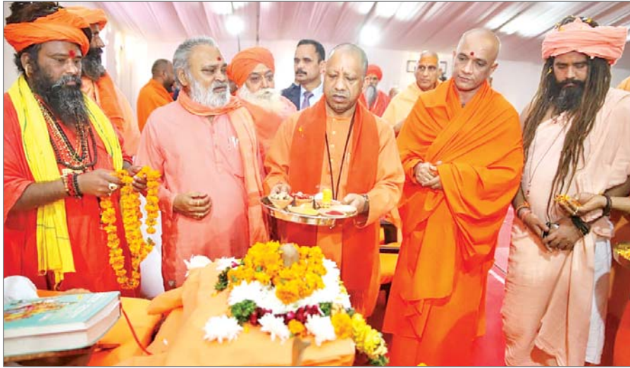
महाकुंभ में साधु-संतों के साथ पूजा-अर्चना करते मुख्यमंत्री योगी आदित्यनाथ

महाकुंभनगर। मुख्यमंत्री योगी आदित्यनाथ ने शनिवार को महाकुंभ मेले को एकता का संदेश देने वाला तथा देश और दुनिया का सबसे बड़ा आयोजन बताते हुए कहा कि सनातन धर्म एक विराट वट वृक्ष की तरह है। उन्होंने कहा कि सनातन धर्म एक विराट वट वृक्ष है और इसकी तुलना किसी झाड़ू और झंखाड़ से नहीं होनी चाहिए। एक बयान के मुताबिक प्रयागराज दौरे पर आए मुख्यमंत्री ने शनिवार को अखिल भारतीय अवधूत भेष बारह पंथ-योगी महासभा द्वारा आयोजित कार्यक्रम में हिस्सा लिया। योगी ने कहा कि दुनिया के अंदर अन्य संप्रदाय हो सकते हैं, ...शेष पृष्ठ 14 पर