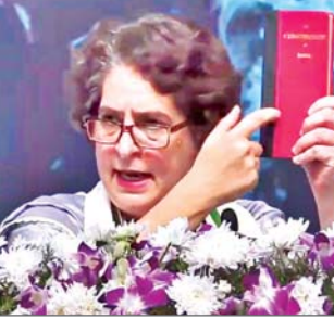
खरगे, कर्नाटक के मुख्यमंत्री सिद्धरमैया, उप मुख्यमंत्री डीके शिवकुमार, कांग्रेस के संघटन महासचिव के.सी. वेणुगोपाल तथा पार्टी के कई अन्य नेता मौजूद थे। राहुल गांधी अरक्वथ होने के कारण इस रैली में शामिल नहीं हो सके। प्रियंका गांधी ने

बेलगावी (कर्नाटक)। कांग्रेस महासचिव प्रियंका गांधी वादा ने मंगलवार को भारतीय जनता पार्टी (भाजपा) और राष्ट्रीय स्वयंसेवक संघ (आरएसएस) पर तीखा हमला बोला और आरोप लगाया कि दोनों की विचारधारा कार्यों की है, जबकि मुख्य विपक्षी दल देश के लिए मर-मिटने का विचार रखता है। उन्होंने यहां जय बापू, जय भीम, जय संविधान रैली को संबोधित करते हुए यह दावा भी किया कि केंद्र सरकार लोकसभा में नेता प्रतिपक्ष राहुल गांधी से डरती है क्योंकि वह संविधान की लड़ाई लड़ रहे हैं। इस सभा में कांग्रेस अध्यक्ष मल्लिकार्जुन