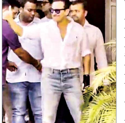
गई है। सैफ अब सतगुरु शरण अपार्टमेंट में नहीं रहेंगे, जहां उन पर हमला किया गया। पास ही फॉर्च्यून हाइट्स इमारत में उनका सामान शिफ्ट किया गया है, ये एक्टर का दफ्तर है। सैफ अली खान मंगलवार की शाम 4 बजकर 30 मिनट पर अस्पताल से डिस्चार्ज

मुंबई। लीलावती अस्पताल से घर पहुंचने में सैफ अली खान को करीब 15 मिनट लगे। वे कार से उतरकर बिल्डिंग के अंदर गए। एक्टर सैफ अली खान को 5 दिन बाद मंगलवार को लीलावती अस्पताल से डिस्चार्ज कर दिया गया है। 15 जनवरी की रात करीब ढाई बजे उन पर चाकू से हमला किया गया था। सैफ के गले और रीढ़ में गंभीर चोटें आई थीं। इसके बाद सैफ आंठो से लीलावती अस्पताल पहुंचे थे, जहां उनकी सर्जरी हुई और इलाज चला। सैफ अली खान को लीलावती अस्पताल से घर पहुंचने में