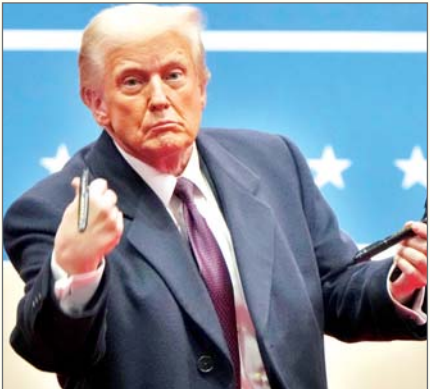
महिलाओं को बताने वाली बाइनरी संरचना। आदेश के तहत, प्रवासियों और बलात्कार पीड़ितों के लिए संघीय जेलों और आश्रयों को आदेश में परिभाषित लिंग के आधार पर अलग किया जाना है। संघीय कर्दादाओं के पैसे का इस्तेमाल परिवर्तन सेवाओं के लिए नहीं किया जा सकता था। संघीय जेल के कुछ कैदियों ने लिंग परिवर्तन की सर्जरी करवाई है और कई ने संघीय निधियों से हार्मोन थेरेपी जैसे उपचार कराए हैं।

वाशिंगटन। अमेरिका के राष्ट्रपति डोनाल्ड ट्रंप ने सोमवार को कुछ शासकीय आदेशों पर हस्ताक्षर किए, जिनमें ट्रांसजेंडर लोगों के लिए सुरक्षा वापस ले ली गई और संघीय सरकार के भीतर विविधता, समानता और समावेशन कार्यक्रमों को समाप्त कर दिया गया। ट्रंप ने अपने दूरघाटन भाषण में इसे सार्वजनिक और निजी जीवन के हर पहलू में जाति और लिंग को सामाजिक रूप से नियोजित करने के प्रयासों को समाप्त करने के कदम के रूप में वर्णित किया। संघीय नीति के लिए दोनों बड़े बदलाव हैं और ट्रंप के प्रचार अभियान के दौरान किए गए वादों के अनुरूप हैं।