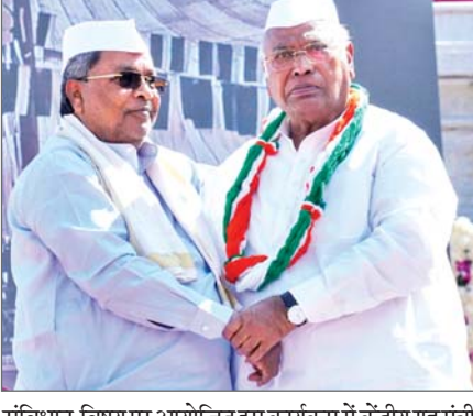
संविधान विषय पर आयोजित इस कार्यक्रम में केंद्रीय गृह मंत्री अमित शाह पर निशाना साधा गया और उन पर हाल ही में राज्यसभा में भारतीय संविधान और इसके निर्माता बी.आर. अंबेडकर का अपमान करने का आरोप लगाया गया। केंद्रीय मंत्री शाह ने आरोपों को दूध बताकर खारिज कर दिया था।

बेलगावी (कर्नाटक)। कांग्रेस अध्यक्ष मल्लिकार्जुन खरगे ने मंगलवार को लोकसभा सदस्य प्रियंका गांधी वादा की तुलना अंग्रेजों के खिलाफ लड़ने वाली विभूतियों - किचूर रानी चैनम्मा और झांसी की रानी लक्ष्मी बाई से की और कहा कि वह स्त्री शक्ति का प्रतिनिधित्व करती हैं। उन्होंने राहुल गांधी को युवा शक्ति का प्रतीक बताया। यहां गांधी भारत कार्यक्रम को संबोधित करते हुए खरगे ने कहा कि कांग्रेस ने 1924 में महात्मा गांधी की अध्यक्षता में बेलगावी में हुए कांग्रेस के एक मात्र अधिवेशन के 100 साल पूरे होने के उपलक्ष्य में यह कार्यक्रम आयोजित किया है। उन्होंने कहा, अगर कोई किचूर की चैनम्मा हैं तो प्रियंका गांधी हैं। अगर कोई झांसी की रानी हैं तो प्रियंका गांधी हैं। वह बहुत मजबूत हैं। राजीव गांधी की हत्या के बाद उन्होंने ही परिवार को संभाला। हमारे पास स्त्री शक्ति (प्रियंका गांधी) और युवा शक्ति राहुल गांधी हैं। जय बापू, जय भीम, जय