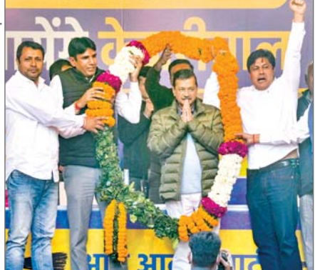
महिलाओं को 2,500 रुपये मासिक सहायता, प्रत्येक गर्भवती महिला को 21,000 रुपये की सहायता, 500 रुपये में एलपीजी (घरेलू गैस) सिलेंडर और वरिष्ठ नागरिकों को 2,500 रुपये पेंशन देने का वादा

किया था। पूर्व केंद्रीय मंत्री और वरिष्ठ भाजपा नेता अनुराग ठाकुर ने मंगलवार को जारी पार्टी के दूसरे घोषणापत्र में कई महत्वाकांक्षी योजनाओं की घोषणा की जिनमें सरकारी संस्थानों में किंडरगार्टन से लेकर स्नातकोत्तर स्तर तक जरूरतमंद छात्रों के लिए मुफ्त शिक्षा शामिल है। घोषणापत्र में संघ लोक सेवा आयोग (यूपीएससी) और राज्य सिविल सेवा (पीसीएस) जैसी प्रतियोगी परीक्षाओं की तैयारी कर रहे छात्रों को वित्तीय मदद देने का भी वादा किया गया है जिसके तहत दो प्रयासों तक 15,000 रुपये की मदद दी जाएगी। केजरीवाल ने भाजपा को अपने घोषणापत्र में सरकारी संस्थानों में जरूरतमंद छात्रों को मुफ्त शिक्षा प्रदान किए जाने की बात लिखने को लेकर निशाना साधा और आरोप लगाया कि इसका मतलब है कि भाजपा सभी छात्रों के लिए यह सुविधा बंद करने की योजना बना रही है।