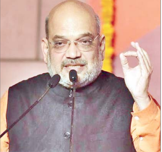
सहित बड़ी संख्या में हथियार, गोला-बारूद और बारूदी सुरंग बरामद किए गए। मुख्यमंत्री विष्णुदेव साय ने सुरक्षा बलों की सराहना करते हुए कहा कि डबल इंजन सरकार (केंद्र और राज्य

हमारे सुरक्षा बलों ने नक्सल मुक्त भारत के निर्माण की दिशा में बड़ी सफलता हासिल की है। सीआरपीएफ, एसओजी ओडिशा और छत्तीसगढ़ पुलिस ने ओडिशा-छत्तीसगढ़ सीमा पर एक संयुक्त अभियान में 16 नक्सलियों को मार गिराया। एक अधिकारी ने कहा कि छत्तीसगढ़-ओडिशा सीमा पर मैमपुर थाना क्षेत्र के अंतर्गत जंगल में सोमवार देर रात और मंगलवार की सुबह हुई ताजा गोलीबारी में माओवादियों को मार गिराया गया। वहीं सोमवार को अभियान के दौरान दो महिला नक्सलियों को मार गिराया गया और मुठभेड़ स्थल से एक सेलफ-लोडिंग राइफल