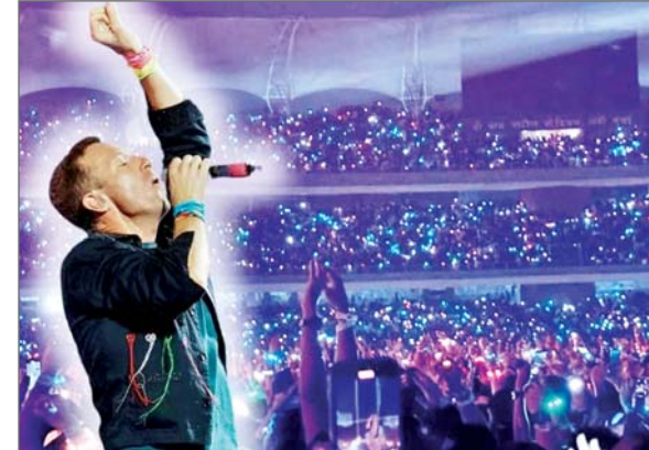
को शेयर करते हुए क्रिस मार्टिन को थैंक्स कहा। उन्होंने सोशल मीडिया पर लिखा है- सितारों को देखो, कैसे वो आपके लिए चमक रहे हैं। क्रिस मेरे हार्ट, तुमने मुझे ख़ास फील करवाया है। आपको प्यार और आपकी टीम को बड़ा सा हा। आप करोड़ों में एक हैं मेरे दोस्त, इंडिया आपसे प्यार करता है। इसके साथ ही शाहरुख ने वायरल वीडियो पर लिखा है- क्रिस मार्टिन फॉरएवर एंड एवर। शाहरुख खान और क्रिस मार्टिन यह प्यार भरा रिश्ता है, जिसके फेंस को भी काफी खुशी हुई है। फेंस ने भी शाहरुख और क्रिस मार्टिन को लेकर अलग-अलग तरह के रिप्लेक्स सोशल मीडिया पर दिए हैं।

मुंबई। रविवार को कोल्डप्ले ने मुंबई के डीवाई पाटिल स्टेडियम में अपना दूसरा शो आयोजित किया। इस दौरान क्रिस मार्टिन ने अपने प्रदर्शन के दौरान शाहरुख खान को विशेष रूप से बधाई दी। उन्होंने शाहरुख खान को हमेशा के लिए याद किया जाने वाला बताया। सोशल मीडिया पर वह वीडियो खूब वायरल हो रहा है। जिस पर शाहरुख ने अपनी प्रतिक्रिया दी है। क्रिस मार्टिन ने कॉन्सर्ट शुरू करने से पहले एक म्यूजिक प्ले किया और कहा- शाहरुख खान फॉरएवर। इतना सुनते ही भीड़ क्रेजी हो गई और खुशियों के मारे चिल्लाने लगी। स्टेडियम में मौजूद प्रशंसकों ने अपने फोन की लाइटें चमकाते हुए हटिंग की। सोशल मीडिया पर वीडियो खूब वायरल हो रहा है। शाहरुख खान की बेटी सुहाना खान भी अपने दोस्तों के साथ कॉन्सर्ट देखने गई थीं। सोमवार को शाहरुख खान ने वायरल वीडियो