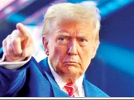
ट्रंप राज के आगाज से पहले ही हिंडनबर्ग की दुकान बंद हो गयी है। टूटो की विदाई से भी भारत को बड़ी राहत मिली है।

संयुक्त राज्य अमेरिका में शपथ ग्रहण के साथ डोनाल्ड ट्रंप राज का आगाज हो गया है। जो बाइडेन अब अमेरिका के पूर्व राष्ट्रपति हो चुके हैं लेकिन उनके कार्यकाल में जिस तरह से अफगानिस्तान, पश्चिम एशिया और रूस-यूक्रेन युद्ध के दौरान अमेरिका की भूमिका रही, उस पर तमाम सवाल उठाये गये। अमेरिका युद्ध रोकने में किसी भी तरह की सक्रिय भूमिका से दूर रहा और कई बार तो ऐसा लगा कि कहीं न कहीं बाइडेन व्हाइट हाउस में बैठकर दुनिया भर में युद्ध और अस्थिरता को हवा दे रहे हैं। बाइडेन के राज में जिस तरह अमेरिकी डीप स्टेट पूरी दुनिया में स्थापित सरकारों के खिलाफ काम करता रहा, उन्हें अस्थिर करता रहा, उसके कारण अमेरिकी न सिर्फ छवि खराब हुई बल्कि बाइडेन प्रशासन इस बात के लिए बदनाम भी हुआ कि अमेरिका पूरी दुनिया में स्थापित सरकारों को अस्थिर करने में लगा हुआ है। शायद यही कारण है कि जब चुनाव में डेमोक्रेट प्रत्याशी कमला हैरिस की हार हुई तो भारत में भी लोगों ने राहत की सांस ली, क्योंकि लोगों को आशंका थी कि अगर कमला हैरिस चुनाव जीतेंगी तो अमेरिकी डीप स्टेट और ताकतवर होगा और इसकी गतिविधियां बढ़ जायेंगी जो कि भारत सहित तीसरी दुनिया के तमाम देशों के हित में नहीं होगा। बाइडेन प्रशासन में अमेरिकी डीप स्टेट ने भारत को भी परेशान करने में कोई कसर नहीं छोड़ी। जॉर्ज सोरोस, हिंडनबर्ग, जस्टिन डूडो, निन्जर और गुरुवर्तवत सिंह