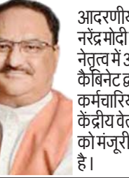
आदरणीय प्रधानमंत्री नरेंद्र मोदी जी के यशस्वी नेतृत्व में आज केन्द्रीय कैबिनेट द्वारा केन्द्रीय कर्मचारियों के लिए एवं केन्द्रीय वेतन आयोग को मंजूरी अभिनन्दनीय है। सीएम योगी.