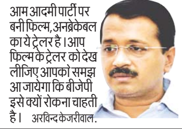
आम आदमी पार्टी पर बनी फिल्म, अनब्रेकेबल का ये ट्रेलर है। आप फिल्म के ट्रेलर को देख लीजिए आपकों समझ आ जायेगा कि बीजेपी इसे क्यों रोकना चाहती है। अरविन्द केजरीवाल.