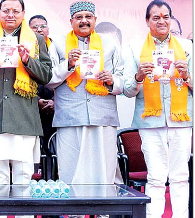
उन्होंने कहा कि यह घोषणा पत्र भाजपा की योजनाओं का दस्तावेज है, जो शहरी विकास, सामाजिक सुरक्षा, मातृशक्ति सशक्तिकरण और युवाओं को कौशल विकास जैसी पहल से जुड़ा है। भाजपा की यह घोषणा पत्र उन सभी समस्याओं को हल करने का वादा करती है, ...शेष पृष्ठ 14 पर

प्रमुख संवाददाता देहरादून। उत्तराखंड में आगामी नगर निकाय चुनाव के मद्देनजर भाजपा ने आज अपना संकल्प पत्र जारी किया। भाजपा ने इस घोषणा पत्र को लेकर अपनी योजनाओं और वादों को जनता के सामने रखा। इस घोषणा पत्र के अंतर्गत 11 नगर निगमों के लिए अलग-अलग संकल्प पत्र तैयार किए गए हैं जबकि सभी नगर निकायों के लिए एक संयुक्त संकल्प पत्र तैयार किया गया है। मुख्यमंत्री धामी ने इस संकल्प पत्र को शहरी विकास के प्रति 'ट्रिपल इंजन' सरकार की प्रतिबद्धता का प्रतीक बताया। मुख्यमंत्री पुष्कर सिंह धामी ने कहा कि यह संकल्प पत्र आने वाले पांच साल तक भाजपा की गारंटी का संकल्प है।