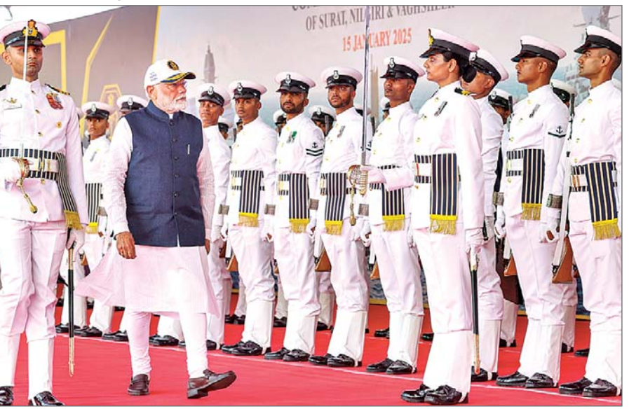
और आज उनकी इस पावन धरती पर 21वीं सदी की नौसेना को सशक्त करने की तरफ एक बड़ा कदम उठाया गया है। उन्होंने कहा 21वीं सदी के भारत का सैन्य सामर्थ्य भी अधिक सक्षम और आधुनिक हो, यह देश की प्राथमिकताओं में से एक है। जल हो, थल हो, नभ हो, गहरे समुद्र हों या फिर असीम अंतरिक्ष हो, हर जगह भारत अपने हितों को सुरक्षित कर रहे हैं। इसके लिए निरंतर सुधार किए जा रहे हैं।

एजेंसी मुंबई। प्रधानमंत्री नरेंद्र मोदी ने बुधवार को कहा कि 21वीं सदी के भारत का सैन्य सामर्थ्य अधिक सक्षम और आधुनिक होना उसकी प्राथमिकताओं में से एक है लेकिन इसका मकसद विस्तारवाद नहीं बल्कि विकासवाद की भावना है। मुंबई स्थित नौसेना डॉकयार्ड में नौसेना के तीन अग्रणी युद्धपोतों आईएनएस सूरत, आईएनएस नीलगिरी और आईएनएस वाघशीर को राष्ट्र को समर्पित करने के बाद प्रधानमंत्री ने अपने संबोधन में कहा कि आज भारत पूरे विश्व और खासकर ग्लोबल साउथ में एक भरोसेमंद और जिम्मेदार साथी के रूप में पहचाना जा रहा है। प्रधानमंत्री ने यह भी कहा कि भारत एक प्रमुख समुद्री शक्ति बन रहा है और दुनिया में एक विश्वसनीय और जिम्मेदार साझेदार के रूप में पहचाना जा रहा है। उन्होंने कहा कि भारत ने हमेशा एक खुले, सुरक्षित, समावेशी और समृद्ध हिंद-प्रशांत क्षेत्र का समर्थन किया है। मोदी ने आज के दिन को भारत की समुद्री विरासत, नौसेना के गौरवशाली इतिहास और आत्मनिर्भर भारत अभियान के लिए बहुत बड़ा दिन करार देते हुए कहा यह पहली बार हो रहा है, जब एक डिस्ट्रॉयर (विध्वंसक), एक फ्रिगेट और एक पनडुब्बी को एक साथ नौसेना के बेड़े में शामिल किया जा रहा है। गर्व की बात है कि ये तीनों मेड इन इंडिया हैं। फ्रिगेट, युद्ध के लिए इस्तेमाल होने वाले जहाज होते हैं। प्रधानमंत्री ने कहा कि छत्रपति शिवाजी महाराज ने नौसेना को नया सामर्थ्य और दृष्टिकोण दिया था