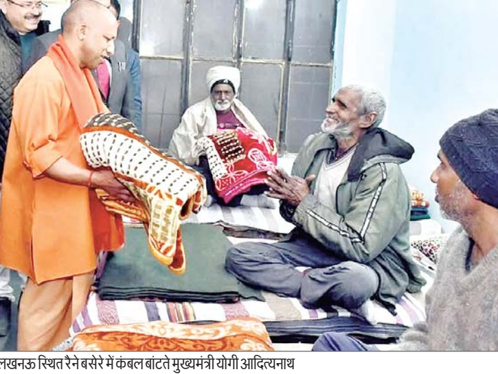
लखनऊ स्थित रैने बसेरे में कंबल बांटते मुख्यमंत्री योगी आदित्यनाथ

विशेष संवाददाता लखनऊ। मुख्यमंत्री योगी आदित्यनाथ ने आगामी 29 जनवरी को मौनी अमावस्या के अवसर पर महाकुंभ में 8-10 करोड़ श्रद्धालुओं के संगम स्नान की संभावना के मद्देनजर अधिकारियों को व्यवस्थाओं को और बेहतर बनाने के निर्देश दिए हैं। सरकार द्वारा जारी एक आधिकारिक बयान के मुताबिक, बुधवार को शासन स्तर के वरिष्ठ अधिकारियों के साथ बीते तीन दिनों की स्थिति की समीक्षा करते हुए मुख्यमंत्री ने कहा कि पौष पूर्णिमा और मकर संक्रांति के दो प्रमुख स्नान पर्वों पर छह करोड़ से अधिक लोगों ने त्रिवेणी स्नान का पुण्य लाभ प्राप्त किया। बयान के मुताबिक, आगामी 29 जनवरी को मौनी अमावस्या के अवसर पर 8-10 करोड़ लोगों के आमनन की संभावना है। ऐसे में व्यवस्थाओं को और बेहतर करने की आवश्यकता है। उन्होंने निर्देश दिए कि रेलवे ...शेष पृष्ठ 14 पर