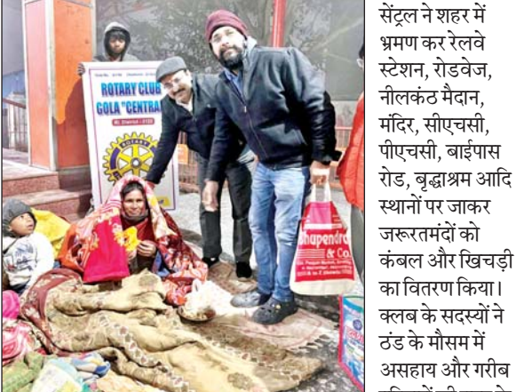
गोला गोकर्णनाथ, खीरी। (वीओएल) रोटरी क्लब गोला

लिप यह विशेष पहल की। कार्यक्रम की शुरूआत क्लब अध्यक्ष