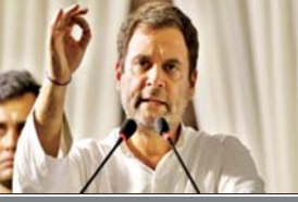
जनसेवक का काम मीनख तलाशना नहीं है, उसे जनता के हित में विकास कार्यों को अंजाम तक पहुंचाना ही होगा।

राहुल गांधी लंबे अरसे से मुखर हैं। सरकार को घेरने का एक भी अवसर वे अपने हाथ से जाने नहीं देते। प्रधानमंत्री नरेंद्र मोदी, भारतीय जनता पार्टी और राष्ट्रीय स्वयंसेवक संघ व कुछ उद्योगपतियों की आलोचना तो जैसे उनके स्वभाव में ही आ गया है। इसके लिए वे बड़े से बड़ा जोखिम लेने को हमेशा तैयार रहते हैं। ऐसानहीं कि वे बर् के छत में हाथ डालने के खतरों से अपरिचित हैं लेकिन विरोधी से प्रशंसा की उम्मीद बेमानी है, वाली बात को वे अक्षरशः चरितार्थ करते रहते हैं। विरोधी को झुकनानहीं चाहिए। डरना नहीं चाहिए लेकिन इसवह मतलब भी नहीं कि आलोचना को बेवजह होवा बनादियाजाए। राहुल गांधी को देर सबेर यह बात समझनी ही होगी। अन्यथा उनकी राजनीतिक परिपक्वता पर अक्सर सवाल उठते रहेंगे। आलोचना बेहद गंभीर विषय है। सतही आलोचना खुद को भी दुखी करती है और दूसरोंको भी जबकि आलोचना मार्गदर्शक की भूमिका अदा करती है। ऐसा न रहा होता तो हमारे मनीषियों ने निंदक को नजदीक रखने की परिकल्पना नहीं की होती। निंदक नियरे राखिए आंगन कुटी