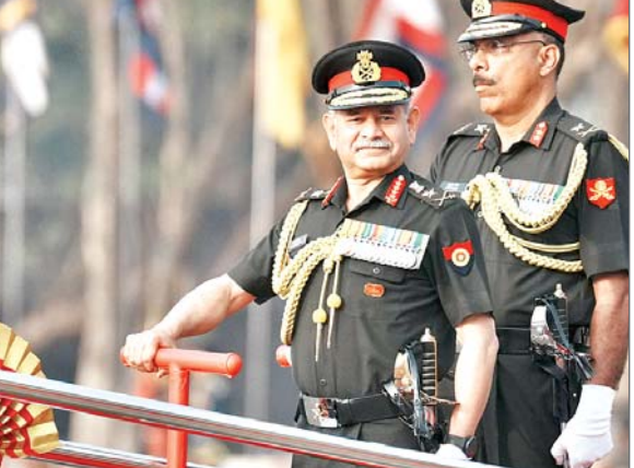
की योजना बना रहे हैं और संभावित आयोजन स्थलों के रूप में गुवाहाटी, जलपुर, जयपुर और भोपाल को चुना गया है। उन्होंने यह भी कहा कि भारतीय सेना में नारी शक्ति महत्वपूर्ण भूमिका निभाएगी। उन्होंने कहा हमें यह सुनिश्चित करना होगा कि गलवान में जो कुछ हुआ, ...शेष पृष्ठ 14 पर

एजेंसी पुणे (महाराष्ट्र)। सेना प्रमुख जनरल उषेंद्र द्विवेदी ने बुधवार को कहा कि उत्तरी सीमा पर स्थिति स्थिर लेकिन संवेदनशील बनी हुई है। उन्होंने कहा कि गलवान में जो कुछ भी हुआ, उसे दोहराया नहीं जाना चाहिए। उन्होंने कहा कि उनकी सेना किसी भी स्थिति से निपटने के लिए पूरी तरह तैयार और सक्षम है। यहां 77वें सेना दिवस समारोह में अपने संबोधन में सेना प्रमुख ने रेखांकित किया कि उत्तरी सीमा पर आधुनिक उपकरण और महत्वपूर्ण बुनियादी ढांचे के विकास पर विशेष ध्यान दिया गया है। थलसेनाध्यक्ष जनरल उषेंद्र द्विवेदी ने बुधवार को कहा कि वे सेना दिवस परेड कार्यक्रम को छोटे शहरों में ले जाने