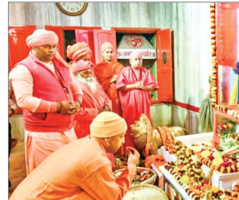
चढ़ाने के बाद मुख्यमंत्री एवं सभी नागरिकों, संतों और श्रद्धालुओं को मकर संक्रांति की हार्दिक बधाई गोरक्षपीठाधीश्वर योगी आदित्यनाथ ने

गोरखपुर। मकर संक्रांति के पावन पर्व पर गोरक्षपीठाधीश्वर एवं मुख्यमंत्री योगी आदित्यनाथ ने मंगलवार को ब्रह्म मुहूर्त में गोरखनाथ मंदिर में नाथपंथ की विशिष्ट परंपरा के अनुसार शिवावतार महायोगी गोरखनाथ को विधि विधान से आस्था की पवित्र खिचड़ी चढ़ाई।