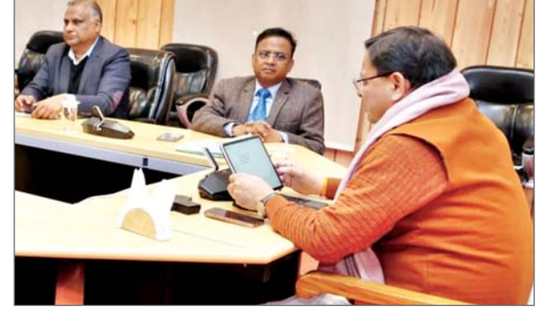
मुख्यमंत्री ने जिलाधिकारी पौड़ी से तत्काल रिपोर्ट भी तलब की है। बता दें कि बस के खाई में गिर जाने से छह लोगों की मृत्यु व डेढ़ दर्जन यात्री घायल हो गए थे। मुख्यमंत्री धामी ने पौड़ी अस्पताल में सामने आयी अत्यवस्थाओं की शिकायत का मुख्यमंत्री पुष्कर सिंह धामी ने संज्ञान लिया है। उन्होंने पौड़ी के जिलाधिकारी से मामले में रिपोर्ट तलब करने के साथ ही, अस्पताल में सभी बुनियादी सुविधायें तत्काल उपलब्ध कराने के निर्देश दिए हैं। मुख्यमंत्री ने बस हादसे में मृतक परिजन को कुल 5-5 लाख और गंभीर घायलों को 1-1 लाख रुपये की सहायता राशि तत्काल उपलब्ध कराये जाने के निर्देश दिये। बस हादसे के घायलों को पौड़ी अस्पताल में समुचित इलाज देने में अत्यवस्था, संबंधित शिकायत पर मुख्यमंत्री पुष्कर सिंह धामी ने कैम्प कार्यालय में उच्चाधिकारियों के साथ बैठक की। उन्होंने इस मामले में पौड़ी के डीएम से रिपोर्ट तलब ...शेष पृष्ठ 14 पर

देहरादून। राज्य के पौड़ी गढ़वाल में पिछले दिनों हुए बस हादसे में घायलों का समुचित इलाज न होने पर रहे रण आंदोलन का मुख्यमंत्री पुष्कर सिंह धामी ने स्वयं संज्ञान लेकर उच्चस्तरीय समीक्षा बैठक की, जिसमें स्वास्थ्य विभाग की कड़ी फटकार लगायी।