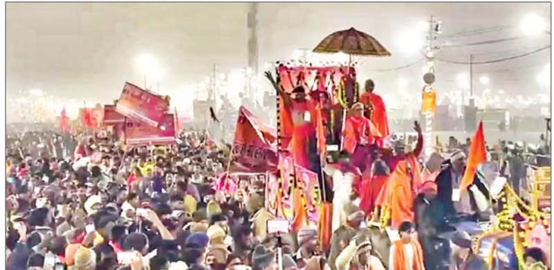
होने पर 144 साल बाद यह महाकुंभ आता है। बहुत भाग्यशाली लोगों को महाकुंभ में स्नान का अवसर मिला है। महानिवाणी अखाड़े से 68 महामंडलेश्वर और हजारों साधु संतों ने ...शेष पृष्ठ 14 पर

महाकुंभ नगर। महाकुंभ के दूसरे स्नान पर्व मकर संक्रांति पर मंगलवार को सुबह से दोपहर तक 13 अखाड़ों के साधु संतों ने बारी-बारी अमृत स्नान किया। मेला प्रशासन के मुताबिक, शाम तक 3.50 करोड़ से अधिक श्रद्धालुओं ने गंगा और पवित्र संगम में आस्था की डुबकी लगाई। अखाड़ों के अमृत स्नान में सबसे पहले सन्यासी अखाड़ों में श्री पंचायती अखाड़ा महानिवाणी और श्री शंभू पंचायती अटल अखाड़ा के साधु संतों ने हर हर महादेव के घोष के साथ संगम पर अमृत स्नान किया।