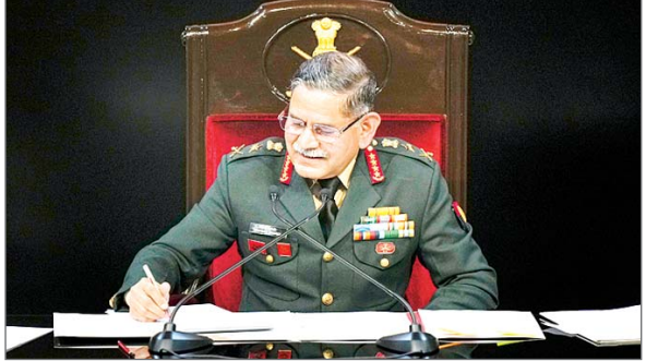
सौंपी गई है ताकि वे बाद में बड़ा मुद्दा न बनें। सेना प्रमुख ने 15 जनवरी को सेना दिवस से पहले एक संवाददाता सम्मेलन को संबोधित करते हुए यह भी कहा कि बफर जोन नाम की कोई चीज नहीं है क्योंकि हिंसा की संभावना से बचने के लिए कुछ क्षेत्रों में गश्त पर अस्थायी रोक लगा दी गई है। अप्रैल 2020 में टकराव शुरू होने के बाद से क्षेत्र में आए बदलावों की चर्चा करते हुए जनरल द्विवेदी ने कहा कि दोनों पक्षों ने क्षेत्र से छेड़छाड़ की है, निर्माण कार्य किए, सैनिकों की तैनाती की और सैन्य साजोसामान का भंडारण किया। उन्होंने

एजेंसी नयी दिल्ली। सेना प्रमुख जनरल उमेश द्विवेदी ने सोमवार को कहा कि पूर्वी लद्दाख में वास्तविक नियंत्रण रेखा पर भारतीय और चीनी सेनाओं के बीच अब भी कुछ अंश तक गतिरोध बरकरार है और दोनों पक्षों को बैठकर इस मुद्दे पर व्यापक समझ बनाने की जरूरत है कि स्थिति को कैसे शांत किया जाए। जनरल द्विवेदी ने वास्तविक नियंत्रण रेखा (एलएससी) पर स्थिति को संवेदनशील लेकिन स्थिर बताया। उन्होंने कहा कि कोर कमांडरों को अब गश्त और मवेशियों को घास चराने से संबंधित मामूली मुद्दों या मामूली विवादों को हल करने की शक्तियां