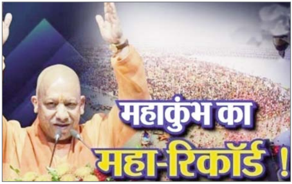
विशालतम आध्यात्मिक एवं सांस्कृतिक समागम महाकुम्भ का आज से तीर्थराज प्रयागराज में आरंभ हो रहा है। अनेकता में एकता की अनुभूति के लिए, आस्था एवं आधुनिकता के संगम में साधना एवं

लखनऊ। उत्तर प्रदेश के मुख्यमंत्री योगी आदित्यनाथ ने सोमवार को महाकुम्भ की शुरुआत पर अपनी शुभकामनाएं दीं, जिसे उन्होंने संस्कृतियों का संगम और अनेकता में एकता का संदेश बताया। पौष पूर्णिमा स्नान के साथ महाकुम्भ मेला सोमवार से प्रारंभ हो गया। मेला अधिकारी के मुताबिक, सुबह आठ बजे तक 40 लाख से अधिक लोगों ने संगम और गंगा में आस्था की डुबकी लगाई। आदित्यनाथ ने एक्स पर लिखा, पौष पूर्णिमा की बधाई। विश्व के