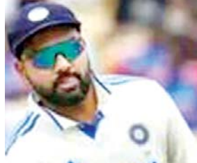
नयी दिल्ली। ऑस्ट्रेलिया दौर पर पांच मैचों की टेस्ट श्रृंखला में लचर

प्रदर्शन के बाद कप्तान रोहित शर्मा और अनुभवी विराट कोहली के भविष्य को लेकर अटकलें लगायी जा रही हैं लेकिन भारत के पूर्व महान हरफनमौला कपिल देव ने सोमवार को यहां कहा कि ये दोनों इतने बड़े खिलाड़ी हैं कि अपने भविष्य को लेकर फैसला खुद कर सकते हैं। ऑस्ट्रेलिया दौर पर कोहली ने पारियों में एक शतक के साथ 190 रन ही बना सकें और बार बार ऑफ स्टम्प से बाहर