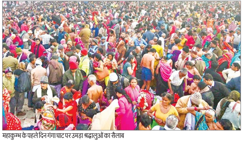
महाकुंभ के पहले दिन गंगा घाट पर उमड़ा श्रद्धालुओं का सेलाब

महाकुंभ नगर। उत्तर प्रदेश के प्रयागराज में पौष पूर्णिमा के स्नान के साथ महाकुंभ मेला सोमवार से प्रारंभ हो गया। मेल प्रशासन के मुताबिक, सोमवार को शाम छह बजे तक 1.65 करोड़ श्रद्धालुओं ने गंगा और संगम में आस्था की डुबकी लगाई। इस दौरान, श्रद्धालुओं पर हेलीकॉप्टर से फूल बरसाए गए। मुख्यमंत्री योगी आदित्यनाथ ने सभी श्रद्धालुओं, संत महात्माओं, कल्पवासियों और आगंतुकों का स्वागत करते हुए महाकुंभ के प्रथम स्नान की शुभकामनाएं दीं। उन्होंने महाकुंभ को भारत की आध्यात्मिक और सांस्कृतिक गरिमा का प्रतीक बताया। प्रयागराज महाकुंभ में सोमवार को पौष पूर्णिमा के स्नान पर्व के सक्षुशल समापन के बाद ...शेष पृष्ठ 14 पर