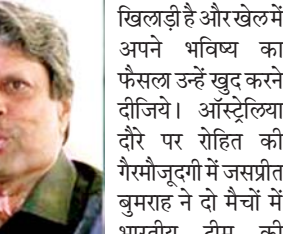
कप्तानी की थी। रोहित की जगह टीम में कप्तान के दावेदारों के बारे में पूछे जाने

भारत के पूर्व महान खिलाड़ी कपिल देव से जब पीजीटीआई (भारतीय पेशेवर गोल्फ टूर) के नये सत्र की घोषणा के लिए आयोजित कार्यक्रम में इन खिलाड़ियों के भविष्य के बारे में पूछा गया तो उन्होंने कहा, विराट और रोहित बहुत बड़े