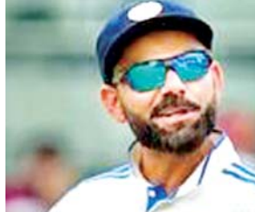
25 विकेट झटककर इसी दौरान टेस्ट में अपने 400 विकेट पूरे किये थे।

विफल रहा। बुमराह भी पांचवें टेस्ट में चोटिल होने के कारण दूसरी पारी में गेंदबाजी नहीं कर सके जिससे ऑस्ट्रेलिया के लिए छोटा लक्ष्य हासिल करना काफी आसान हो गया। बुमराह ने इस दौर पर लगभग 150 ओवर गेंदबाजी कर 32 विकेट झटकें। कपिल ने 1991-92 के ऑस्ट्रेलिया दौर पर बल्ले से योगदान देने के अलावा 284 ओवर गेंदबाजी की थी और श्रृंखला में