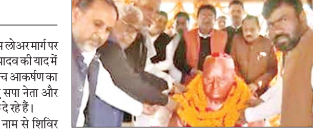
ने दावा किया कि पिछले दो दिनों में पांच से सात हजार लोग इस शिविर में आकर मुलायम की प्रतिमा पर पुष्पांजलि अर्पित कर चुके

महाकुंभ नगर। महाकुंभ के सेक्टर-16 में संगम ले अरमार्ग पर उत्तर प्रदेश के पूर्व मुख्यमंत्री दिवंगत मुलायम सिंह यादव की याद में स्थापित शिविर समाजवादी पार्टी से जुड़े लोगों के बीच आकर्षण का केंद्र बन गया है। प्रदेश के विभिन्न जिलों से आए सपा नेता और समर्थक शिविर में पहुंचकर मुलायम को श्रद्धांजलि दे रहे हैं।