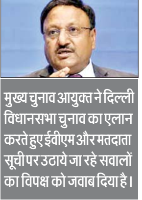
मुख्य चुनाव आयुक्त ने दिल्ली विधानसभा चुनाव का एलान करते हुए ईवीएम और मतदाता सूची पर उठाने जा रहे सवालों का विपक्ष को जवाब दिया है।