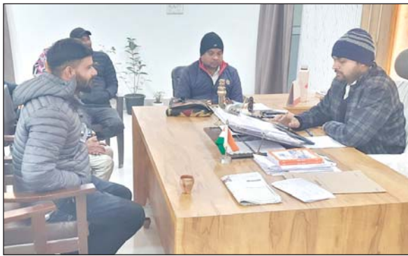
जिला संवाददाता (VOL)

महोली। सीतापुर कड़ाके की ठंड के बावजूद बुधवार को एसडीएम ने तहसील में जनसुनवाई के दौरान फरियादियों की समस्याओं को सुनकर उनका समाधान कराया। मुख्यमंत्री की मनसा है कि हर फरियादी को तहसील स्तर पर ही समस्याओं का निस्तारण किया जाए।