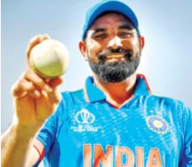
इस टूर्नामेंट के लिये टीम में जगह पक्की नहीं है हालांकि वे पिछले साल विश्व

सिडनी। खराब फॉर्म से जूझ रहे रोहित शर्मा और विराट कोहली भारतीय एक दिवसीय टीम में बल्लेबाजी की धुरी होंगे लेकिन कम से कम तीन सौनियर खिलाड़ी ऐसे हैं जिनके नाम पर चयनकर्ताओं को माथापच्ची करनी होगी जब वे चैम्पियंस ट्रॉफी के लिये भारतीय टीम का चयन करने बैठेंगे। केएल राहुल, मोहम्मद शमी और रविंद्र जडेजा को 19 फरवरी से शुरू हो रहे