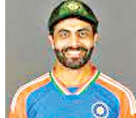
बांग्लादेश के खिलाफ पहला मैच 20 फरवरी को खेला जायेगा। भारत ने

नहीं है। उनके करीबी प्रतिद्वंद्वियों में इशान किशन ने विजय हजारे ट्रॉफी में रन नहीं बनाये जबकि संजू सैमसन को शुरूआती मैचों से बाहर रहने के बाद कएल टीम में चुना नहीं गया। कोच गौतम गंभीर की अगर चयन मामलों में अभी भी चलती है तो सैमसन उनके पसंदीदा होने के कारण टीम में आ सकते हैं। भारत को चैम्पियंस ट्रॉफी में अपने मैच दुबई में खेलने हैं और