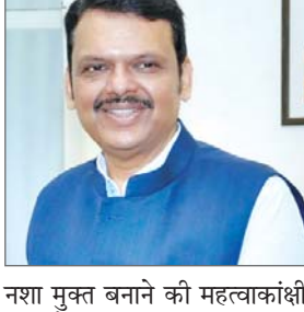
नशीले पदार्थों के जरिये देश को कमजोर करने की साजिश: फडणवीस

एजेंसी ठाणे। महाराष्ट्र के मुख्यमंत्री देवेंद्र फडणवीस ने बुधवार को कहा कि भारत एक मजबूत राष्ट्र और पांचवीं सबसे बड़ी अर्थव्यवस्था के रूप में उभर रहा है, लेकिन देश को अंदर से कमजोर करने के लिए इसके युवाओं को नशीले पदार्थों के जरिए निशाना बनाया जा रहा है।