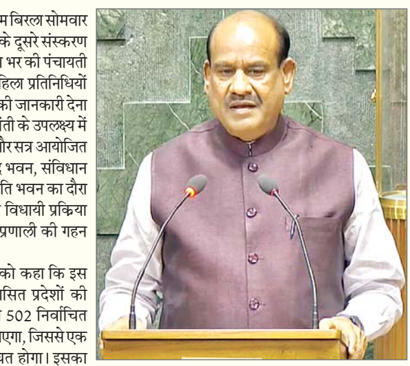
महिला एवं बाल विकास मंत्री अन्नपूर्णा देवी, राष्ट्रीय महिला आयोग की प्रमुख विजया रघाटकर इस कार्यक्रम में शामिल होंगी। जनजातीय कार्य मंत्री जुएल ओराम एक सत्र को संबोधित करेंगे।

नयी दिल्ली। लोकसभा अध्यक्ष ओम बिरला सोमवार को पंचायत से पार्लियामेंट कार्यक्रम के दूसरे संस्करण का उद्घाटन करेंगे, जिसका उद्देश्य देश भर की पंचायती राज संस्थाओं की 500 से अधिक महिला प्रतिनिधियों को संविधान और संसदीय प्रक्रियाओं की जानकारी देना है। भगवान बिरसा मुंडा की 150वीं जयंती के उपलक्ष्य में आयोजित इस कार्यक्रम में कार्यशाला और सत्र आयोजित किये जाएंगे, प्रतिभागियों को नये संसद भवन, संविधान सदन, प्रधानमंत्री संग्रहालय और राष्ट्रपति भवन का दौरा कराया जाएगा, जिससे उन्हें भारत की विधायी प्रक्रिया और लोकतांत्रिक संस्थाओं की कार्यप्रणाली की गहन जानकारी मिलेगी।