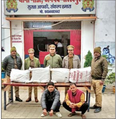
युवकों की तलाशी ली गई। पुलिस ने उनके पास से तीस किलो अवैध गांजा