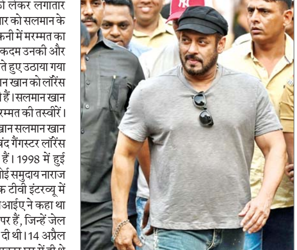
की हत्या बता दें, सलमान खान के सबसे करीबी दोस्त और एनसीपी नेता बाबा सिद्दीकी की 12 अक्टूबर, 2024 को हत्या कर दी गई थी। वहीं, लॉरेंस गैंग ने इस घटना की जिम्मेदारी ली थी। इसके बाद से ही सलमान के गैलेक्सी अपार्टमेंट के बाहर तगड़ी सिक्योरिटी तैनात कर दी गई।

मुंबई। सलमान खान की सुरक्षा को लेकर लगातार कदम उठाए जा रहे हैं। इसी कड़ी में रविवार को सलमान के बांद्रा स्थित गैलेक्सी अपार्टमेंट की बालकनी में मरम्मत का काम जारी है। रिपोर्ट्स के मुताबिक, यह कदम उनकी और उनके परिवार की सुरक्षा को ध्यान में रखते हुए उठाया गया है। दरअसल, पिछले कुछ समय से सलमान खान को लॉरेंस गैंग से जान से मारने की धमकियां मिल रही हैं। सलमान खान के अपार्टमेंट की बालकनी में चल रहे मरम्मत की तस्वीरें।