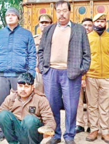
अपनी चमकदार खाल और मांस के लिए तस्करों के निशाने पर रहती है। विशेषज्ञों का मानना है कि इन कछुओं की अंतरराष्ट्रीय बाजार में बड़ी मांग है। गिरफ्तारी तस्कर से मिले सुरागों से पता चलता है कि यह तस्कारी का एक बड़ा नेटवर्क है, जो उत्तर प्रदेश से शुरू होकर बांग्लादेश तक फैला है। प्राथमिक जांच में सामने आया है कि

इटावा। मैनपुरी जनपद में वन्यजीव तस्करों के खिलाफ एक बड़ी कार्रवाई में अवैध बाजारों में बेचे जाने की योजना थी वन विभाग के अधिकारियों ने इस कार्रवाई को वन्यजीव संरक्षण की दिशा में एक बड़ी सफलता बताया है। उन्होंने जनता से अपील की है कि यदि उन्हें किसी भी प्रकार की अवैध गतिविधि की जानकारी मिले, तो तुरंत सूचना दें इस प्रकार की तस्कारी न केवल वन्यजीवों के अस्तित्व के लिए खतरा है, बल्कि पर्यावरण संतुलन की भी गंभीर रूप से प्रभावित करती है। वन विभाग और एसटीएफ की यह कार्रवाई निश्चित रूप से तस्करों के मनोबल को तोड़ने का काम करेगी गिरफ्तार तस्कर से गहन पूछताछ की जा रही है। इस नेटवर्क के अन्य सदस्यों और संफेदपोश नेताओं के नाम सामने आने की संभावना है। वन विभाग ने साफ किया है कि दोषियों को कानून के दायरे में लाकर सख्त से सख्त कार्रवाई की जाएगी।