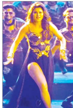
जनवरी 2025 को वर्ल्डवाइड रिलीज होगी। गाना रिलीज होते ही कई यूजर्स गाने की कोरियोग्राफी और डांस स्टेप देखकर भड़क गए हैं।

मुंबई। हाल ही में साउथ फिल्म डाकू महाराज का गाना उर्वशी दिबिडी रिलीज हुआ है। नए गाने में फिल्म के लीड एक्टर नंदमुरी बालाकृष्णा के साथ उर्वशी रौतेला डांस करती नजर आई हैं। हालांकि कई सोशल मीडिया यूजर्स और फैस इस गाने को अक्षील और घटिया कह रहे हैं।