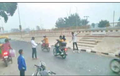
चक्कर में दुर्घटना के भी शिकार हो रहे है। बावजूद इसके युथ इससे सीख नहीं ले रहे, की यह जोखिम भरा भी हो सकता है। ऐसा ही एक मामला गगहा थाना क्षेत्र में देखने को मिला। जहां एक युवक सड़क पर बेफिक्र होकर रील बना रहा था। उसके बगल से गाड़ियां गुजर रही थीं। वह इस सब से अंजान होकर रील बना रहा था। उसे जरा भी अंदाजा नहीं था कि उसके इस तरह के कार्य से वह हादसे का शिकार हो सकता है। लोगो ने मांग की है कि पुलिस प्रशासन को इस तरह सड़कों पर रील खनाने पर प्रतिबंध लगाना चाहिए।

मझगांवा, गोरखपुर। रील खनाने का शोक युवाओं के सिर पर चढ़कर बोल रहा। रील खनाने के जुनून में सड़कों पर रील खनाना बेहद खतरनाक साबित हो रहा। रील खनाने के चक्कर में दुर्घटना के भी शिकार हो रहे है। बावजूद इसके युथ इससे सीख नहीं ले रहे, की यह जोखिम भरा भी हो सकता है। ऐसा ही एक मामला गगहा थाना क्षेत्र में देखने को मिला। जहां एक युवक सड़क पर बेफिक्र होकर रील बना रहा था। उसके बगल से गाड़ियां गुजर रही थीं। वह इस सब से अंजान होकर रील बना रहा था। उसे जरा भी अंदाजा नहीं था कि उसके इस तरह के कार्य से वह हादसे का शिकार हो सकता है। लोगो ने मांग की है कि पुलिस प्रशासन को इस तरह सड़कों पर रील खनाने पर प्रतिबंध लगाना चाहिए।