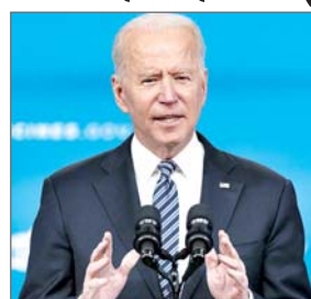
महत्वपूर्ण काम किए हैं। पूर्व निर्धारित कार्यक्रमों के कारण अर्जेंटीना के फुटबॉल खिलाड़ी लियोनेल मेस्सी अमेरिकी राष्ट्रपति से पुरस्कार प्राप्त करने के लिए व्यक्तिगत रूप से व्हाइट हाउस में उपस्थित नहीं हो सके। बाइडेन ने व्हाइट हाउस के ईस्ट रूम में आयोजित समारोह में कहा, राष्ट्रपति

वाशिंगटन। अमेरिका के निवर्तमान राष्ट्रपति जो बाइडेन ने पूर्व विदेश मंत्री हिलेरी क्लिंटन, विवादित निवेशक जॉर्ज सोरोस, वोगा की प्रधान संपादक एना विंटेर, वैज्ञानिक बिल नेई और अभिनेता डेनजेल वाशिंगटन सहित 19 लोगों को शनिवार को देश का सर्वोच्च नागरिक पुरस्कार प्रेसिडेंशियल मेडल ऑफ फ्रीडम प्रदान किया। प्रेसिडेंशियल मेडल ऑफ फ्रीडम उन व्यक्तियों को प्रदान किया जाता है जिन्होंने अमेरिका की समृद्धि, उसके मूल्यों, सुरक्षा, विश्व शांति को बढ़ावा देने में महत्वपूर्ण योगदान दिया हो या सार्वजनिक और निजी क्षेत्रों में