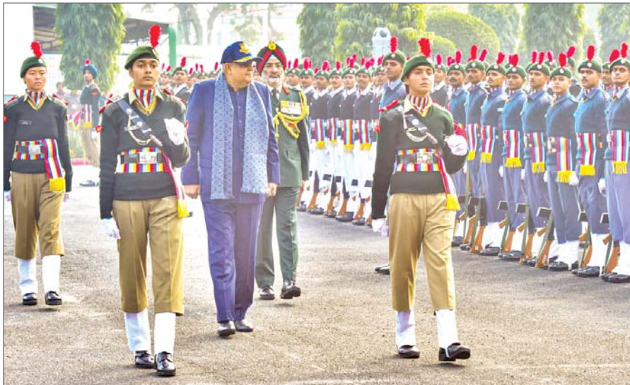
एक सपना नहीं है। यह हमारा निश्चित लक्ष्य है। उन्होंने कहा, आप सभी 2047

नयी दिल्ली। उपराष्ट्रपति जगदीप धनखड़ ने रविवार को कहा कि 2047 तक भारत को विकसित राष्ट्र बनाने का दृष्टिकोण अब एक सपना नहीं, बल्कि एक निश्चित लक्ष्य है। राष्ट्रीय कैडेट कोर (एनसीसी) के गणतंत्र दिवस शिविर के औपचारिक उद्घाटन के अवसर पर दिल्ली छावनी में एक समारोह को संबोधित करते हुए धनखड़ ने यह टिप्पणी की। उन्होंने एनसीसी सदस्यों की प्रशंसा की और कहा कि वे राष्ट्र की सेवा को भावना के साथ एकता व अनुशासन को बढ़ावा देने के लिए जाने जाते हैं।