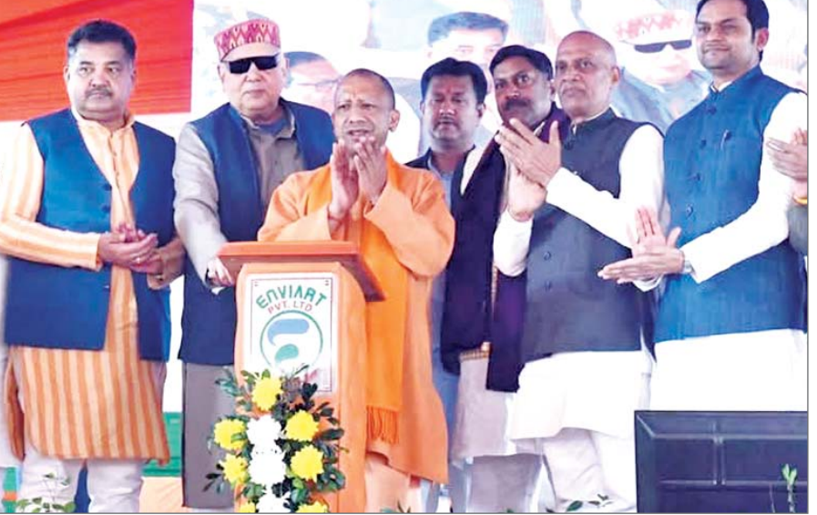
विकास कार्यों का लोकार्पण किया। जनता इंटर कॉलेज चरगावा में हुए समारोह में सीएम ने कहा कि विकास की ये परियोजनाएं आने वाले समय में नए गोरखपुर का दर्शन और भी सशक्त रूप में करालेंगी। सीएम योगी ने डबल इंजन सरकार में आए बदलाव की चर्चा करते हुए कहा कि एक समय समाजवादी पार्टी की

जिला संवाददाता गोरखपुर। मुख्यमंत्री योगी आदित्यनाथ ने कहा कि पिछली सरकारें जहां विकास के आयामों, उद्योगों, कारखानों को बंद करने और उन्हें बेचने में लगी रहती थीं, वहीं भाजपा की डबल इंजन सरकार नव सृजन और नया निर्माण कर विकास का माहौल बनाने में जुटी हुई है। मिसाल के तौर पर गोरखपुर के बंद खाद कारखाने और पिपराइच की बंद चीनी मिल को देखा जा सकता है। पूर्व की सरकारों ने जहां इसे बंद कर दिया था और बेचने की तैयारी में थीं, वहीं डबल इंजन की सरकार ने इन्हें फिर से चला कर दिखा दिया। मुख्यमंत्री ने कहा कि डबल इंजन सरकार में नए साल में उत्तर प्रदेश नई गति से विकास पथ पर आगे बढ़ेगा। यहां नौकरी और रोजगार के अवसर और तेजी से बढ़ेंगे और यहां के युवाओं को कहीं बाहर नहीं जाना पड़ेगा। सीएम योगी नए साल के दूसरे दिन गुरुवार को गोरखपुर में रोड कनेक्टिविटी, किसान हित और खाद एवं दवा सुरक्षा से जुड़ी 1533 करोड़ रुपये की नौ विकास परियोजनाओं के शिलान्यास और लोकार्पण समारोह को संबोधित कर रहे थे। मुख्यमंत्री ने 1478 करोड़ 80 लाख 68 हजार रुपये के चार विकास कार्यों का शिलान्यास तथा 53 करोड़ 73 लाख 66 हजार रुपये के पांच