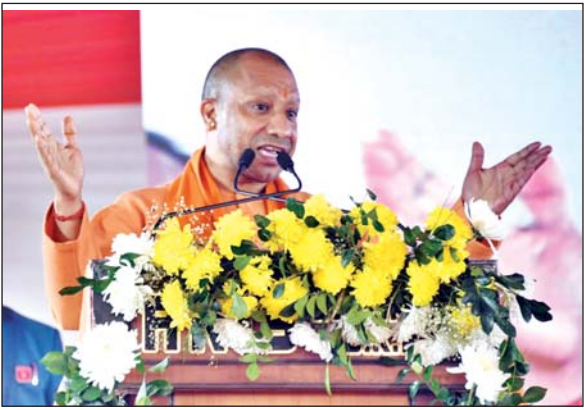
जिला संवाददाता (vol)

गोरखपुर। मुख्यमंत्री योगी आदित्यनाथ ने कहा कि कार्य करने का जज्बा होना चाहिए। समाज के प्रति जवाबदेही का जज्बा होगा तो सभी समस्याओं का समाधान भी हो जाएगा। उन्होंने कहा कि गोरखपुर में पांच साल में 15 से 20 हजार करोड़ रुपये का निवेश धरातल पर उतर चुका है। उद्योग लगने से हजारों युवाओं को रोजगार की गारंटी मिली है। आज गोरखपुर में चार विश्वविद्यालय हैं, वेटरिनरी कॉलेज भी बन रहा है। तो वही आज गोरखपुर में पिंपराइच की चीनी मिल चल रही है, खाद कारखाना चल रहा है, गोरखपुर में चिड़ियाघर भी खुल गया है। गोरखपुर में लखनऊ, वाराणसी सहित सभी तरफ से शानदार रोड कनेक्टिविटी है। विकास होने से रोजगार के नए-नए अवसर भी आ रहे हैं। उन्होंने ने कहा कि आज का गोरखपुर आधुनिक भारत के आधुनिक उत्तर प्रदेश के आधुनिक गोरखपुर का दर्शन करा रहा है। जबकि सपा की सरकार में गोरखपुर में बिजली नहीं मिलती थी, लोगों को स्वास्थ्य सुविधाएं नहीं मिलती थीं। बीआरडी