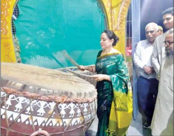
जिला संवाददाता (vol)

मथुरा। वृन्दावन-छठीकरा राधाकुण्ड रोड, बहुलावन में स्थित ब्रज लोक कला एवं शिल्प संग्रहालय को देखने पहुंची मथुरा जनपद की सांसद श्रीमती हेमा मालिनी ने संग्रहालय में रखी वस्तुओं को देखा व यहां रखी गयी ब्रज संस्कृति की वस्तुओं के संग्रह में कितना समय व परिश्रम लगा है, जिसे युवा पीढ़ी को समझना चाहिए व इसे वर्षों तक