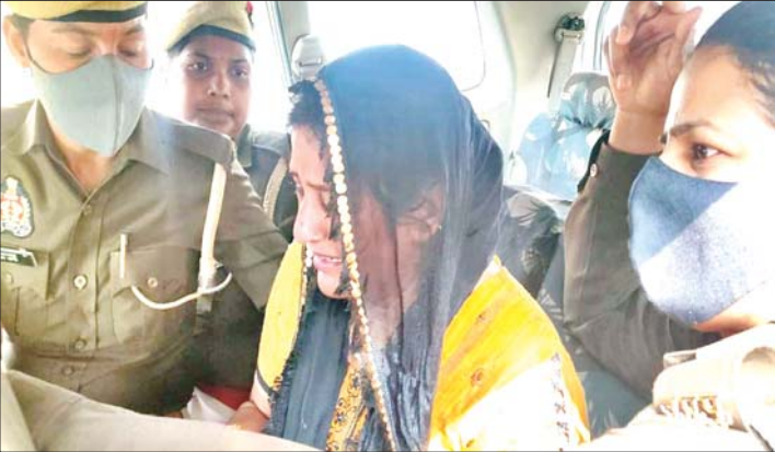
विशेष संवाददाता (vol)

लखनऊ पुलिस ने पकड़ा, गाजियाबाद से आई थी महिला, गांव वालों ने किया जमीन पर कब्जा