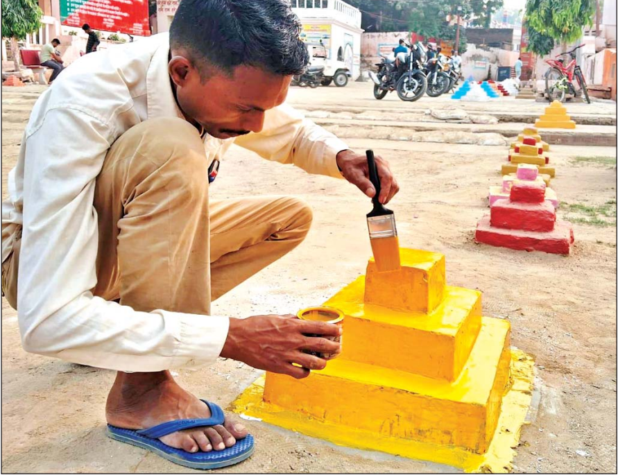
सुलतानपुर ( वीओएल )। आस्था का महापर्व डाला छठ मंगलवार को नहाय-खाय के साथ

शुरू हो रहा है। इसको लेकर व्रत रखने वाली महिलाओं ने तैयारियां पूरी कर ली हैं। पूजन व अर्घ्य के