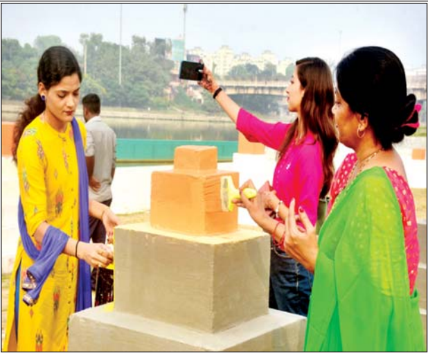
पूजा की वेदी के साथ सेल्फी लेती महिलाएं