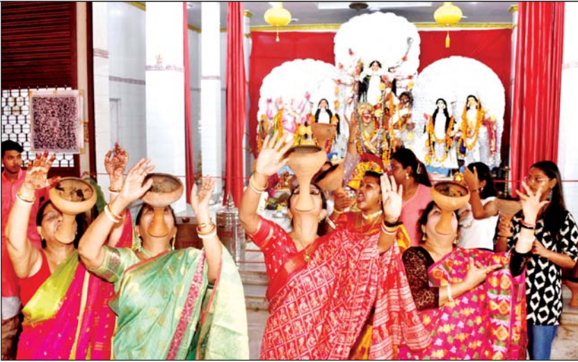
महाअष्टमी व नवमी पर दुर्गा पूजा पंडाल में धनुचि आरती करती महिलाएं मां भवानी का कमल के फूल व दीये से सजाते भक्तगण पूजा पंडाल में नृत्य करती महिलाएं