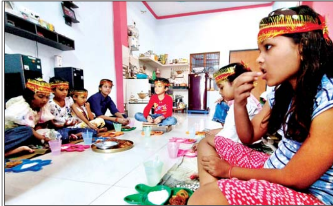
वरिष्ठ संवाददाता (vol)

लखनऊ। नवरात्र के नौवें दिन शुक्रवार को अष्टमी और महानवमी पर मंदिरों व घरों में देवी के सिद्धिदात्री स्वरूप का पूजन किया गया। इस मौके पर हवन और धार्मिक अनुष्ठान हुए। विधि-विधान से देवी की आरती के बाद घरों में कन्या पूजन किया गया। कन्याओं के पैर धोकर उन्हें हलवा, पुरी, चने, खीर आदि का भोग लगाया गया। साथ ही उन्हें चुनरी, उपहार और भेंट दिए। शारदीय नवरात्र के नौवें दिन सोमवार को मां आदिशक्ति भगवती के नौवें स्वरूप मां सिद्धिदात्री की आराधना के लिए देवी मंदिरों में भक्तों की भीड़ उमड़ पड़ी। चौक का बड़ी काली जी मंदिर हो या फिर बीकेटी का चान्द्रिका देवी मंदिर हो हर जगह मां के भक्तों का मेला दिख रहा था। मंदिरों में जय माता दी और सर्व मंगल मांगल्ये शिवे सर्वार्थ साधिके