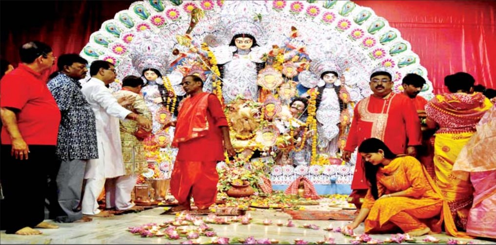
वरिष्ठ संवाददाता (vol)

लखनऊ। लोबान के धूप से मां की आरती-पूजन के बीच ढाकियों की थाप ने शुक्रवार को शहर में कोलकाता की झलक से रूबरू कराया। दिन में हुई विशेष महाअष्टमी पूजन ने उत्सास दोगुना किया। मां की स्तुति के लिये पंडाल दोपहर से ही खचाखच भरे रहे। चंडी स्वरूपा मां दुर्गा की विशेष पूजा-आराधना संधि पूजा पंडालों में की गई। बुराईयों के नाश के लिये मां दुर्गा का ॐ जयन्ती मंगला काली भद्रकाली कपालिनी, दुर्गा क्षमा शिवा धात्री स्वाहा स्वाधा नमोस्तु ते। मंत्र पढ़ा गया। यहां कोलकाता से आए पंडित जी ने विशेष पूजा कराई। विशेष आयोजन रामकृष्ण मठ में हुआ।