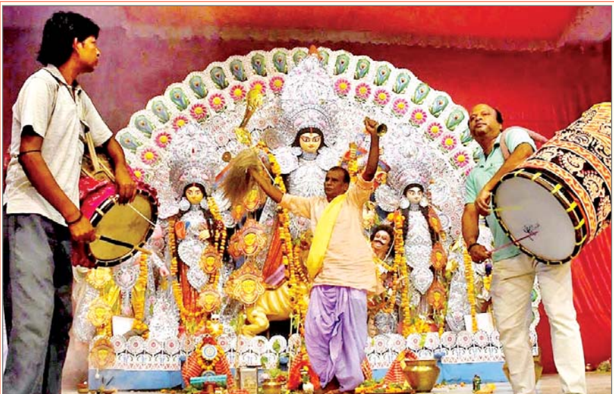
लखनऊ स्थित बंगाली क्लब में दुर्गा पूजा पंडल में आरती करते पुजारी

उन्होंने कहा जम्मू-कश्मीर में छह से आठ प्रतिशत मतदान से 60 प्रतिशत से अधिक मतदान होना यह दर्शाता है कि लोग लोकतांत्रिक व्यवस्था में विश्वास करते हैं और अनुच्छेद 370 को हटाने का समर्थन करते हैं। नड्डा ने कहा कि आज आतंकवाद पर नियंत्रण है और भाजपा का शासन सिर्फ सत्ता में बैठने के लिए नहीं है, बल्कि देश को सुरक्षित बनाने के लिए है। उन्होंने दुनिया में व्याप्त परिदृश्य का जिक्र करते हुए कहा कि मोदी ने जोर देकर कहा है कि यह युद्ध का नहीं बल्कि विकास का समय है और सभी को साथ लेकर चलना चाहिए। सत्तारूढ़ भाजपा ने हरियाणा में लगातार तीसरी बार सत्ता बरकरार रखी और विधानसभा चुनावों में कांग्रेस की वापसी के प्रयासों को विफल कर दिया। जम्मू-कश्मीर में भी भाजपा ने उल्लेखनीय बढ़त हासिल की है और 90 में से 29 सीट जीती है। इस केंद्र शासित प्रदेश में नेशनल कॉन्फ्रेंस-कांग्रेस गठबंधन सरकार बनाने जा रहा है।