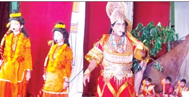
वरिष्ठ संवाददाता (vol)

लखनऊ। श्री रामलीला समिति महानगर की ओर से आयोजित रामलीला महोत्सव में शुक्रवार को भगवान शंकर की आरती के साथ लीला की शुरूआत हुई। लीला में दिखाया कि हनुमान जी लंका की प्रवेश करते हैं माता जानकी से मिलने के बाद रावण की अशोक वाटिका को उजाड़ कर तहस-नहस कर देते हैं। रावण का पुत्र मेघनाथ उन्हें नागफंस में बांध कर अपने पिता के सम्मुख ले जाता है जहां रावण हनुमान जी की पूंछ में कपड़े लपेटकर तेल में डुबोकर आग लगाने का आदेश देता है। उसके बाद हनुमान जी सोने की लंका के आग लगा देते हैं। प्रभु श्रीराम सेतुबंध रामेश्वर में शिवलिंग स्थापना करते हैं। यह खबर जब रावण को मिलती है तो वह अपने भाई विभीषण से सलाह लेता है कि क्या किया जाए विभीषण की रावण से कहते हैं की रामचंद्र जी से बैर न लें और सीता जी को लौटा दें,