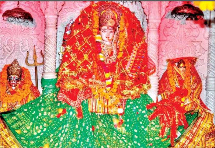
वरिष्ठ संवाददाता (vol)

लखनऊ। शारदीय नवरात्र के पांचवें दिन सोमवार को दुर्गा मां के पंचम स्वरूप स्कंदमाता की पूजा अर्चना की गयी। भोर से ही मंदिरों में श्रद्धालुओं के आने का सिलसिला शुरू हो गया। सुबह मंदिर के कपाट खुलने के साथ ही मां के जयकारे गूंजने लगे। शंख और घंटे-घड़ियाल की ध्वनियों संग आरती के बाद मां को भोग लगाया गया।