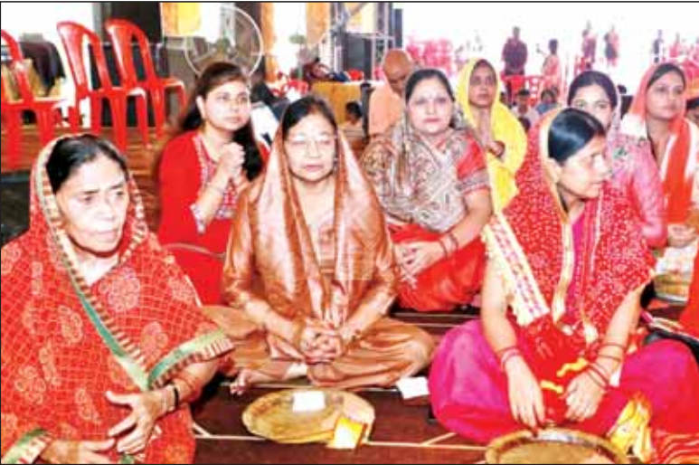
सिंदूराभिषेक में भाग लेती महिलाएं