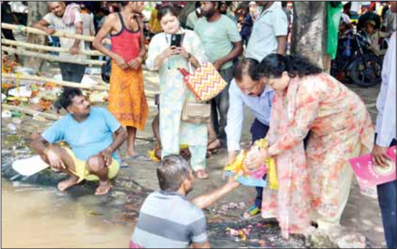
भगवान गणेश की मूर्ति का विसर्जन करते भक्तगण