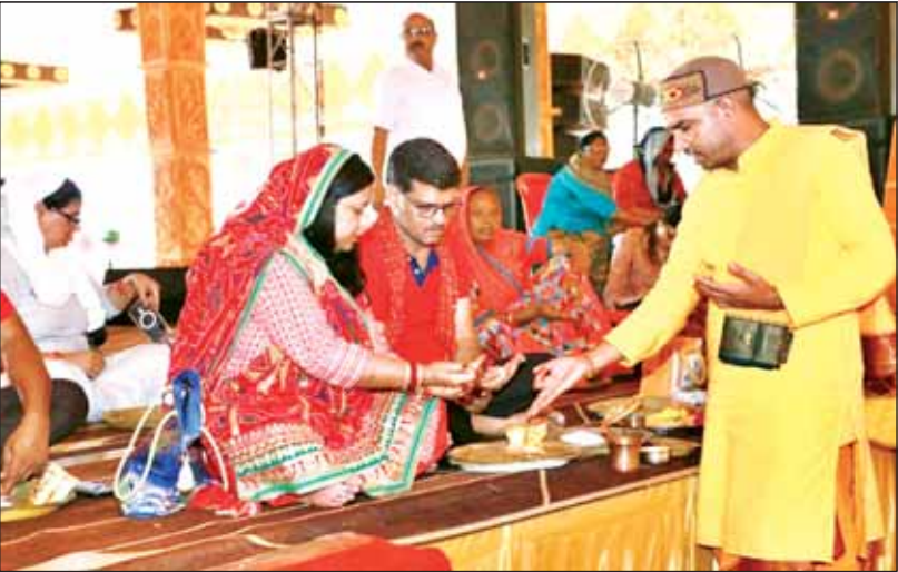
गणेश उत्सव के सातवें दिन बप्पा का सिंदूराभिषेक करते श्रद्धालु