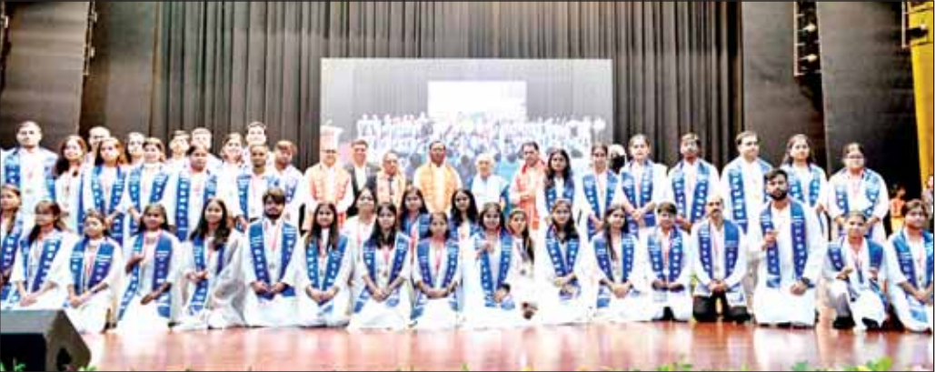
विशेष संवाददाता (vol)

पुनर्वास विवि में धूमधाम से 11वां दीक्षांत समारोह सम्पन्न, 130 मेधावियों को 159 पदकों से किया गया अलंकृत, 14 दिव्यांग विद्यार्थियों को मिले 19 पदक