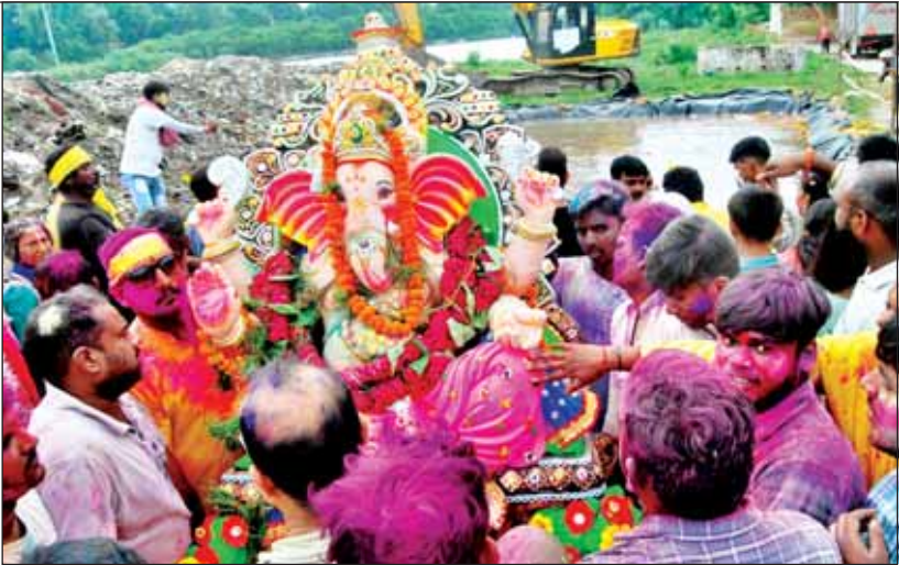
गणपति बप्पा की मूर्ति का विसर्जन करते श्रद्धालु