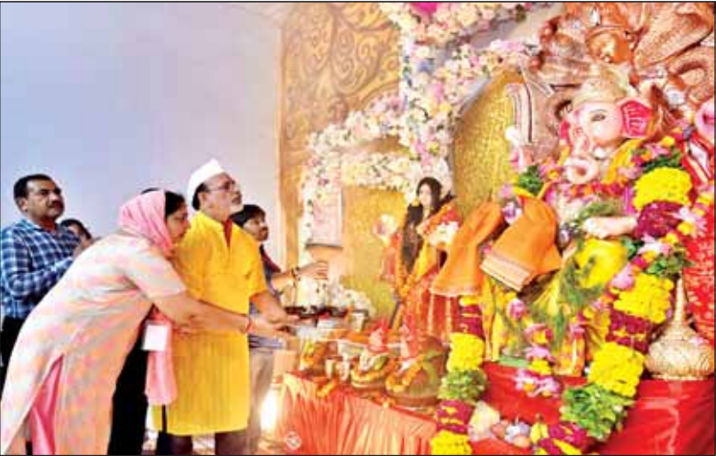
पत्रकारपुरम में गणेश उत्सव के पांचवें दिन बप्पा की आरती करते भक्त