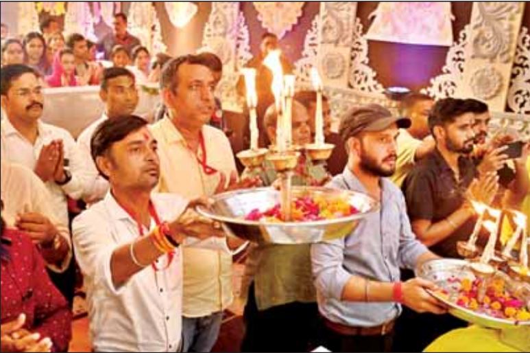
बप्पा की आरती में शामिल होते भक्तगण