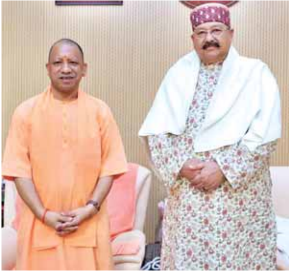
मुख्यमंत्री योगी आदित्यनाथ से उनके सरकारी आवास पर उत्तराखण्ड सरकार के केबिनेट मंत्री सतपाल महाराज ने की शिष्टाचार भेंट

5000 स्वच्छ सारथी क्लब प्रदेश में स्थापित किये गये हैं। विभिन्न अभियानों के माध्यम से क्लबों की सहभागिता करावी जायेगी। स्कूल परिसरों को प्लास्टिक मुक्त, शिक्षण संस्थानों के परिसर की साफ-सफाई तथा छात्रों को स्वच्छता की प्रतिज्ञा दिलायी जायेगी। स्वच्छता लक्षित इकाई के अंतर्गत निकायों में ऐसे समस्त स्थान जहां नियमित रूप से साफ-सफाई नहीं हो पाती है, को पोर्टल पर ब्लैक स्पॉट के रूप में चिन्हित कर पखवाड़े के अंतर्गत विभिन्न स्वयं सहायता समूह व अन्य स्टेक होल्डर के माध्यम से स्वच्छ बनाया जायेगा। सफाई मित्र सुरक्षा शिविर के अंतर्गत स्वच्छता कर्मियों को स्वास्थ्य जांच और स्वास्थ्य बोमा कराया जायेगा तथा उनके लिए उपलब्ध सरकारी योजनाओं के बारे में जागरूक किया जायेगा।