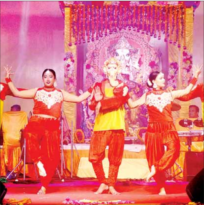
बीबीडी परिसर में श्री गणेश महोत्सव के दूसरे दिन नृत्य प्रस्तुत करते कलाकार