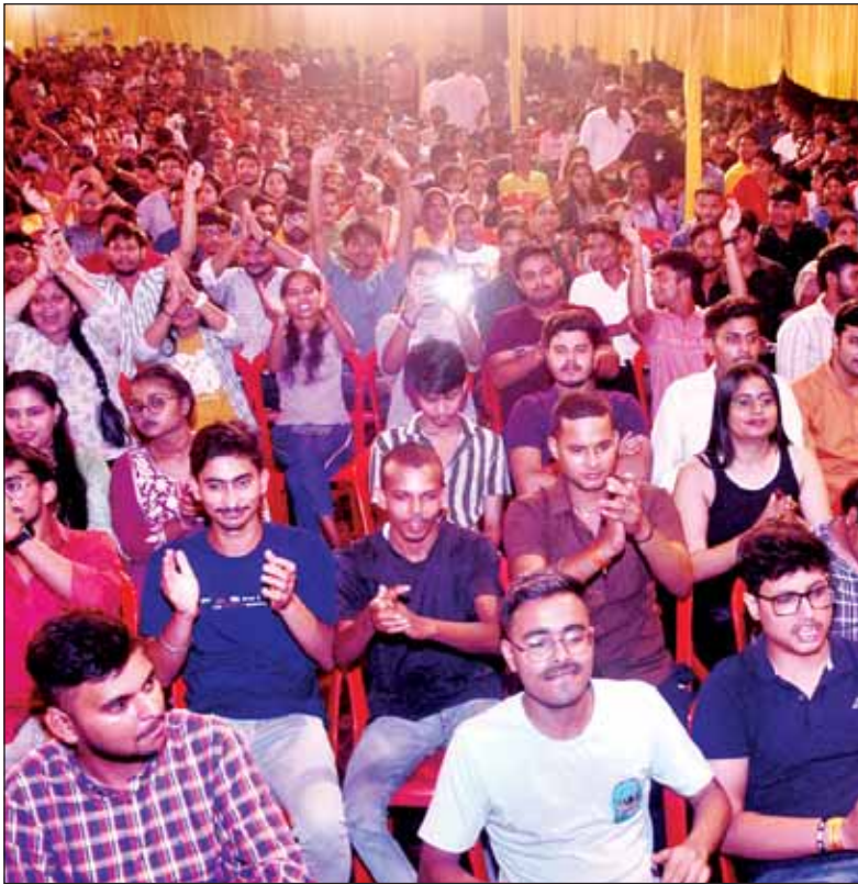
सांस्कृतिक कार्यक्रम का आनंद उठाते दर्शकगण