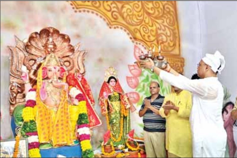
गोमती नगर में बप्पा की आरती करते भक्तगण