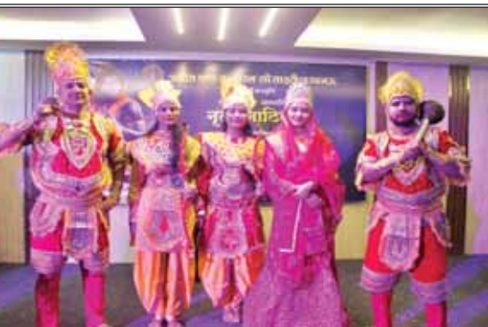
वरिष्ठ संवाददाता (vol)

औषधि, शास्त्र अभय और आहार दान देने का व्यवहार त्याग है और राग द्वेष का त्याग उत्तम त्याग धर्म है। उत्तम आकिंचन्य: आत्म द्रव्य के अतिरिक्त जीवन में कुछ भी कार्यकारी नहीं है अतः परपदार्थों में ममत्व भाव का त्याग उत्तम आकिंचन्य धर्म का पालन है। उत्तम ब्रह्मचर्य : देहाशक्ति से ऊपर उठकर शुद्ध बुद्धि निरंतर आत्मा का ध्यान करते हुए उसी में स्थिर हो जाना उत्तम ब्रह्मचर्य है। पर्युषणज महापर्व समभाव, क्षमा, त्याग और वैराग्य भाव की शिक्षा देकर मानव को स्वभाव में स्थिर करता है। इसलिए पर्युषण पर्व आत्मा के हितकारी है। क्षमा वाणी पर्व: अंत में क्षमा वाणी पर्व का आयोजन किया जाता है जिसमें जैन समाज के सभी लोग क्षमावाणी की पूजा करते हैं तत्पश्चात मंदिर में सभी लोग आपस में गले लगते हैं एवं छोटे बड़े के पैर छूते हैं और क्षमा भाव की याचना करते हैं। इस दिन यह देखा गया है कि साल भर के अंदर किए गए कार्यों के लिए आपस में क्षमा मांगने के पश्चात लोगों का मन एक दूसरे के प्रति निर्मल होता है और वर्षों की कटुता भी आपस में दूर होती है। इस पर्व के आने से पूर्व सभी मंदिरों में साफ सफाई मूर्तियों की साफ सफाई एवं सभी शास्त्रों की देखरेख करी जाती है और लखनऊ के 12 जैन मंदिरों में इस बार सभी दोनों में विशेष पूजा अर्चना भी होगी।