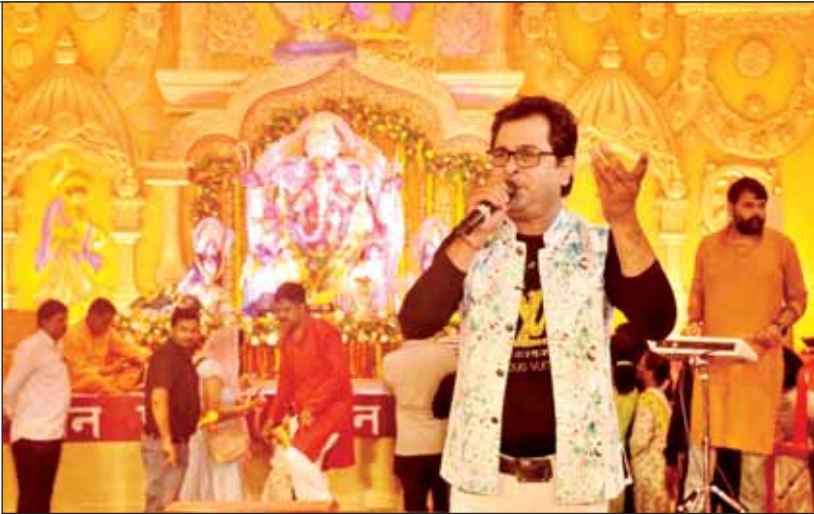
पूजा पंडाल में भजन प्रस्तुत करते गायक