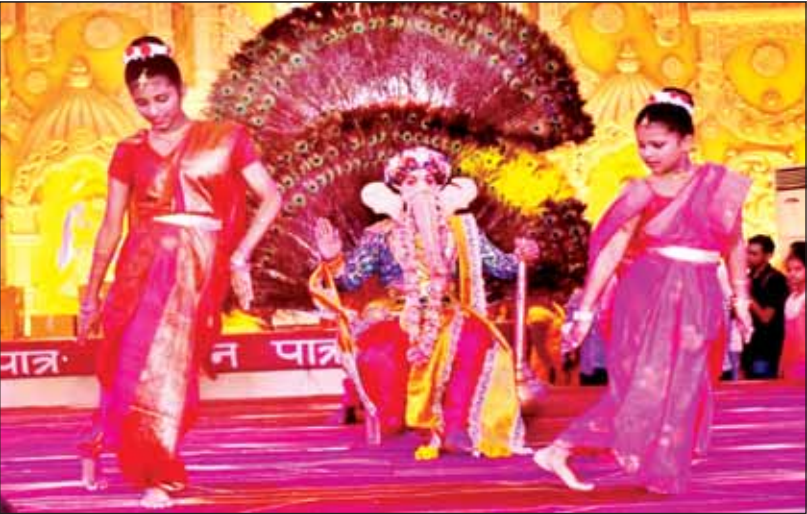
गणेश महोत्सव के पहले दिन झुलेलाल वाटिका में सांस्कृतिक प्रस्तुति देते कलाकार